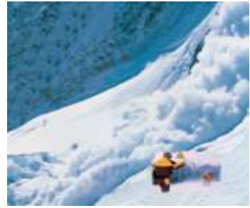
Resim 1. 2: Doğal afetler