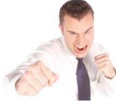
Resim 3.3: Saldırgan kişi

Hastayı bağlama kararı verildiğinde mutlaka olayı daha önce yapmış tecrübeli personelin olması, işlemin daha güvenli, etkili ve kısa sürede halledilmesini sağlar. Hastaların bağlanması yapılırken olay hızlı ve güvenli bir şekilde yapılmalı ve mümkün olan en kısa sürede sonlandırılmalıdır.