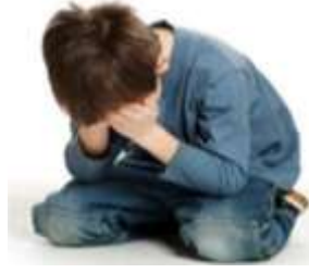
Resim 2. 3: Okul çağındaki çocuklarda TSS tepkileri