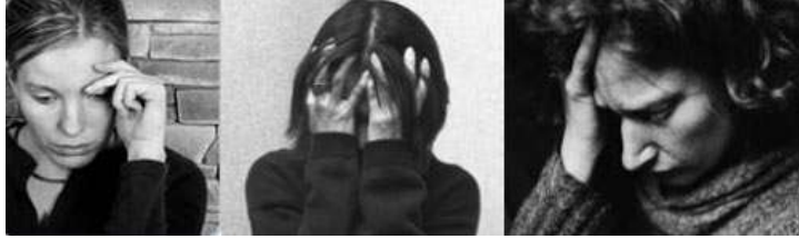
Resim 2. 5: Depresyon belirtileri

Depresyon tablolarında yapılacak tedaviler genellikle, 2 ile 6 ay arasında sürer. İlaç ve zaman zaman psikoterapinin birlikte uygulandığı tedavilerdir.