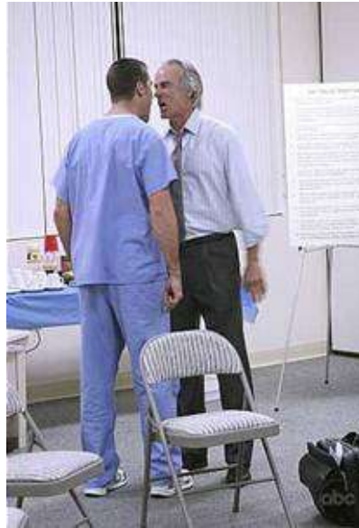
Resim 3.2: Ajite ve saldırgan hasta