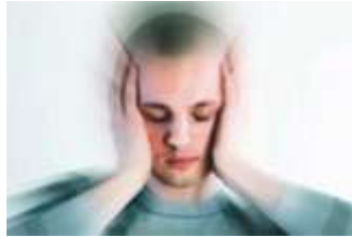
Resim 2. 4: Ergenlerde TSS tepkileri