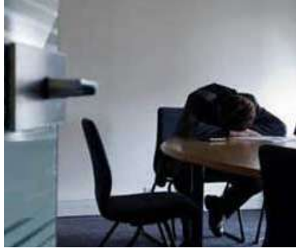
Resim 4.1: Tükenmişlik belirtisi