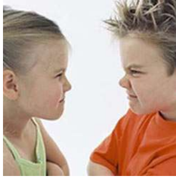
Resim 2.2: Okul öncesi çocuklarda TSS tepkileri

Bu yaş grubundaki çocuklar kötü olayların kendi kötü düşüncelerinden kaynaklandığını düşünüp üzülebilir. Bu tip hayalci düşünce zihinsel bulanıklık, utanç, kaygı ve dünyayla ilgili yanlış yorumlar yapmaya yol açabilir.