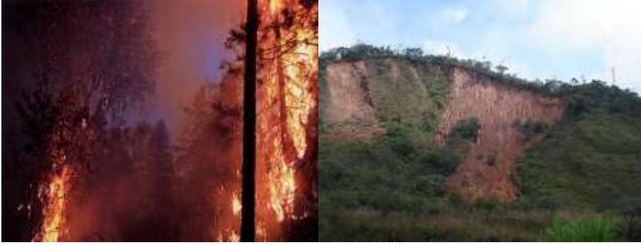
Resim 1.1: Yapay afetler