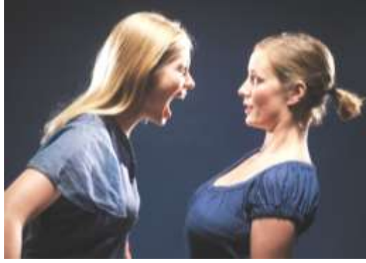
Resim 3.1: Öfkeli kişi

Acil serviste bu duygu durumlarının yaşanması her an mümkündür. Fakat uygunsuz ortaya çıkması patolojik bir durum teşkil eder.