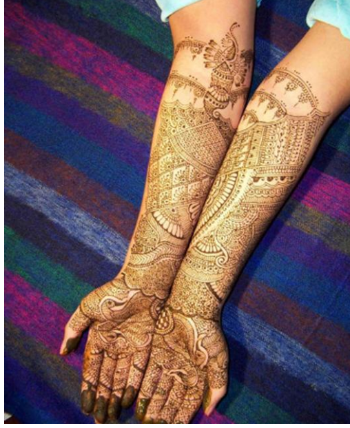
Resim2.5.: Kolda kına uygulaması