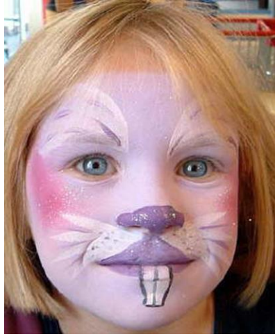
Resim1.1: Pembe tavşan

Dramatik etkinliklerde, eğlence aktivitelerinde; faaliyetin canlılığını, derinliğini, etkinliğini, ilgi çekiciliğini artırmak amacıyla, değişik yüz boyaları ve makyaj malzemeleri ile bitki, hayvan ve benzeri farklı figür ve imgelerin yüze uygulanması çalışmalarıdır.