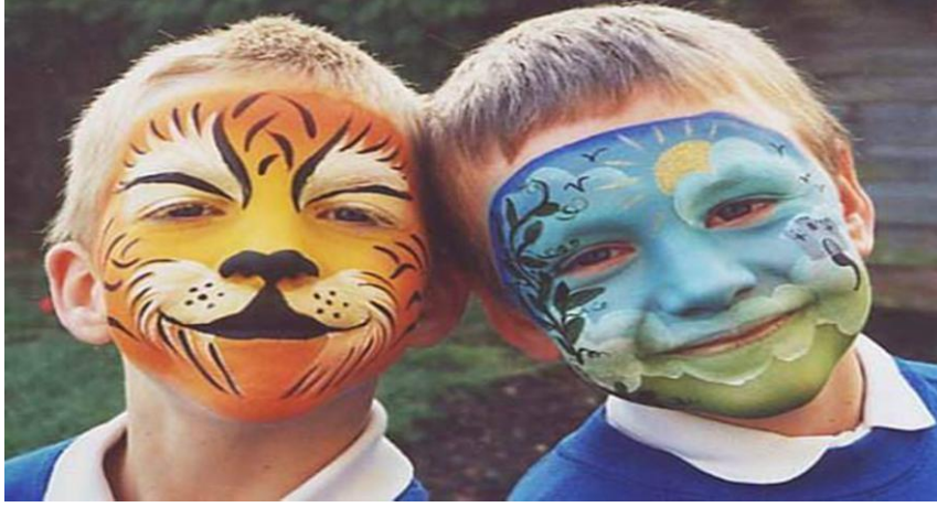
Resim 1.3:Hayvan ve doğa figürleri

Doğum günü partilerinde ve bazı özel günlerde çocukların tercihlerine göre yüzlerine hayvan figürleri (kelebek, kedi, aslan, panda ve hayvan çizgi film kahramanları) çalışılabilir.