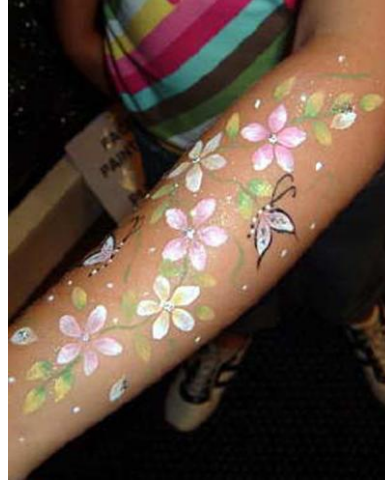
Resim2.2: Kolda çiçekler

Vücut boyama sanatı artistik görsel ifadedir; şeklindeki tanımında belirtildiğı gibi insan vücudu estetik bir tablonun tuvali olarak kullanılır. Bu eşsiz ve renkli tablo, altında pek çok anlam taşır. Vücut boyama yaptırılanlar ve meraklıları yapılan işi sanatsal faaliyet olarak görürken, müstehcen ve riskli bulanlar vardır. Ancak bizimle ilgili kısmı; boyna, ellere ve kollara, omuzlara, ayak ve bacaklara uygulanabilecek, göze hoş görünen ve çocuğı, anne-babayı mutlu eden çalışmalardır.