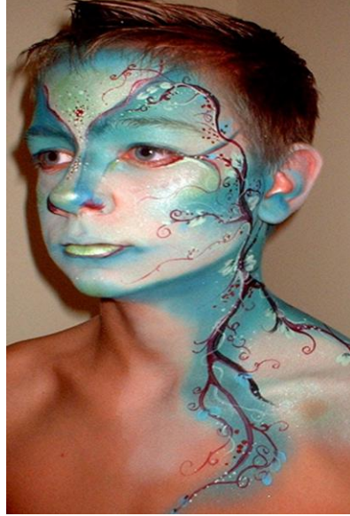
Resim:2.1 Yüz ve vücut boyama

Vücuda uygulanan sanatsal çalışmalar (body arts) içerisinde yer alan vücut boyama, bazıları tarafından sanatın en eski hâli olarak kabul edilir.