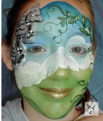
Resim1.2: Yüzde bahar

Güzel olma, göze hoş görünme demektir. Zihnimize hoş giden duygular oluşturan düşünce, olay, obje vb' nin estetik değer taşıdığını söyleyebiliriz. Yüz boyama çalışmalarının beğenilmesi onun estetik değer taşıdığını gösterecektir. Bu nedenle dizaynlar, yapılacak faaliyetin sebebine ve arzu edilen zorluk derecesine göre seçilmelidir. Yüzdeki yara izi veya hayalet yüzü gibi dizaynlar özel jeller ve soluk renkli boyalar gerektirmekte ve arzu edilen etkinin elde edilmesi ustalık istemektedir. Estetik görüntü için tema, göz önünde bulundurulmalıdır. Ayrıca dizaynı taşıyacak çocuğun kendisini rahat hissetmesi sağlanmalıdır. Korsan gibi görünmek isteyen bir çocuğa Örümcek Adam veya köpek balığı figürünü yaptırması konusunda baskı yapmanın ne anlamı nede faydası vardır.