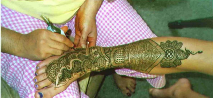
Resim 2.4: Kına uygulaması

Günümüz toplumlarında eski çağlardaki anlamını taşımasa da vücut boyama hâlâ bizlerle birlikte. Vücut boyamayı dekorasyon, müzik ve dansla birleştirerek sahne sanatlarının her türlü, moda gösterisi veya okul gösterisi için mükemmel bir ortam yaratmak mümkündür. Bu sanat; parti planlayıcıları, profesyonel fotoğrafçılar, tiyatro grupları, model ajansları, film stüdyoları ve eğlence hizmetlerinde çalışan tüm personel tarafından kullanılabilir.