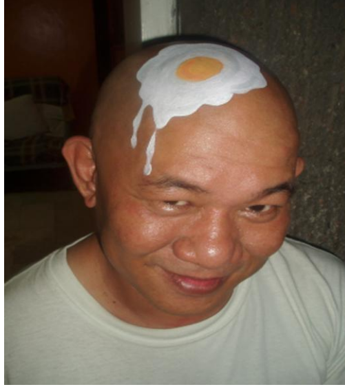
Resim 2.3: Başa uygulama

Dövme ve diğer vücut sanatlarının aksine vücut boyama geçicidir. Cilde uygulanır, birkaç saat kullanılır. Ancak kına uygulamaları veya kına ile yapılan geçici dövme uygulamaları birkaç hafta kullanılabilir. Vücut boyamayı birkaç saat kullandıktan sonra bir yıkamayla, boyamadan önceki halinize dönebilirsiniz. Vücut boyama sanatı, vücudun bazı bölümlerine yapılan küçük dizaynlar olabildiği gibi, en iyi etkinin yaratıldığı tüm vücuda uygulanan dizaynlar olabilir. Bazen desenler, doğrudan vücuda bazen de badi türü kıyafetlerin üzerine uygulanabilir. Vücut boyama tiyatro, dans, pandomim ve animasyon gösterilerinde etkin olarak kullanılır.