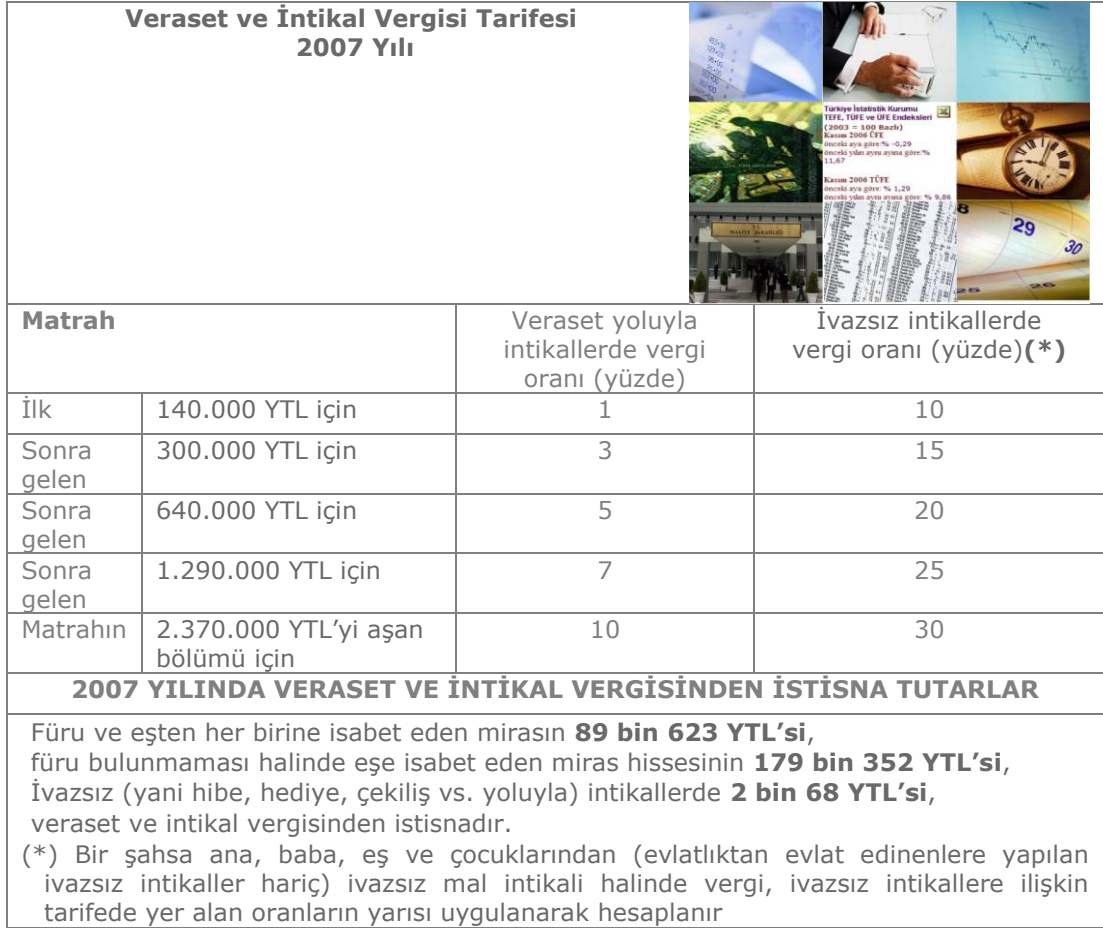
Tablo 2.7: 2007 yılı veraset ve intikal vergisi tarifesi