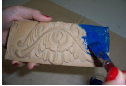
Resim 2.4: Objenin karışımla kaplanması

Kaplanan yüzeyin kurumasından sonra varağın objeye yapışmasını sağlayan miksiyon sürülür. Miksiyon dışında zamklar, jelatin, alkol ve kola da kullanılır (Resim 2.7, Resim 2.8, Resim 2.9).