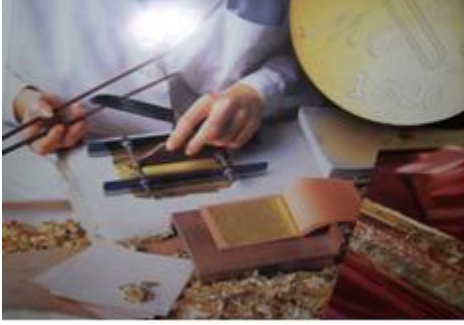
Resim 1.3: Varakların istenilen ebatta kesilmesi