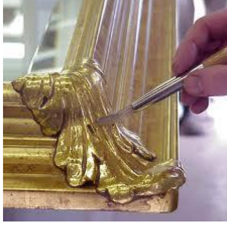
Resim 3.6: Örnek uygulama parçası

Varaklı eserlerin bakım ve onarımını aşağıda Resim 3.6’da verilen parça üzerinde birlikte yapalım.