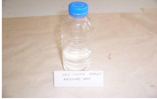
Resim 3.7: Non iyonik sabun