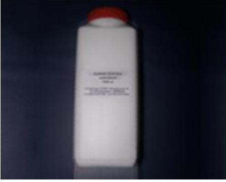
Resim 1.7: Süt miksiyon

Sürme işleminde özel varak fırçaları kullanılmalıdır (Resim 1.8). Kuruma süresi kısa olduğu için hızlı hareket edilerek altın yapıştırılmalıdır. Miksiyon çabuk kurduğundan daha çok profesyonellerin kullandığı bir yapıştırıcıdır. Miksiyon dışında zamklar, jelatin, alkol ve kola kullanılır.