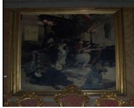
Resim 1.16: Varağı yapılmış ve bitmiş çerçeve