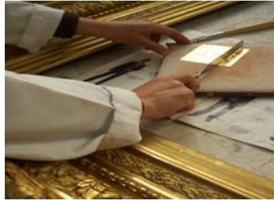
Resim 1.9: Güderi üzerinde varağın kesilmesi

Objenin yüzeyine uygun büyüklükte yaprak hâlindeki 8x8 cm'lik altın varaklar, güderi üzerinde keskin bıçaklarla veya makasla istenilen büyüklükte kesilerek yapıştırılmaya hazır hâle getirilir (Resim 1.9, Resim 1.10).