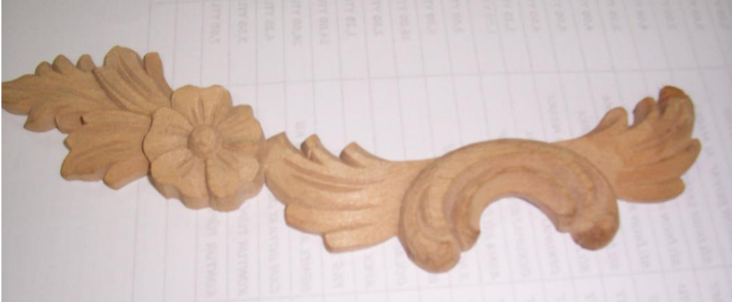
Resim 2.17: Varak örneği