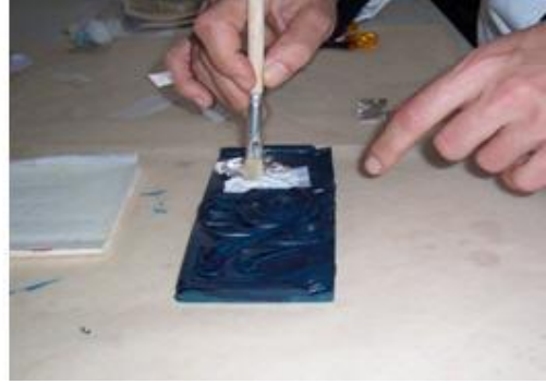
Resim 2.12: Fırça ile varak uygulanması