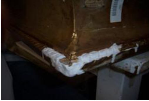
Resim 3.8: Alçı dökülerek kalıp alınması