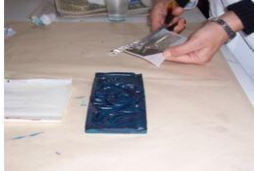
Resim 2.10: Gümüş varağın kesilmesi