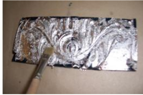
Resim 2.14: Fırça ile varak uygulanması

Daha sonra gümüş varak kaplamalı yüzey, mazgala veya mühre (akik taşı) kullanılarak yüzey parlatılıp en iyi sonuç alınır (Resim 2.16).