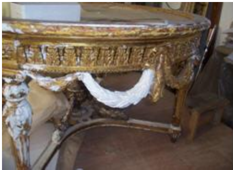
Resim 3.11: Objede tamamlama yapılması