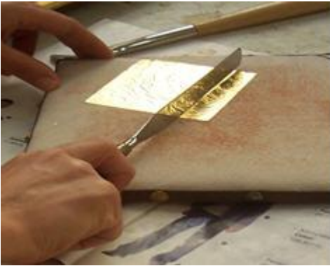
Resim 3.4: Varakların istenilen ebatta kesilmesi

Kuruma süresinin sonunda varak kaplanır. Son olarak da "jade" taşından yapılan "mazgala" isimli alet ile parlatılarak kaplama işlemi tamamlanır.