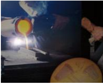
Resim 1.1: Altının eritilerek kalıba dökülmesi

Altın şeridin, ince tirşe (parşömen)ler ve sığırın kör bağırsağından elde edilen zarlar arasında dövülerek şeffaf yapraklar hâline getirilmesine altın varak denir (Resim 1.1, 1.2). İnceltileen altın varaklar 8x8 cm ebadında kesilerek kullanılır (Resim 1.3). Bir defterde 25 yaprak bulunur (Resim 1.4). Altın varak pahalı olduğundan daha çok imitasyon varaklar kullanılır. Ebatları 16x16cm'dir.