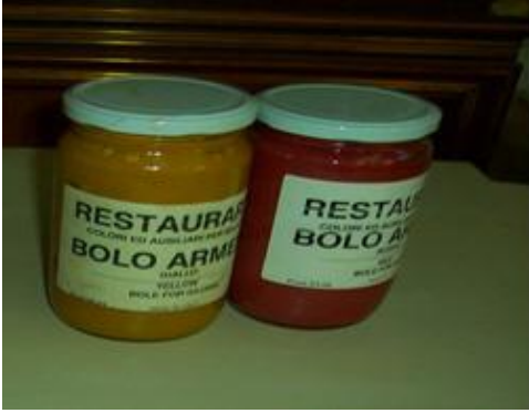
Resim 3.2: Bolo (lambez) kırmızı toprak