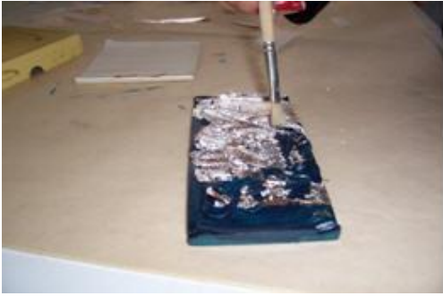
Resim 2.13: Fırça ile varak uygulanması