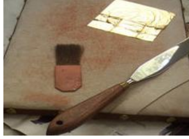
Resim 1.10: Fırça, bıçak, güderi, altın varak