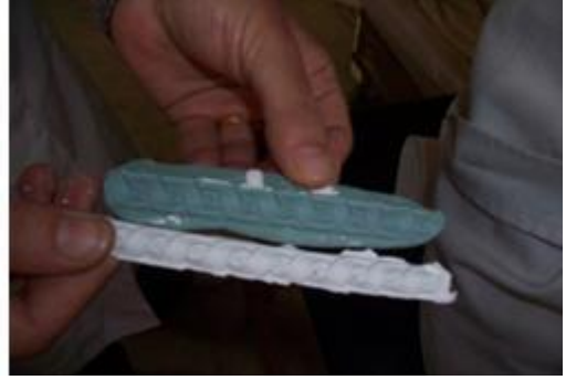
Resim 3.9: Alınmış olan kalıpla tütleme Yapılması