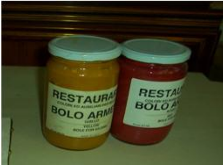
Resim 1.5: Lam bez (kırmızı toprak)

Altın varak kaplanacak olan objenin ham yüzeyi ince zımpara ile herhangi bir pürüz kalmayacak şekilde iyice zımparalanır (Resim 1.6). Daha sonra bez ve fırça ile yüzeyde toz kalmayacak şekilde temizlenir, pürüzsüz bir hâle getirilir. Zımpara aşamasından sonra kırmızı renkte olan ve "lambez" denilen kırmızı killi toprak, su ile karıştırılır ve eşya bu karışımla kaplanır (Resim 1.5). Kaplanan kilin kurumasından sonra varağın objeye yapışmasını sağlayan miksiyon sürülür.