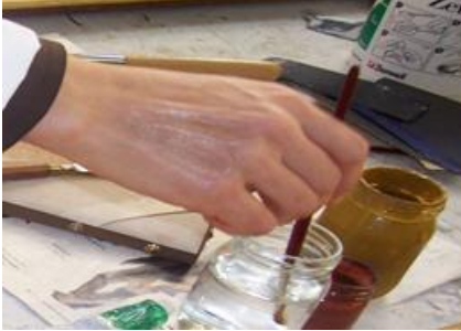
Resim 1.11: Miksiyon (yapıştırıcı)

Miksiyonun yüzeye sürülmesinden (Resim 1.11, Resim 1.12) sonra kesilen altın varak parçaları, fırça da elektriklenme yapılarak varağın fırçaya yapışması sağlanır (Resim 1.13). Yapışan varak parçaları objenin yüzeyine adapte edilerek kaplama işlemine başlanır (Resim 1.14). Bütün bu işlemlerden sonra altın üzerine pamuk (avuç içine yuvarlatılmalı) ile tampon yapılarak zemine altının nüfus edilmesi sağlanır. Daha sonra sakal fırçası tabir edilen yumuşak uçlu fırça ile hafifçe dairesel hareketlerle temizlik işlemi yapılmalıdır. Eğer altın üzerine nemlilik var ise pamuk ve fırça temizliği için bir süre daha beklenmeli, yüzey tamamen kuruduktan sonra fırça temizliği yapılmalıdır.