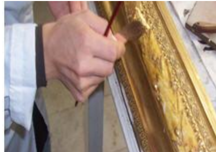
Resim 1.14: Varağın fırçayla yüzeye uygulanması