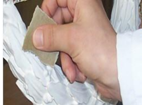
Resim 1.6: Objenin zımparalanması