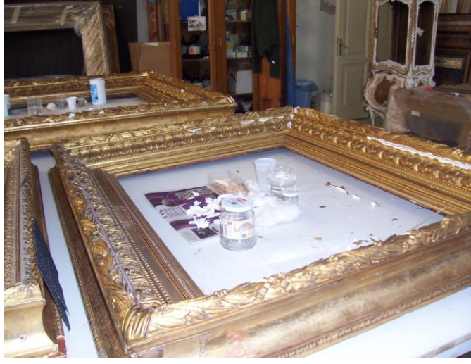
Resim 3.1: Onarımı yapılacak eserin belgelenmesi