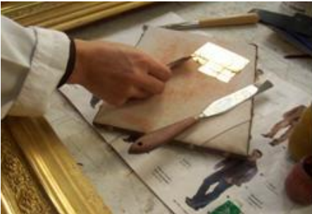
Resim 1.13: Fırçayla varağın alınması