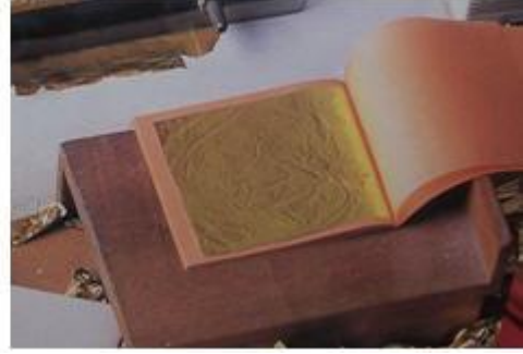
Resim 1.4: Defter içinde altın varak yapraklar