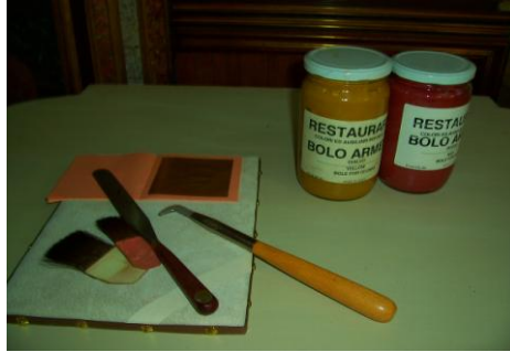
Resim 3.10 Bolo (Ermeni kili- lambez- kırmızı toprak)