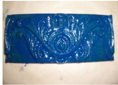
Resim 2.6: Objenin tamamen kaplanması