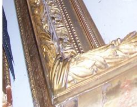
Resim 3.3: Bolo sürülmüş çerçeve