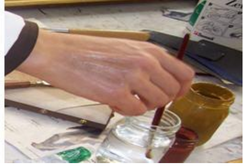
Resim 2.8: Hazırlanmış miksiyonun alınması