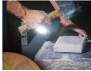
Resim 1.2: Altının tirşe ve zarlar arasında dövülmesi