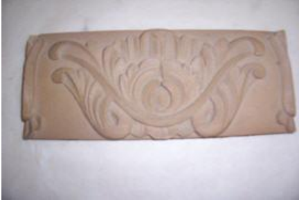
Resim 2.3: Zımparalanmış obje

Gümüş varak kaplanacak olan objenin yüzeyi zımparalanarak pürüzsüz hâle getirilir (Resim 2.3). Daha sonra gümüş varak yapımında kullanılmak üzere hazırlanan koyu mavi akrilik veya metalik boya ile boyanır (Resim 2.4, Resim 2.5, Resim 2.6).