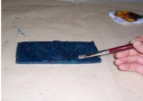
Resim 2.9: Miksiyonun yüzeye sürülmesi

Objenin yüzeyine uygun büyüklükte yaprak hâlindeki gümüş varaklar, güderi üzerinde makas veya keskin bıçaklarla kesilerek hazır hâle getirilir. Miksiyonun yüzeye sürülmesinden sonra kesilen gümüş varak parçalarıyla yüzey kaplanır (Resim 2.10, Resim 2.11).