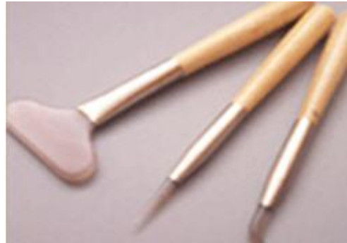
Resim 2.16: Mühre (akik taşı)