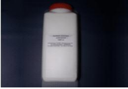
Resim 2.7: Süt miksiyon