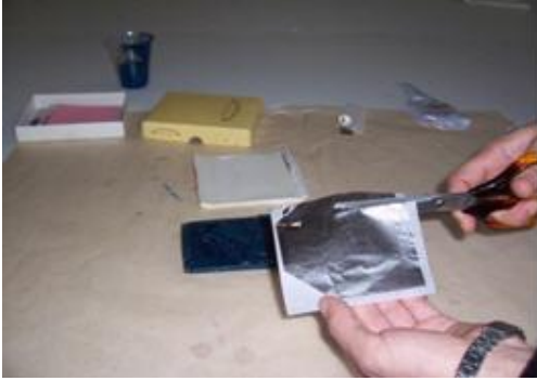
Resim 2.11: Gümüş varağın kesilmesi