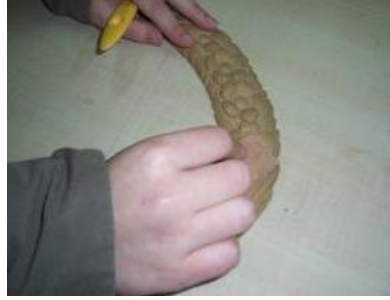
Resim 2.2: Obje zımparalama ve temizleme