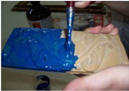
Resim 2.5: Objenin boyanması

Kaplanan yüzeyin kurumasından sonra varağın objeye yapışmasını sağlayan miksiyon sürülür. Miksiyon dışında zamklar, jelatin, alkol ve kola da kullanılır (Resim 2.7, Resim 2.8, Resim 2.9).