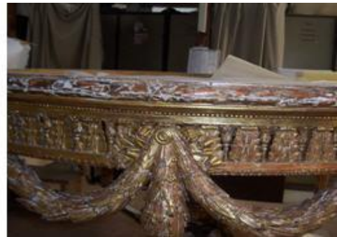
Resim 3.12: Objede tamamlama ve eskitme