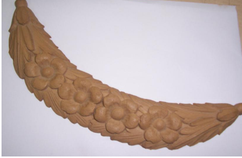
Resim 1.17: Varak örneği