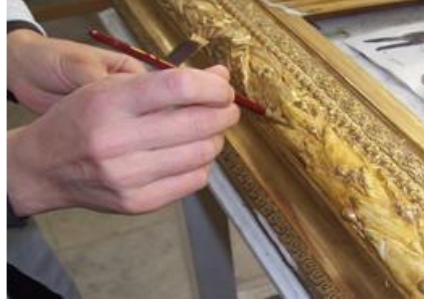
Resim 1.12: Miksiyonun fırçayla yüzeye sürülmesi