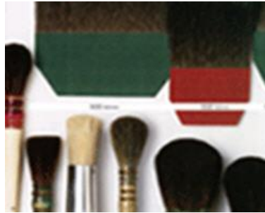
Resim 2.1 Varak uygulama ve temizleme fırçaları

Varak yapılacak ahşap veya alçı yüzey ince zımpara ile herhangi bir pürüz kalmayacak şekilde zımparalanır. Daha sonra bez ve fırça ile yüzeyde toz kalmayacak şekilde temizlenir (Resim 2.1 ).