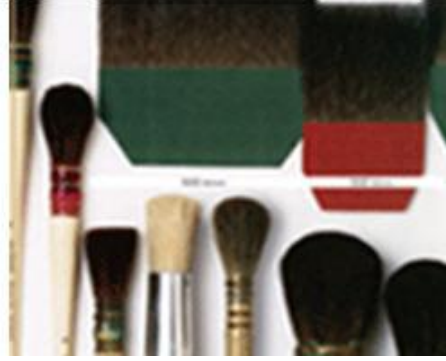
Resim 1.8: Varak uygulama fırçaları