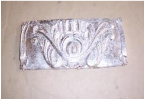
Resim 2.15: Mazgala ile parlatılmış gümüş varak

Daha sonra gümüş varak kaplamalı yüzey, mazgala veya mühre (akik taşı) kullanılarak yüzey parlatılıp en iyi sonuç alınır (Resim 2.16).