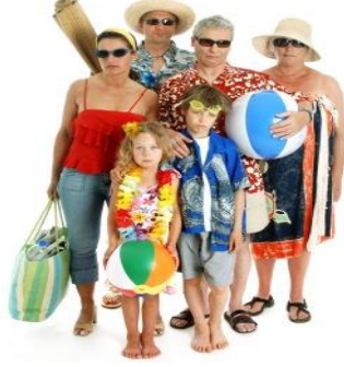
Resim 1.1: Turistler

Günümüzde turizm insan hayatının toplumsal, kültürel, ekonomik, politik yönleri ile yakından ilgili olmakla birlikte, psikoloji ile de yakından ilgilidir. Toplum bilimciler bu önemli olaya önceleri gereken ilgiyi göstermemişler, turizme karşı olumsuz bir tutum takınarak turizmin insanlar, toplum ve kültür üzerindeki olumsuz etkilerini vurgulamayı tercih etmişlerdir. Turizmin psikologlar tarafından incelenmesine, turizmin insanlar için önemli bir sorun yaratmayan bir eğlence ve zevk hayatı olarak görülmesi neden olmuştur. Aslında psikoloji ile turizm arasında çok yakın bir bağlantının bulunduğu görülmektedir. Turistlerin hareketleri büyük ölçüde psikolojik etmenlerden kaynaklanmakta; psikolojik etmenlere göre biçimlenmektedir. Her şeyden önce insanların seyahat etme yönünde güdülenmesi ve tatillerini geçirmek için belirli bir seçenek üzerinde karar vermeleri psikolojik bir süreçtir. Ayrıca seyahat sırasında bireylerin düşünme yapısında ve tutumlarında oluşan değişimler, bunların davranışları üzerindeki etkileri, seyahat ve tatil hayatının gerginlik ve güçlüklerine uyum yapabilmek için insanların geliştirdiği tepkiler, turizmin ve turistlerin, yerli halkın psikolojisi ve davranışları üzerindeki etkileri büyük ölçüde psikoloji ile bağlantılıdır.