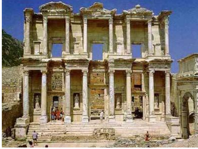
Resim 2.1: Efes antik kenti