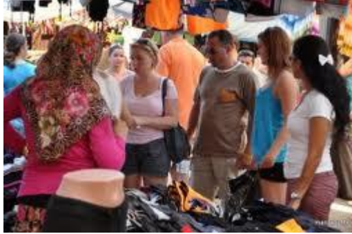
Resim 4.1: Turistik pazarlar

b. Ticari sömürü; turistleri rahatsız eden ve onları yerel halka yabancılaştıran nedenlerden biri onların her zaman olmasa bile çoğu kez ilişkiye girdikleri yerel halk tarafından sömürülme düşüncesi ve kaygıları taşımalarıdır. Kimi turistik işletmeler ve turizm görevlileri ve satıcılar, mallarını ve hizmetlerini turistlere çok aşırı fiyatlarla satmak için çalışırlar. Bu durum ise turistlerle yerel halk arasında olumlu ilişkilerin kurulmasını engellemektedir.