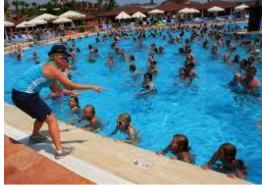
Resim 5.3: Havuzda aktiviteler

2. Alışveriş: Turistlerle görevliler arasında sık görülen bir ilişki biçimidir. Alışveriş ilişkisinde turistlerin ve görevlilerin kişisel özellikleri etkili olmaz. Bu ilişki bir hizmet çerçevesinde meydana geldiği için uzak, parçasal ve biçimseldir. Alışveriş ilişkisinde turist ve yerel halk ilişkisinin içerdiği kurallara uydukları sürece doyum duygusu elde ederler.