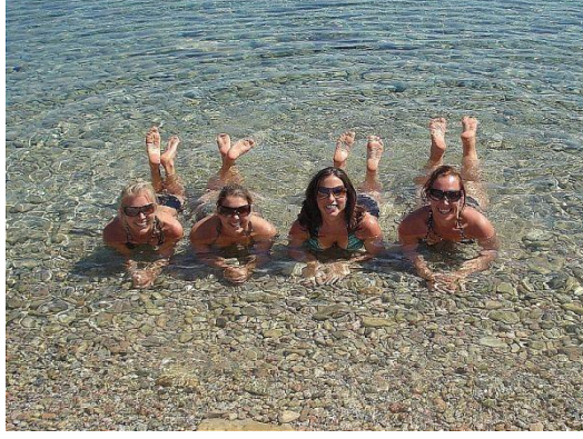
Resim 1.2: Turist davranışları