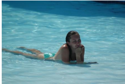
Resim 2.3: Turist

a. Düşlenen gezi evresi: Bu evrede, turist düşler kurar. Tatil insanlar için bir macera olayı olarak düşünülebilir. Tatili bir macera olarak gören insanın tatile çıkmadan önce kurduğu düşlerin kapsamı ve zenginliği de artar. Gezi genellikle ortam değiştirmenin heyecanını içeren bir düşler dizisinin başlamasıyla anlam bulur. Birçok insanın düşlenen evresindeki deneyimleri büyük ölçüde gezginlerin, ünlü sanatçıların ve yazarların yarattığı efsanelere, çeşitli dergi ve broşürlerde gördüklerine göre biçimlenebilir. Bu evrede, insan elde ettiği bilgilerin yanıltıcı bilgiler olmasına rağmen kurduğu düşler dolayısıyla, bu bilgileri doğru sanabilir.