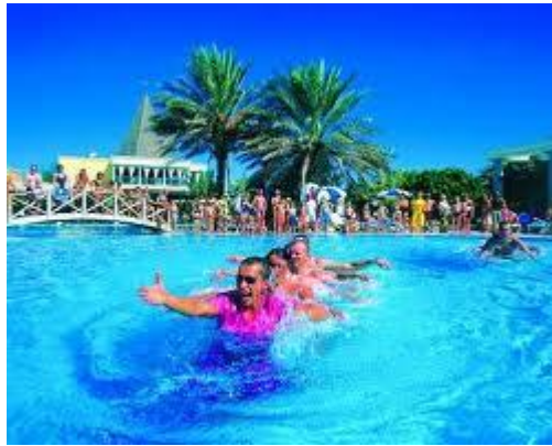
Resim 2.2: Havuzda eğlence

➤ Turistik deneyim, yeni deneyimleri aramayı içerir; gezi, insanın ufkunu genişleterek dar görüşlü olmasını azaltır. Diğer yandan turizm, yerel halkın ve turistlerin kültürel özelliklerinin karşılaştığı bir ortamı simgelemektedir. Turizm yeni deneyimler arama duygusunu simgelemektedir. Çünkü gezi; değişiklikleri, farklılıkları, ayrımlaşmaları görme, yaşama ve kutsama demektir. Turistler, yaşamı ve gerçeği olduğu gibi görmeye çalışır ve bu yönde davranışlar geliştirme eğilimindedirler.