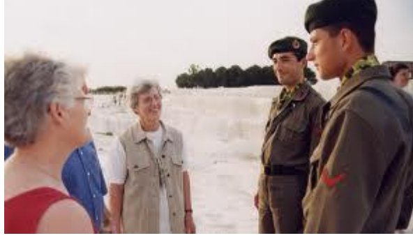
Resim 5.1: Turist-görevli ilişkisi

ölçüde turist ve görevlilerin ticari amaçlarına ulaşmalarına hizmet etmekte ve bu amaçları kolaylaştırmaktadır.