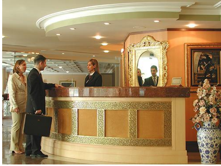
Resim 5.2: Turist-görevli ilişkisi