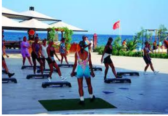
Resim 3.2: Etkinlik

küme ilişkileri davranışların özenilen insanlardan etkilenmesi biçiminde ortaya çıkan ilişkilerdir. İnsanlar içinde yer aldıkları durumları değerlendirirken, kendilerini özdeşleştirdikleri ve kendileri için bir seçenek oluşturan ilişkileri birer karşılaştırma çerçevesi olarak kullanırlar. Bir zengin gibi yaşamak isteyen bir yoksul için zenginler bir özdeşlik kümesidir.