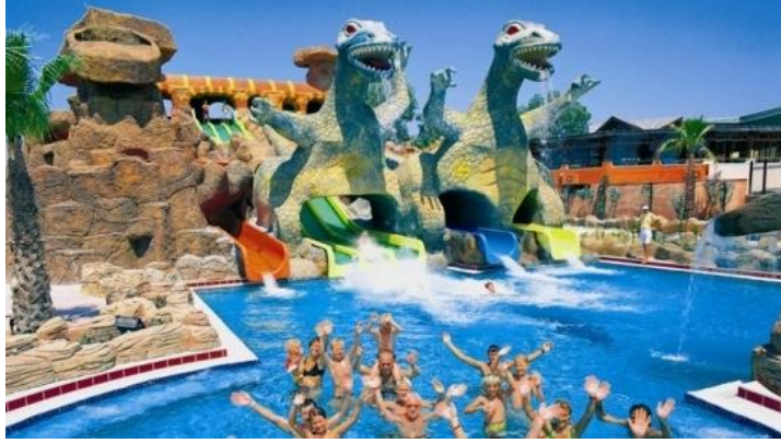
Resim 2.4: Havuzda eğlenen turistler

Yaşanan gezi evresinde, insan alışık olmadığı uyarıcıların etkisinde kalabilir. Eğer, turist kendi kültüründen oluşan sağlam bir kültüre sahip değilse, bu yeni uyarıcılara karşı çok duyarlı olabilir. Böylece turist, içinde bulunduğu ortamın birçok öğesini birbirinden ayıramayacaktır. Turistin geçmişten elde etmiş olduğu deneyimleri gelecekteki deneyimlerini biçimlendirmektedir. Turist, zaman geçtikçe genişleyen faaliyet alanını, geçmiş deneyimlerin ve simgelerin anımsanmasını ve karşılaşma öncesi düşüncelerini sürekli olarak denetim altında tutar. Üstelik bu durum turistin düşüncelerini değiştirmesine neden olabilir. Yaşanan gezi evresindeki gerçekler ile turistin daha önceden düşlediği gezi arasında büyük sapmalar varsa, turist geziden doyumсуzлuk duymaya başlar. Bu tür düş kırıklıklarının yaşanmaması için turistin geziye gerçekçi olarak hazırlanması gerekir.