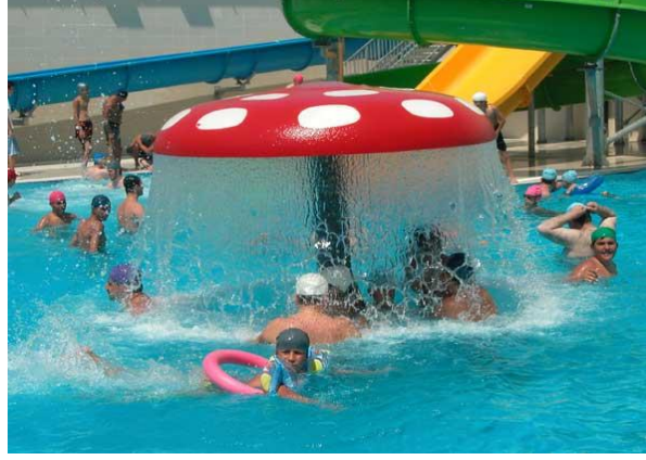
Resim 3.1: Birlikte vakit geçiren turistler