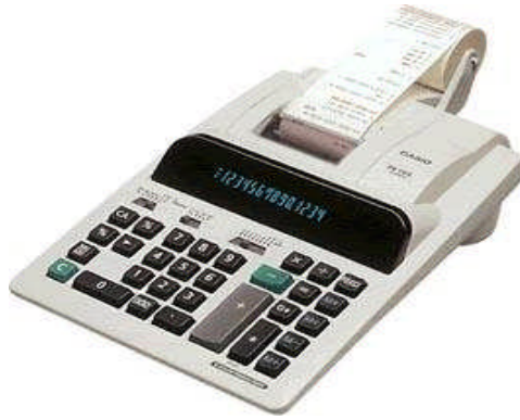
Resim 1.3: Şeritli hesap makinesi

Buradan da şu anlaşılıyor. Bu malın satışında maliyet üzerinden %28.57 oranında zarar edilirken, satış üzerinden %40 oranında zarar edilmiştir.