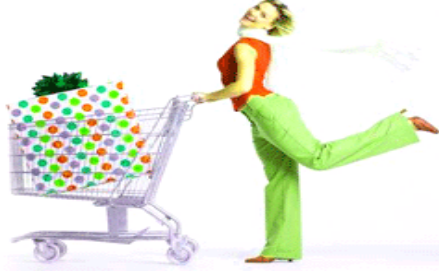
Resim 1.1: Fiyatların doğru belirlenmesi tüketicileri mutlu eder

Malların satışındaki kâr oranı belirlenirken, malın maliyet fiyatı veya satış fiyatı esas alınır. Hesaplamalar, maliyet üzerinden verilen orana göre ya da satış üzerinden verilen orana göre olmak üzere iki şekilde yapılacaktır.