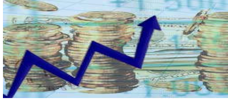
Şekil 1.1: Satışlarda maksimum kâr hedeflenir.