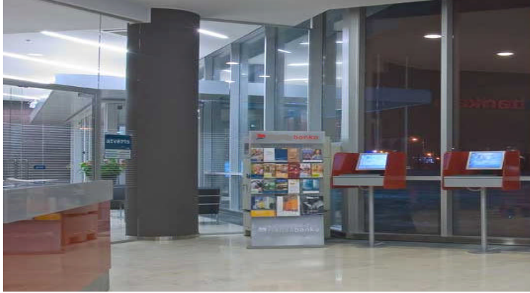
Resim 2.1: Bir banka girişi

Faiz tutarını hesaplanan yanında, vade, faiz oranı, anaparanın hesaplanması gerekebilir. Esas formülden hareket ederek bu değerleri hesaplayan formül bulunabilir.