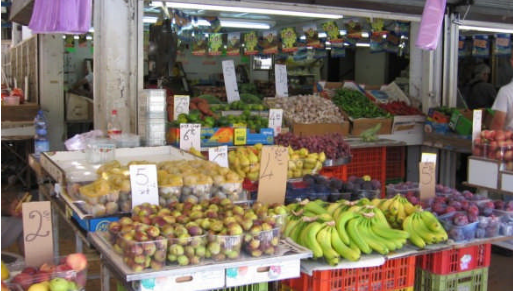
Resim 1.2: Pazarda satılan bazı mallar

Malların satışındaki kâr oranı belirlenirken, malın maliyet fiyatı veya satış fiyatı esas alınır. Hesaplamalar, maliyet üzerinden verilen orana göre ya da satış üzerinden verilen orana göre olmak üzere iki şekilde yapılacaktır.