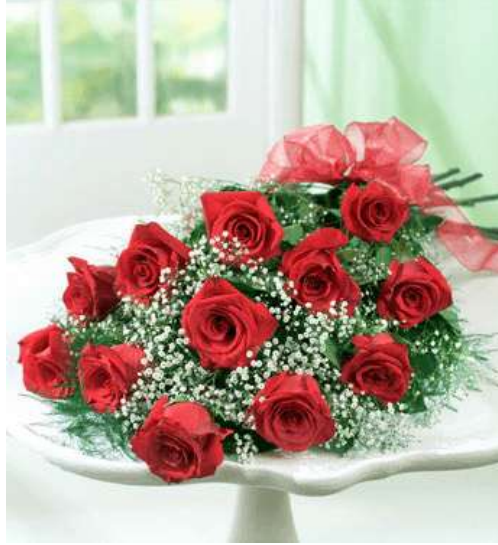
Fotoğraf 1.10: Cipsosilya ve kırmızı tül kurdele ile zenginleştirilmiş tek yönlü buket

Tek yönlü bir buket az sayıda çiçekten tasarlanabileceği gibi çok sayıda çiçekten de tasarlanabilir. Sayı konusunda tasarımda şuna dikkat çekilebilir. Nasıl ki çiçeklerin renklerinin anlamı var ise; sayılarının da anlam teşkil ettiği söylenmektedir. Örneğin tekli sayıdan güllerden tasarlanmış bir tek yönlü buket “sen dünyada teksin” anlamına gelmektedir. Birçok sayıda çiçekten oluşmuş bir tek yönlü buket de bolluğu ve bereketi simgeleyebilir.