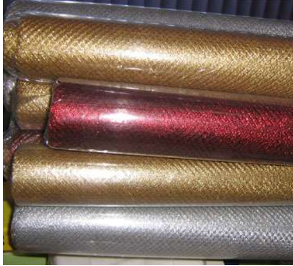
Fotođraf 2.6: Simli parlak dokuma tergal eni 70 cm uzunluđu 10 metre

Tergalin çiçeklere uygun renkte olmasına dikkat edilir. Seçilen tergalin üzerine çiçeklerin diplerini gizleme amacıyla elyaf kesilir. Elyaf, tergal gibi içini süzmez kumaşa benzer bir malzemedir.