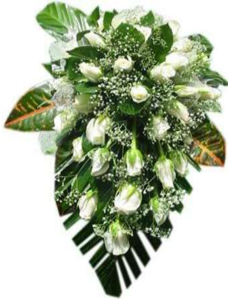
Fotoğraf 2.9: İşçiliğin muhteşem bir biçimde sergilendiği bir tek yönlü buket

Tek yönlü buket hazırlamada arka fon olarak çeşitli yeşillikler (devetabanı, palmiye yaprağı vb.) de kullanılabilir. Arka fonu çeşitli yeşilliklerle hazırlanmış bir tek yönlü buket çok daha doğal ve zarif durur.