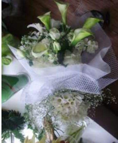
Fotoğraf 1.7: Beyazın masumiyetinin ve saflığının yansıtıldığı tek yönlü buket

Müşterinin isteği doğrultusunda tek yönlü buketi tasarlamak gerekir. Ancak estetik ve muhteşem görünümlü bir tek yönlü buket tasarlamak için müşteriye çeşitli tavsiyelerde bulunulabilir. Böylece güzel bir buket tasarlamak için fırsat yaratmış oluruz.