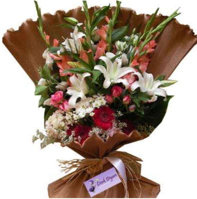
Fotoğraf 1.2: Mevsim çiçeklerinden krep üzerinde hazırlanmış gösterişli tek yönlü buket

Çiçeklerin kullanılmasıyla birçok hoş görünümlü demetler oluşturulabilir. Çiçekler değişik şekilde kullanılarak buketler de hazırlanabilir. Buketler genellikle elde taşınabilir biçimdedir. Buketler farklı şekilde düzenlenebilir; yuvarlak buket, tek yönlü buket, serbest buket çeşitleri vardır. Tek yönlü buketin hazırlanması diğer buketlerin hazırlanma şekline göre daha kolaydır.