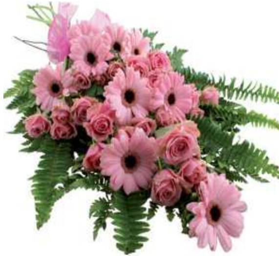
Fotoğraf 1.1: Güller ve gerberalardan hazırlanmış tek yönlü model buket

İnsanların birbirine olan duygularını ifade etmelerinin en estetik yollarından biri doğadan geçmektedir. Bunu da birilerine çiçek vererek gerçekleştirirler.