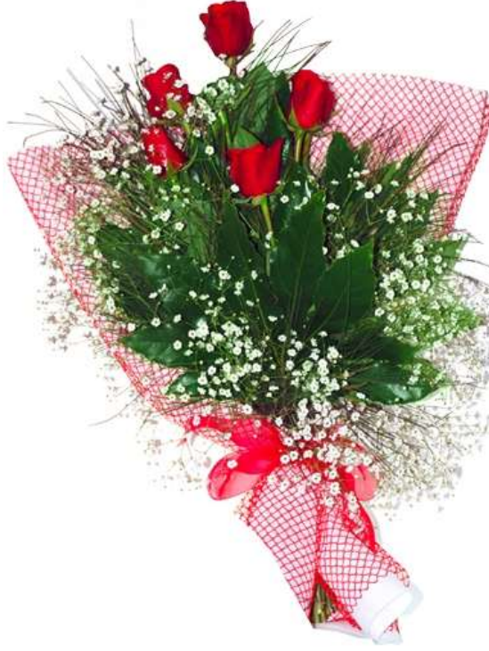
Fotoğraf 1.8: Aşk ve sevgiyi ifade için kırmızı güllerden hazırlanmış tek yönlü buket

Çiçek düzenleyicisi tasarımı yapmadan önce müşteriden buketin hangi amaç için kullanılacağı hakkında bilgiler alabilir. Böylece amaca uygun doğru renkler kullanılır. Ayrıca biliniyorsa alıcıyı mutlu edecek renklerin kullanılması; mesela en sevdiği renk ve tonlardan bir buket tasarlanması çok doğru bir seçim olur. Bu aşamada her çiçek renginin bir anlam ifade ettiği unutulmamalıdır. Örneğin; beyaz renk masumiyet ve saflığı ifade ederken, kırmızı renk aşk ve sevgiyi ifade eder.