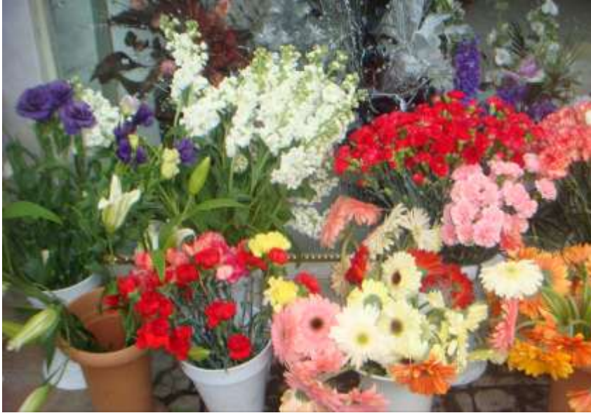
Fotoğraf 2.1: Tek yönlü buket hazırlamada kullanılan bazı çiçekler

Tek yönlü buket hazırlamada çiçekler buketimizin ana materyalini oluşturur. Taze, doğal çiçekler kullanılabileceği gibi yapma çiçekler de kullanılabilir. Ama doğal görümlü estetik açıdan mükemmel kusursuz bir buket hazırlanmak isteniyorsa tercih her zaman canlı çiçeklerden olmalıdır. Tek yönlü buket hazırlamada önemli aşamalardan biri de çiçek seçimidir.