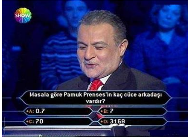
Resim 2.2: Yarışma Programı

Programa katılacak; merak ögesini kışkırtıp, kontrollü gerginlik oluşturma yöntemleri kullanmak da programın izlenme oranını artırır.