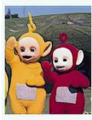
Resim 6.1: Çocuk Programı

Bu program türünün hedef kitlesi çocuklardır. Bu bakımdan, çok fazla özen ve dikkatle çalışmak gerekir. Çocuk programları, çocukların düşünsel gelişimine katkı sağlamak amacıyla yönelik hazırlanır.