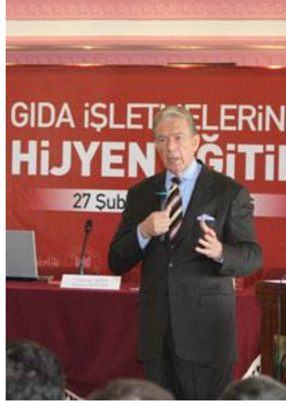
Resim 4.3: Haber Programı

Haber yapılırken yararlanılacak çok çeşitli kaynaklar vardır. Olayla ilgisi bulunan kişi, kurum ve kuruluşlar birinci derecede başvurulacak kaynaklardır. Olay yakın geçmişte olmuşsa her şeyden önce olayın görgü tanıkları en önemli kaynaktır. Olayın geçtiği yerde yapılacak inceleme ve araştırmalar, olayla doğrudan ya da dolaylı ilişkisi bulunan kişilerle yapılacak röportajlar, konuya önemli ölçüde ışık tutacaktır.