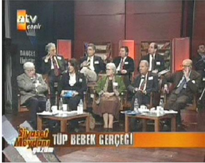
Resim 1.1: Açık Oturum Programı

Açık oturum programı yapacak yönetmen, stüdyo plânı üzerinde çalışarak, konukların yerleşimine, kamera konumlarına karar vermelidir.