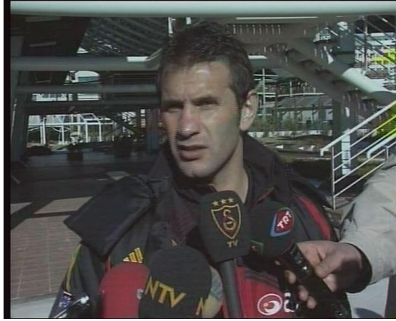
Resim 4.2: Spor Programı

Spor programlarının sunulduđu stüdyolarda dekor, yalın olmalıdır. Canlı telefon bağlantıları veya görüntülü naklen bağlantılarla sunum yapılmalıdır. Spor konusunda tartışma programı yapılıyorsa konunun uzmanları çağrılmalı, yayın sırasında bant kayıtları ile konu, izleyicinin dikkatine sunulmalıdır.