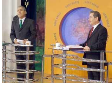
Resim 1.2: Söyleşi Programı

Aşağıda bir program sunucusuna, açılış anonsu ve konuğuna soracağı sorularla ilgili bir metin hazırlanmıştır. Bu metni bazı durumlarda sunucu, bazı durumlarda yapımcı, bazı durumlarda da eğer varsa danışman-metin yazarı hazırlar. Sunucu bu metinleri, zaman zaman elindeki kâğıttan, zaman zaman prompter denen cihazdan okuyarak sorar. Bu metinlere, sunucu destek metinleri de diyoruz.