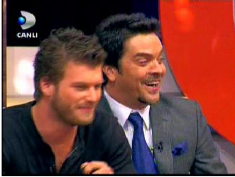
Resim 2.1: Eğlence Programı

Eğlence programı yapımcısı, programını ister müzik ağırlıklı, ister komedi ağırlıklı olacak şekilde tasarlasın, programın ana karakter(ler)i ya da teması aracılığıyla birliği sağlamak zorundadır. Bu tür programlarda çeşitlilik ise programa katılacak konuklar sayesinde sağlanabilir.