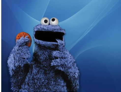
Resim 6.2: Çocuk Programı

Yapımcının çocuk programlarındaki temel görevi, tasarlanan ve iyi düzenlenmiş çalışmaları, çocukların imge dünyasına yerleştirebilmeyi başarmaktır. Bunu sağlamak için çocukların anlama ve kavrama düzeyi göz önünde bulunmalı ve konuyla ilgili uzmanların da düşünceleri alınarak çalışmada ve yapım aşamasında, yaratıcılığın tüm sınırları zorlanmalıdır. Programın içeriğinde, çocukların sorumluluk sahibi, olgun ve mutlu birey olarak gelişmesi için gerekli mesajlar verilmelidir.