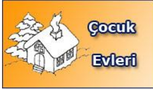
Resim 1.5: Çocuk evleri 6–8 yaş grubu çocuklara hizmet veren kuruluşlar

6–8 yaş grubu çocukların barınıp yaşamlarını sürdürebileceği, kendini güvenli, gelecekte mutlu hissedebilecekleri ortamlardır. Çocuk evleri, çocukları hayata hazırlamaktadır. Onları arkadaşlık, komşuluk ilişkileri gibi kavramları doyusıya yaşayıp öğrenebilecekleri, ayakları üzerinde sağlam basabilecekleri bir şekilde yetiştirmek amacıyla oluşturulan yeni bir bakım modelidir.