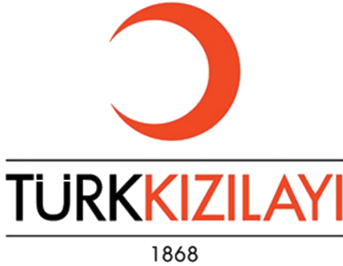
Resim 1.13: Tüzel kişiliğe sahip özel hukuk hükümlerine tabi, kâr amacı gütmeyen sosyal hizmet kuruluşu Kızılay

Kızılay, Uluslararası Kızılay-Kızılhaç Topluluğu'nun temel ilkelerini paylaşır. Kızılay, tüzel kişiliğe sahip özel hukuk hükümlerine tabi, kâr amacı gütmeyen, yardım ve hizmetleri karşılıksız olan ve kamu yararına çalışan bir gönüllü sosyal hizmet kuruluşudur.