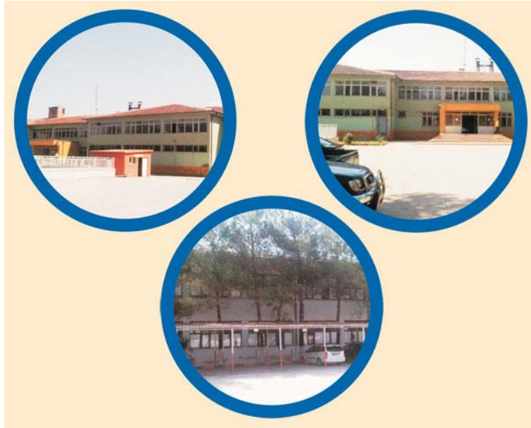
Resim 1.9: Toplum merkezlerinde verilen hizmetler aracılığıyla yöre halkının bilgi ve bilinç düzeyinin artırılmasının amaçlanması

Toplum merkezleri, 2828 sayılı Sosyal Hizmetler ve Çocuk Esirgeme Kurumu Kanunu'nun hükümlerine dayanılarak düzenlenen "Sosyal Hizmetler ve Çocuk Esirgeme Kurumuna Bağlı Toplum Merkezleri Yönetmeliği", 11.07.2000 tarih ve 24106 sayılı Resmî Gazete'de yayımlanarak yürürlüğe girmiştir. Toplum merkezi; öncelikle yoğun göç alan bölgelerde, gecekondü bölgelerinde ve kalkınmada öncelikli bölgelerde hizmete açılır.