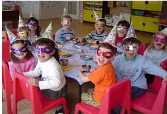
Resim 1.4: Çocuk yuvaları, 0–12 yaş arası korunmaya muhtaç çocuklara hizmet veren kuruluşlar

Çocukların okul başarılarının yükseltilmesi, olumlu sosyal ilişkiler kurmaları, hayata hazırlanmaları için kuruluşlarda kültürel, sanatsal, sportif, sosyal etkinlikler yapılmakta; yaz tatillerini iyi bir şekilde değerlendirmeleri için anne ve babasının yanına çeşitli nedenlerle gönderilemeyen çocuklar için kamp programları düzenlenmektedir.