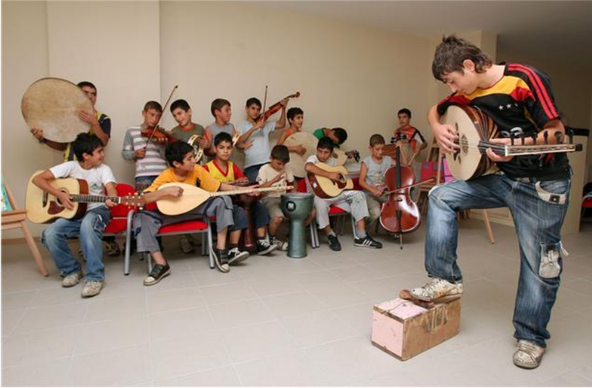
Resim 1.6: Çocuk ve gençlik merkezlerinde çocuk ve gençlere yönelik sanatsal faaliyetlerin yürütülmesi

Çocuk ve gençlik merkezlerinin açılış ve işleyiş esaslarını belirleyen “Çocuk ve Gençlik Merkezleri Yönetmeliği” Eylül 2001 tarih ve 24539 sayılı Resmî Gazete’de yayımlanarak yürürlüğe girmiştir. Söz konusu Yönetmeliğe ilişkin olarak hizmetin etkinliğini ve standartlığını sağlamak amacıyla hazırlanan Çocuk ve Gençlik Merkezleri Yönergesi Bakanlık Makamının 30 Ekim 2002 tarih ve 191 sayılı Onayı ile yürürlüğe girmiştir.