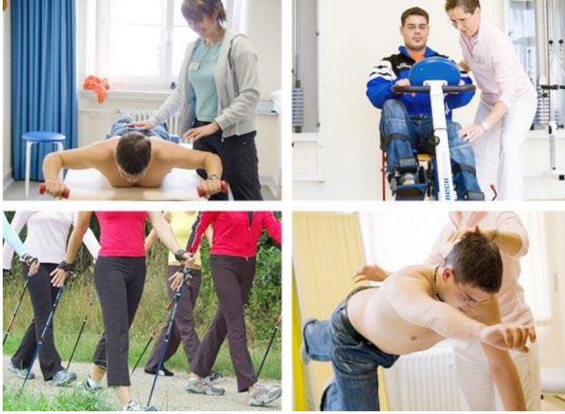
Resim 1.8: Rehabilitasyon merkezlerinde fizik tedavi uzmanı, fizyoterapist, psikolog ve sosyal hizmet uzmanı vb. kişilerin yer alması

Rehabilitasyon merkezlerinde verilen hizmetler: