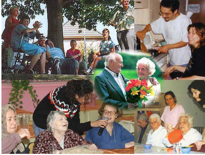
Resim 1.7: Yaşlı kişileri huzurlu bir ortamda korumak, bakmak, onların sosyal ve psikolojik ihtiyaçlarını karşılamak amacıyla hizmet veren kuruluşlar huzurevleri

İlgili yasanın öngördüğü esaslar doğrultusunda yaşlıya yönelik var olan hizmetlerin iyileştirilmesi ve yeni hizmetlerin başlatılması çalışmaları aşağıda belirtilen Yönetmelikler çerçevesinde yürütülmektedir. SHÇEK Huzurevleri ile Huzurevi Yaşlı Bakım ve Rehabilitasyon Merkezi Yönetmeliği, Özel Huzurevleri ve Yaşlı Bakımevleri Yönetmeliği, Kamu Kurum ve Kuruluşları Bünyesinde Açılacak Huzurevlerinin Kuruluş ve İşleyiş Esasları Hakkında Yönetmelik, Yaşlı Hizmet Merkezlerinde Sunulacak Gündüzlü Bakım ile Evde Bakım Hizmetleri Hakkında Yönetmelik'tir.