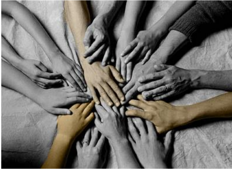
Resim 1.1: İnsanların ortak değerlerde birleşerek hareket edebilmesi için sosyal dayanışmanın önemi

Sosyal dayanışma, sosyal güvenlik sistemi aracılığıyla sağlanan sosyal korumanın en temel unsurudur. Yaşlılık, engellilik, hastalık, doğum, ölüm, işsizlik gibi risklerle karşılaşan insanların yaşam düzeylerini korumak ve geliştirmek için oluşan bir sistemdir. Sosyal dayanışma, bireylerin eşitliğine dayanan, hak ve sorumluluklara sahip oldukları bir yeniden dağıtım ilişkisidir. Bu değerlerden birinin eksikliği, sosyal dayanışmayı ve dolayısıyla korumanın sosyal niteliğini ortadan kaldırır.