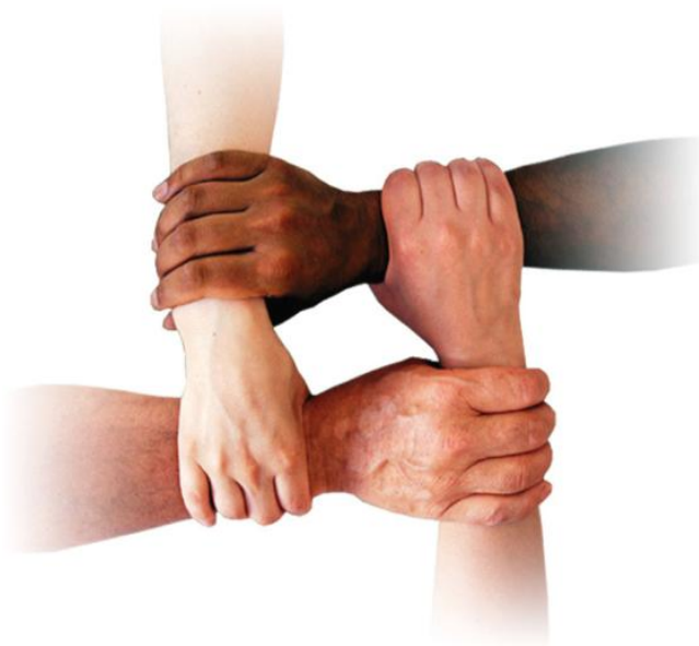
Resim 1.2: Sosyal dayanışma bireylerin psikolojik, sosyal ve ekonomik ihtiyaçlarından kaynaklanan gereklilik

Birlik beraberlik ve dayanışmanın gücünü gösteren tarihteki en güzel örnek Kurtuluş Savaşı'dır. Millî mücadele, tüm imkânsızlıklara rağmen insanların birbirine güven ve saygı duymaları, ortak değerlerin etrafında birleşmeleri sonucunda kazanılmış bir zaferdir.