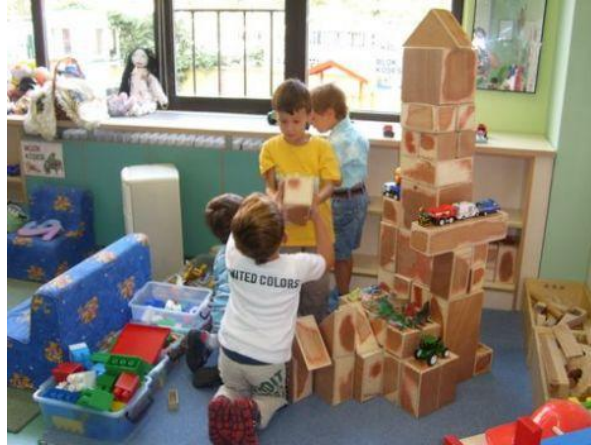
Resim 1.3: Kreş ve gündüz bakımevlerinde çocukların gelişim alanlarını destekleyici eğitimlerin verilmesi