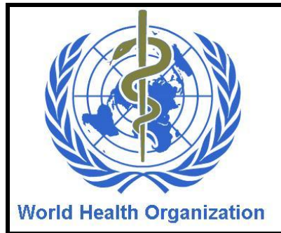
Resim 2.1: Dünya Sağlık Örgütü (WHO)'nün sağlık alanındaki araştırmaları teşvik etmesi

Birleşmiş Milletlere bağlı olan ve uluslararası sağlık alanında çalışmalar yapan bir kuruluştur. 19-22 Temmuz 1946 tarihlerinde Newyork'ta düzenlenen uluslararası Sağlık Konferansında BM'ye üye 51 ülkenin temsilcileri ile FAO (Gıda ve Tarım Örgütü), ILO (Uluslararası Çalışma Örgütü), UNESCO (Birleşmiş Milletler Eğitim, Bilim ve Kültür Kurumu), OIHP (Uluslararası Halk Sağlığı Bürosu), PAHO (Pan Amerikan Sağlık Örgütü), Kızılhaç vb. temsilcileri ile Dünya Sağlık Örgütü Anayasası oluşturulmuştur.