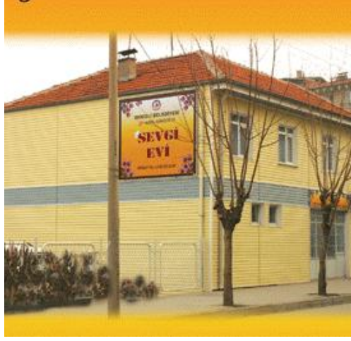
Resim 1.11: Sevgi evleri kuruluş bakımı yerine daha küçük birimlerde, aile ortamına benzer yapılar