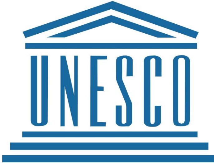
Resim 2.2: Birleşmiş Milletler'in bir özel kurumu olarak İkinci Dünya Savaşı'ndan sonra 1946 yılında kurulan UNESCO

“Birleşmiş Milletler” eğitim, bilim ve kültür kurumu olarak tanımlanmaktadır. UNESCO, Birleşmiş Milletler'in bir özel kurumu olarak İkinci Dünya Savaşı'ndan sonra, 1946 yılında kurulmuştur. Bu kurumun Yasası, 1945 yılı Kasım ayında Londra'da 44 ülkenin temsilcilerinin katıldıkları bir toplantıda kabul edilmiştir. Türkiye, bu Yasa'yı imzalayan ilk yirmi devlet arasında onuncudur.