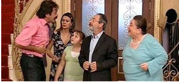
Resim 3.3: Televizyon dizileri ve kahramanları sevimli, sempatik ve içimizden biri olmalıdır. Çünkü sık sık evimize konuk olmaktadır.

Özellikle sitcom tarzı diziler başta olmak üzere tüm dizilerde çekim mekânları mümkün olduğu kadar az olmalı, tüm dizi çekimleri bir kaç mekânda gerçekleştirilmelidir.