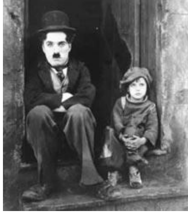
Resim 1.2: Sessiz sinema döneminin unutulmaz kahramanı Şarlo ‘yumurcak’ filminin bir sahnesinde

Filmde diyalog ve diğer ses unsurlarının olmaması, anlaşılır olmak adına hem senaristin, hem de oyuncunun işini zorlaştırıyor; abartılı oyunculuk ve sahnelerin çekimine zemin hazırlıyordu. Ancak ilginçtir ki, sesli film çekimlerinin başlamasıyla da bazı sanatçılar gerçek sesleriyle izleyiciye hitap edince şöhretlerini yitirmişlerdir.