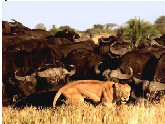
Resim 3.2: Vahşi doğa belgeselleri türlerinin en beğenilen örnekleridir.

Belgesel sinemada senaryo yazımına, film için yapılacak ön araştırma tamamlandıktan sonra geçilmelidir. Bazı belgeselciler, özellikle gözleme dayalı belgesel yapanlar genellikle senaryosuz çalışmaktadırlar. Günümüz belgesellerinin bazıları başından sonuna kadar tek bir konuşma, anlatım ve yazılı bir senaryo olmaksızın çekilmektedir. Çünkü dış dünyada olanlar, bir senaryo yazarının kapalı bir mekânda yazacaklarından çok daha ilginç, daha heyecanlı, daha büyüleyicidir. Bütün bunlara rağmen belgesel çekiminden önce veya sonra bir senaryo beraberinde çalışmanın pek çok yararı bulunmaktadır. Burada akla gelen soru şudur; belgesel için ne yazılacaktır?