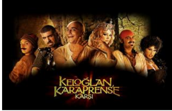
Resim 3.1: Halk edebiyatı eserleri sinema sektörü için her dönem önemli bir senaryo kaynağı olmuştur.