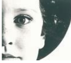
Fotoğraf 1.11