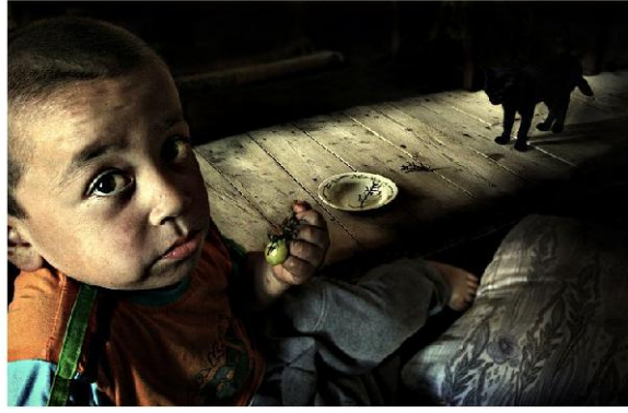
Fotoğraf 2.1: Sanat fotoğrafı örnekleri

Fotoğrafın önemli objelerinden biri, siyah bir kedir. Fotoğrafta dikkati çeken ilk şey çocuk olmasına rağmen kediye doğru giden doğrusal bir yol mevcut: çocuk, çocuğun elindeki üzüm çöpü, tabağın içindeki üzüm çöpü, kedinin önündeki üzüm çöpü, kedi.