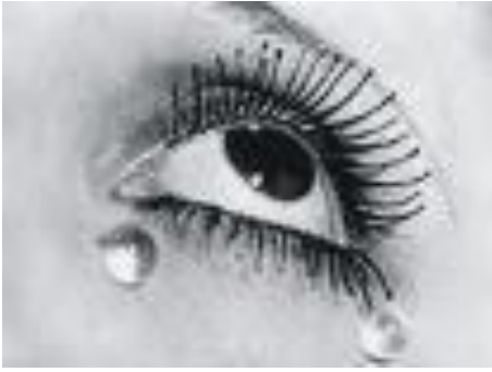
Fotoğraf 1.5: Sanat fotoğrafı örneği

Fransızca “expression (ifade)”dan türetilmiş bir sözcüktür. “İfadecilik” anlamına gelir. Naturalizm, Akademiizm ve Empresyonizm’e bir tepki olarak resim, grafik ve heykel alanlarında ortaya çıkmış bir sanat görüşüdür. Ekspresyonizm (Dışavurumculuk ya da Anlatımcılık); güçlü duyguların, çizgilerin veya renklerin abartılı ve çarpıtılmış biçimde kullanılması yoluyla anlatıldığı bir sanat yöntemi olarak tanımlanabilir.