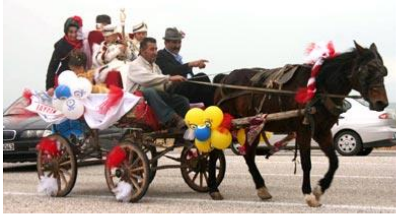
Fotoğraf 1.3: Nazar boncuğu desenli balonlarla süslenmiş sünnet aracı olarak kullanılan at arabası

Günümüzde en çok kullanılan sünnet aracı otomobillerdir. Üstü açık arabalar gezdirmelerde tercih edilmektedir. Çünkü sünnet kıyafetleri giydirilmiş çocuğun eline asasını alıp ayakta durarak veya oturtularak gezdirilmesi bir gelenek halini almıştır.