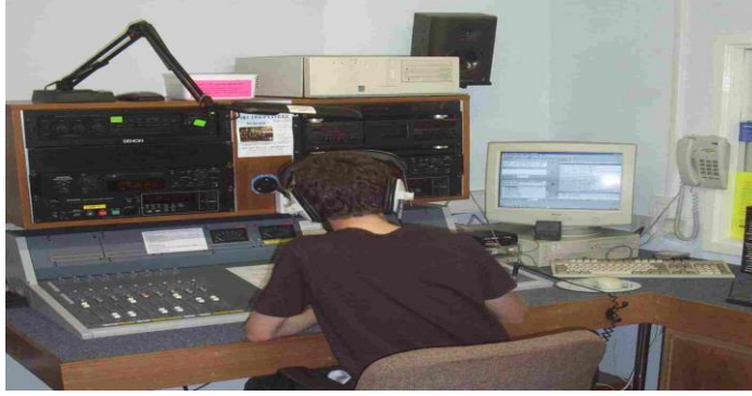
Resim 1.3: Radyo stüdyosunda bir kültür programı sunumu