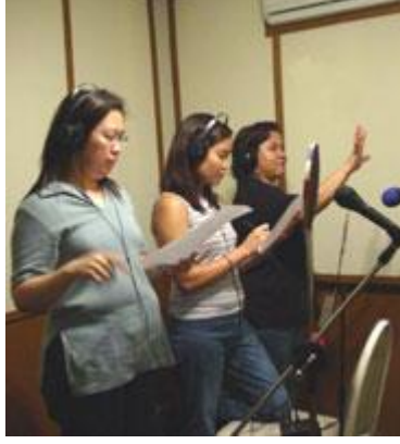
Resim 1.4: Drama program çalışması

Özgün radyo oyunları ile Türk ve dünya edebiyatının seçkin eserlerinden yapılabilecek uyarlamalar radyoculuğun sanatsal işlevini yerine getirmesini sağlar.