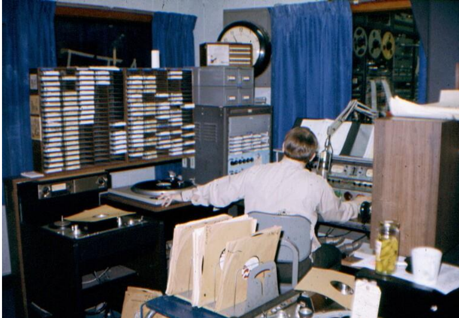
Resim 2.2: Bölgesel radyo istasyonu

Bölge radyoları buldukları kent ile yakın ilişki içinde olduğundan yayınlarındaki öncelik, doğal olarak o kente özgü olmaktadır. Yerel radyolar bir şehir veya ilçeye dönükken; bölgesel radyolar bir merkez il ve etrafını hedef kitle olarak seçer ve bu bölgenin insanının dikkatini çekecek haber ve programlar üretir.