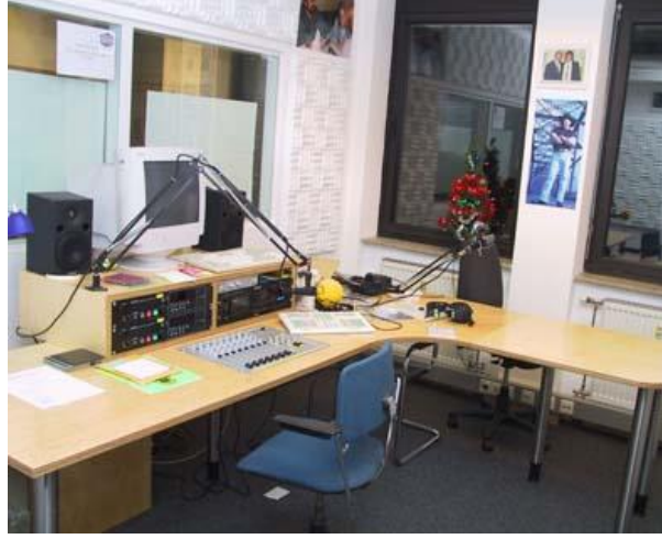
Resim 2.3: Ulusal radyo istasyonu

Şunu belirtmekte de fayda vardır ki başlangıçta müzik ağırlıklı olarak ortaya çıkan bu özel radyolar zaman içerisinde kendilerine bir yayın formatı ve kimliği oluşturmaya başladı. Böylece hedef kitleleri daha da belirginleşmeye başladı. Bu radyolar, söz ve müzik ağırlıklı olmak üzere iki ayrı formatta yayın yapmaktadır. Söz ağırlıklı olanlar ise haber ve kültür programları ağırlıklı sınırlı sayıda radyo kanallarıdır.