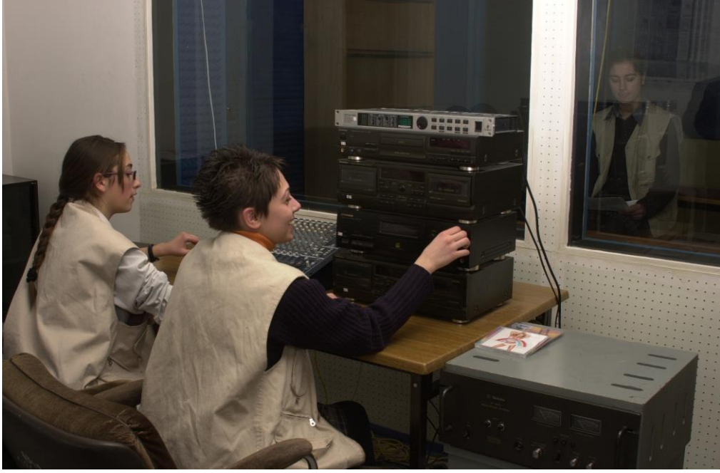
Resim 1.2: Radyo stüdyosunda program hazırlayan öğrenciler