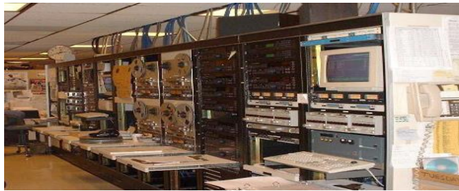
Resim 2.4: Uluslararası radyo istasyonu

TRT radyoları, karasal vericilerle yayın yapmalarının yanında TÜRKSAT 1C uydusundan da yayın yapmaktadır. Ayrıca, Diyarbakır GAP ile Turizm Radyoları da uydu yolu ile de yayınlara vermektedirler. Yayınların tümü internet üzerinden de yayınlanmaktadır.