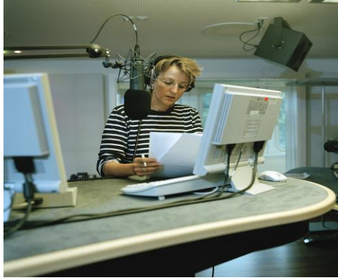
Resim 1.5: Haber program sunumu

Haberin seçimi kadar sunumu da önemlidir. Sunucunun ses tonunu iyi ayarlaması, konuşma dilini kusursuz kullanması gerekir. Ayrıca vurguyu da yerinde yapabilmelidir.