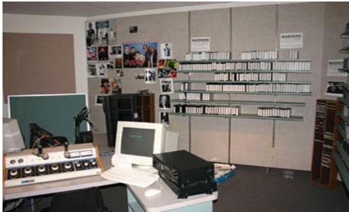
Resim 2.1: Yerel radyo stüdyosu

Turizm radyolarının yapım merkezi Antalya Lara'dadır. Programlar burada hazırlanmakta ve FM bandından stereo olarak verilmektedir.