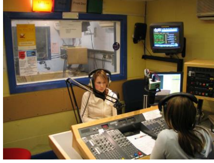
Resim 3.2: Radyo stüdyosunda röportaj sunumu.