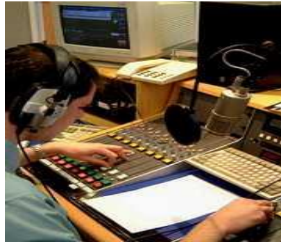
Resim 1.6: Spor programı sunumu