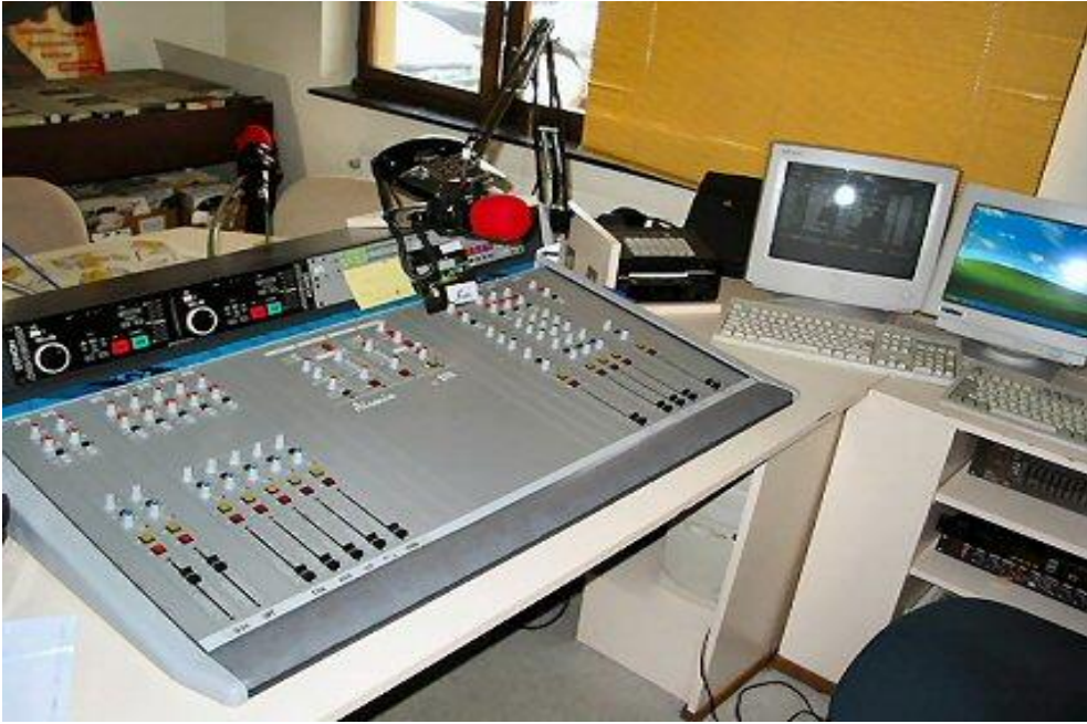
Resim 1.1: Radyo stüdyosu

Eđitim programlarında dikkat edilecek nokta, bu tür programların düzgün konuşan, izleyicinin güvendiğı, inandığı ve otorite olarak kabul edilen kişiler tarafından sunulmasına özen gösterilmesidir.