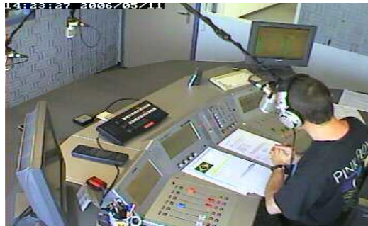
Resim 1.7: Radyo stüdyosunda reklam metni sunumu