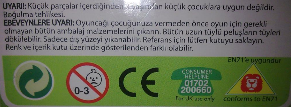
Resim 2.2: Oyuncak üzerinde bulunması gerekli güvenlik uyarıları