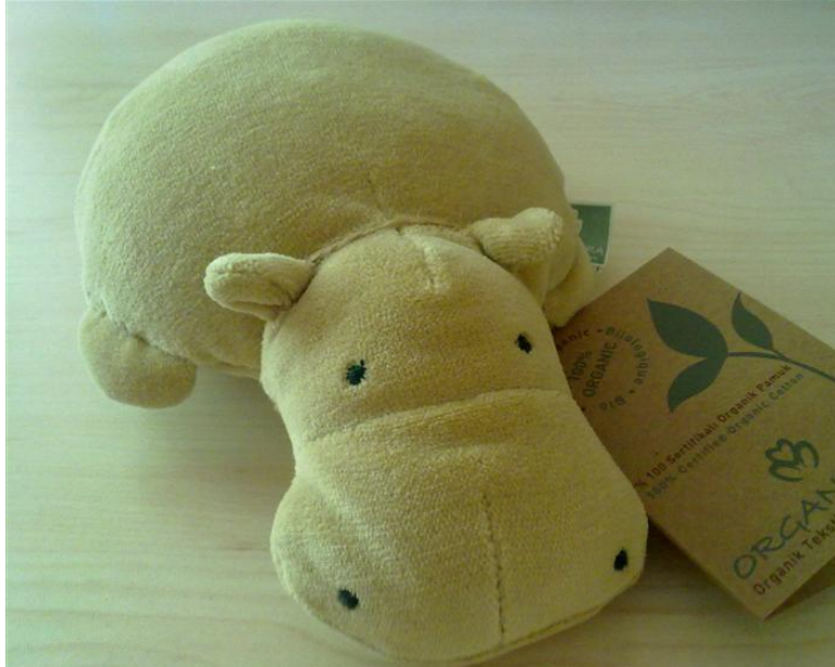
Resim 1.3: Organik oyuncak üretim sertifikalı organik oyuncak

Organik oyuncak üretimi için üretim planlaması yapılırken yasal yükümlülükler yönetmelikler gereği takip edilmeli ve uygulama süreci buna göre başlatılmalıdır.