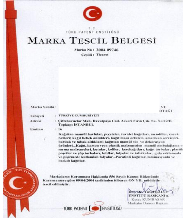
Resim 1.2: Marka patent belge örneği