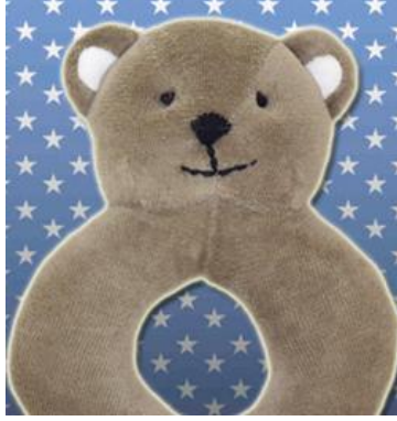
Resim 1.14.: Organik Oyuncak Örnekleri