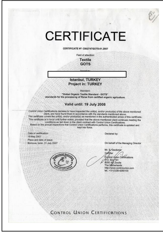
Resim 1.6: GOTS sertifika örneği

Organik ürün alan firma ürünün organik elyaftan organik olarak üretildiğinden emin olmakla yükümlüdür. Bu nedenle denetimin ve sertifikasyonun kanıtı olarak satıcıdan/ihracatçıdan;