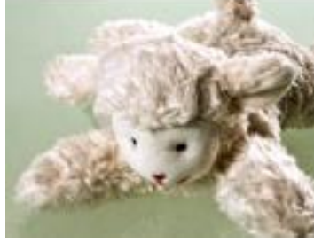
Resim 1.4.: Kuzu organik oyuncak