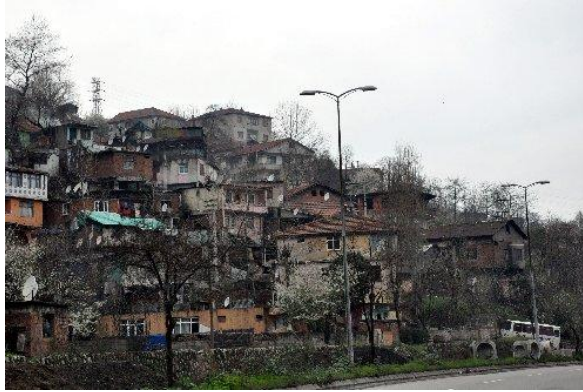
Resim 2.5: Göçün yarattığı çevre sorunlarından gecekondulaşma

Göçle beraber konut, sağlık, eğitim, sosyal hizmetler ve altyapı hizmetlerinde gözle görülür bir açık ortaya çıkmaktadır. Şehre yeni yerleşen halk kesimi birçok alanda hizmetlerin kendilerine ulaşmasını beklemekte ve hizmetlerin karşılanmaması/karşılanamaması durumunda ise acil ihtiyaçlarını kendi yöntemleriyle gidermeye çalışmaktadır. Marjinal hizmetlerdeki yığılmalar, erken saatlerde köşe başlarında oluşan işçi pazarları, trafik, park yeri, içme suyu, elektrik, otobüs sıkıntıları, kanalizasyon yetersizliği, okul, kitaplık, yeşil alan eksikliği toplumsal erozyonun büyük kentlerdeki belirtileridir.