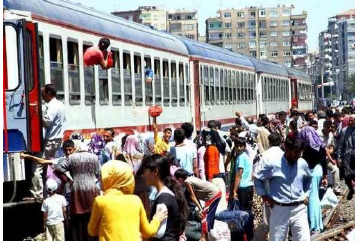
Resim 2.3: Dış göçler