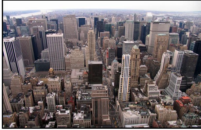
Resim 1.5: Demografik, ekonomik ve sosyokültürel olarak kentleşme