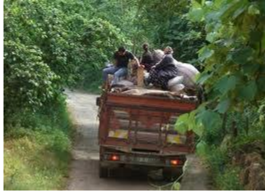
Resim 2.1: Kırsal yerleşmelerdeki nüfusun şehirlere göç etmesi

Türkiye’de 1950 yılından sonra kentlerde gelişen teknoloji ve sanayileşme hareketleri, şehirlerde iş gücü eksikliğine neden olurken kırsal yerleşmelerdeki hızlı nüfus artışı ve tarımda makineleşme kırsal alanlarda iş gücü fazlalığına yol açmıştır. Aynı zamanda kır ile şehir arasındaki ulaşım ve haberleşme sistemlerindeki gelişmeler, siyasi kararlar ve şehirlerdeki diğer çekici faktörler kırsal yerleşmelerdeki nüfusun şehirlere göç etmesinde etkili olmuştur.