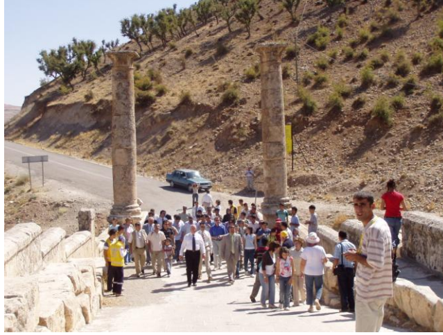
Resim 3.2: Turistik gezi

Turistik gezi, insanların sadece bir yerden bir yere gitmesi değil kültürel, ekonomik ve toplumsal olarak da iletişim içinde olmasıdır. Turizm sayesinde insanlar, hem diğer ülkelerin hem kendi ülkelerinde yaşadıkları bölgenin dışındaki güzelliklerin, geçmişte yaşamış olan insanların bırakmış oldukları kültürel mirasın farkına vararak gelecek kuşaklara daha yaşanılabilir bir dünya bırakmanın gerekliliğine inanarak hayata farklı açılardan bakabilirler.