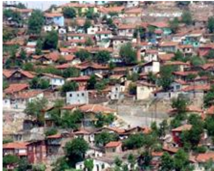
Resim 1.7: Kaçak yapılaşma

Çevre sorunlarını en şiddetli biçimde yaşayan kesim, kuşkusuz nüfus yoğunluğunun barındığı ve sanayi kuruluşları bakımından zengin kentlerin insanlarıdır. Ülkemizde genel olarak artan nüfusun yanında kırsal alanlardan kentlere doğru olan nüfus göçü, belirgin bir biçimde sürmektedir. Öte yandan son yıllarda hızlanan toplu konut inşaatları, yeni yerleşim yerlerinin açılmasına yol açmaktadır. Böylelikle kentler hızla genişlemekte ve bir yandan gecekondular mahalleleri, diğer yandan büyük ve çok katlı yapılar, geniş yollar ve sanayi kuruluşlarıyla belirgin bir değişime uğramaktadır.