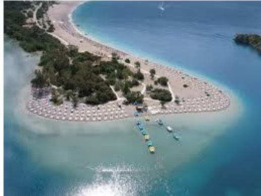
Resim 3.3: Deniz turizmi

Ülkemiz doğal güzellikleri, tarihsel, sanatsal, arkeolojik, kültürel ve folklorik değerleri açısından ilgi çekici turistik özelliklere sahiptir. Edirne, İzmir, Ankara, Muğla, Bursa, İstanbul, Antalya gibi büyük kentler hem doğal hem tarihi hem de sanatsal açıdan önemli noktalara ev sahipliği yapmaktadır.