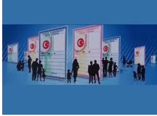
Resim 1.1: Nüfus dağılımı

Nüfus, herhangi bir sayım gününde sınırları belirli bir alanda yaşayan insanların toplam sayısıdır. Bu alan; ülke, bölge, il, ilçe, köy veya daha geniş bir mekân olabilir. Coğrafyacılar, yalnızca nüfusla ilgili sosyal verileri yorumlamakla kalmamış, bunlarla mekân arasındaki ilişkileri de inceleyerek nüfus coğrafyasının doğmasını sağlamışlardır.