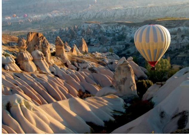
Resim 3.4: Kapadokya

Jeolojik yapısı ile de diğer turizm özelliklerinden geri kalmayan ülkemizde Pamukkale travertenleri, Peri bacaları, Ihlara ve Göreme vadileri, Damlataş, Cennet-Cehennem, Balıca ve Karain Mağaraları dikkat çekmektedir.