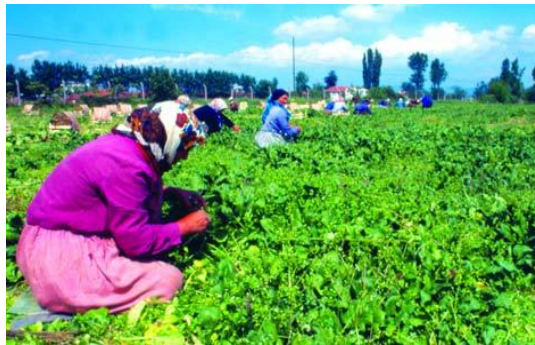
Resim 1.4: Tarımsal faaliyetler