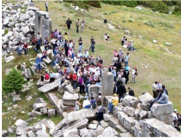
Resim 3.6: Turizmde kültürel mirasın korunması

Turizmin çevreye verdiği diğer bir zarar, doğal kaynak olmadığı hâlde turistik çekicilik özelliğine sahip tarihi, kültürel ve sanatsal merkezlerin ziyaretler sırasında hasar görmesidir.