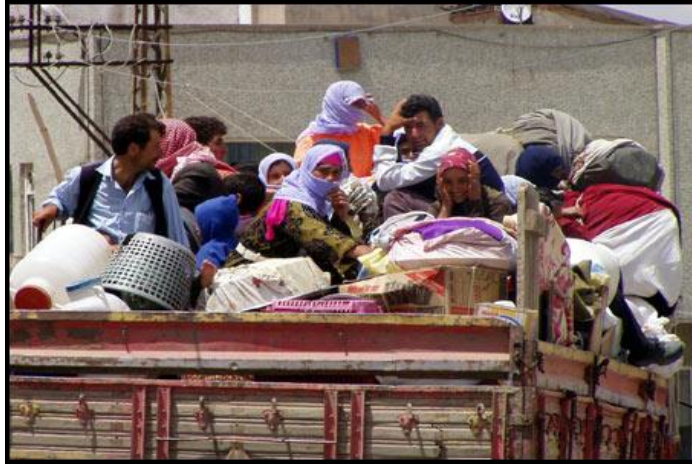
Resim 2.2: İç göç