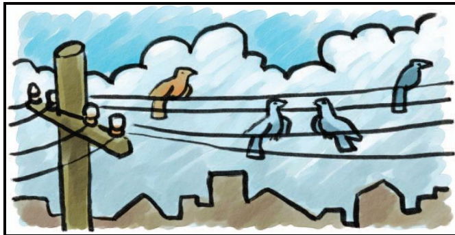
Resim 1.6: Kentlerde doğal yaşam alanlarının tükenmesi

Hızlı kentleşme, birçok sorunu da beraberinde getirmektedir. Kentlerdeki yoğun nüfusun sebep olduğu kalabalıklaşma maliyeti ihmal edilemez bir seviyededir. Örneğin, kent içi ulaşımında milyonlarca insanın sürekli olarak yer değiştirmesi hem trafik sıkışıklığı nedeni ile zaman kaybına hem de akaryakıt israfına yol açmaktadır. Ayrıca yaşanan stres, verimliliğin düşmesine ve dolayısıyla üretim azalışına neden olmaktadır. Kentsel çevre sorunlarının önemli bir sonucu olan çevre kirliliği; genel olarak insanların her türlü faaliyetleri sonucu suda, toprakta ve havada meydana gelen olumsuz gelişmelerle ekolojik dengenin bozulması ve böylece ortaya çıkan kötü koku, zehirlilik, radyasyon, gürültü, hava kirliliği ve arzu edilmeyen diğer sonuçlar olarak tanımlanabilir.