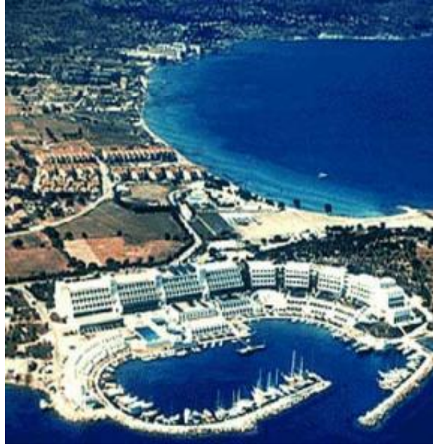
Resim 3.5: Turistik tesisler

Turizmin çevresel etkilerinin değerlendirilmesi ve anlaşılması sektörün sağlıklı gelişmesi açısından oldukça önemlidir.