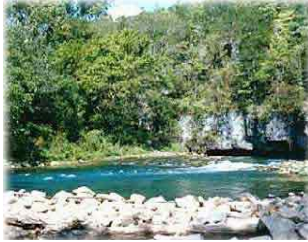
Resim 1.2: Su kaynakları