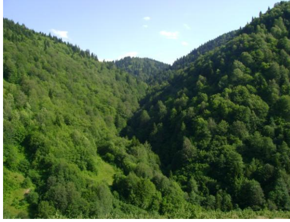
Resim 1.9: Ormanlık alanlar

Kentlere yönelik yoğun nüfus hareketleri, doğal çevre şartlarının tahribatına neden olurken yerleşim alanlarının talebi karşılamadaki yetersizliği, ormanlık alanları yerleşim yeri alanlarına dönüştürmüştür.