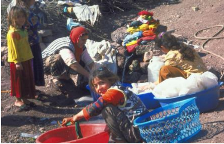
Resim 2.4: Köyden kente göçün olumsuz sonuçlarından birisi

Nüfus hareketlerinin yoğun olarak yaşandığı yerlerde göç nedenleri araştırılmalı ve sorunun çözümü için gerekli mekanizmalar işletilmelidir. Kırsal kesimden göç hızının azalması kentlere yığılma hızını azalttığı ölçüde kentsel çevrenin korunmasına yardımcı olacaktır. Yerleşimlerin taşıma kapasitelerine uygun planlama yapılmalıdır. Ülkenin nüfus artışı ve kırsal nüfusun kentlere göçü kontrol altına alınmalı, kentleşmede ekolojik planlama unsurları kullanılmalıdır.