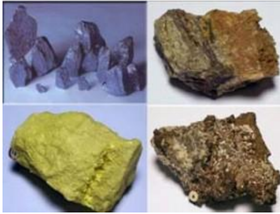
Resim 1.3: Yeraltı kaynakları