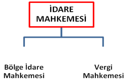
Şema 1.3: İdare Mahkemesi alt birimleri