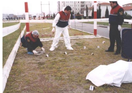
Resim 2.2: Delillerin toplanması