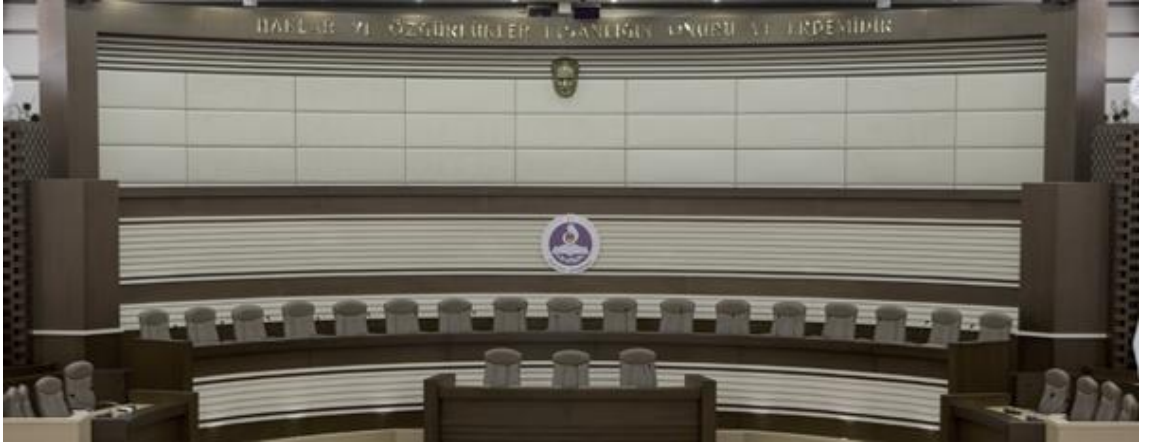
Resim 1.8: Anayasa Mahkemesi ve üyeleri