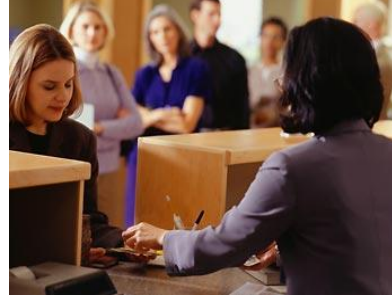
Resim 1.6:Noterde bir işlem