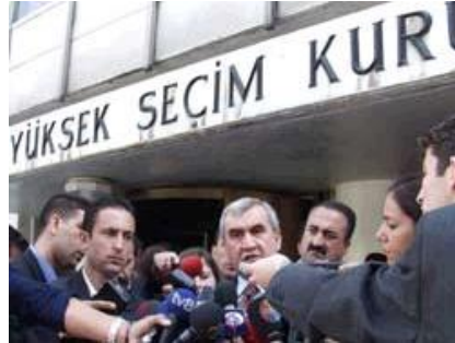
Resim 1.9: Yüksek Seçim Kurulundan açıklama

Seçimlerin Temel Hükümleri ve Seçmen Kütükleri Hakkında Kanun'un ilgili maddelerinde zikredilen (ifade edilen) seçimle ilgili görevleri yerine getirmekle yükümlüdür.