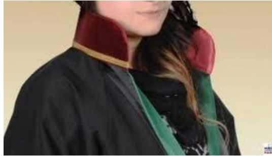
Resim 1.2: Savcı

Savcıların asıl görev alanı, ceza ve ceza yargılaması hukukudur. Özel hukuka ilişkin davalarda kural olarak savcılarının bir görevi yoktur. Ancak, çok istisnai hâllerde savcılara hukuk davalarını açma görevi verilmiştir. Bu hâller ise kamu düzeniyle ilgili olan hâllerdir