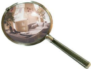
Resim 2.1: Delil toplama

Dava açan taraf veya davalı, kendisinin haklı olduğunu ispat etmek için kendi lehine olan olayları ve delilleri dilekçesinde mahkemeye bildirmelidir. Örneğin, (A) bir satım sözleşmesi nedeniyle (B) den alacaklı olduğunu iddia ederek dava açarsa dava dilekçesine alacağını gösteren senedi veya sözleşmeyi de eklemelidir. Aynı şekilde bu davada borcunu ödemediği için borçlu olmadığını ileri süren davalı da borcun ödendiğine dair bir makbuzu mahkemeye sunmalıdır. Örneğin, bir trafik kazası nedeniyle tazminat davası açan (A), bu davada olayı gören tanıkların ismini mahkemeye bildirmelidir. İsmi mahkemeye bildirilmeyen tanıkların dinlenmesi mümkün değildir.