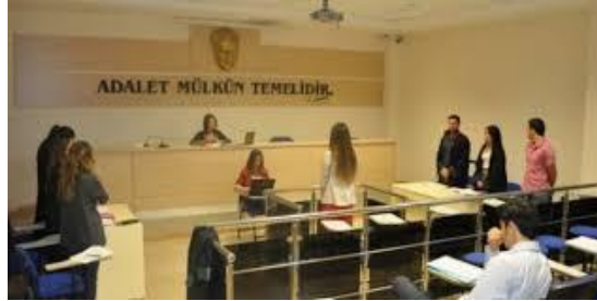
Resim 1.7: Mahkemede bir oturum (hâkim ve zabıt kâtibi)

Bir hukuk davasının hangi mahkemede görüleceği sorunu, görev kurallarının konusunu oluşturur. Görev konusu kamu düzenine ilişkin olup emredici nitelik taşır. Bir davanın görüleceği mahkeme, dava konusunun miktarı veya değerine göre belirlenebileceği gibi, davanın niteliğine göre de belirlenebilir. Bunların yanında davalara çeşitli kanunlarla görevlendirilmiş özel uzmanlık mahkemelerince de bakılabilir.