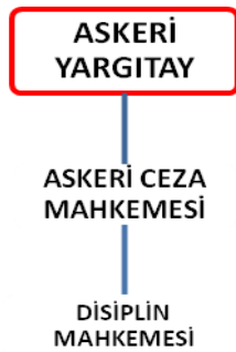
Şema 1.2: Askerî Yargıtay alt birimleri

Bunların bazılarının da kendi alt birimleri vardır: