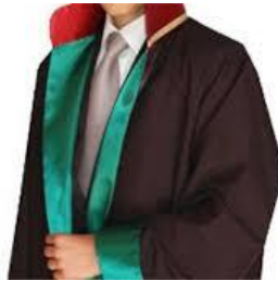
Resim 1.4: Avukatlar

Ülkemizde bir dava açabilmek veya açılmış olan davayı takip edebilmek için avukat tutma zorunluluğu yoktur