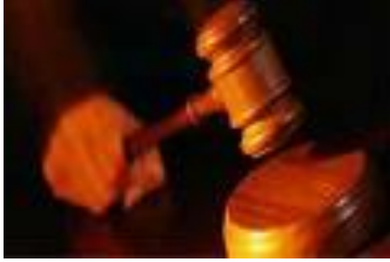
Resim 2.3: Karar ve hüküm

Kararın en önemli unsuru hüküm sonucudur. Hüküm sonucu kısmında, gerekçeye ait herhangi bir söz tekrar edilmeksizin tarafların istem sonuçlarından her biri hakkında verilen hükümlerle taraflara yüklenen borç ve hakların, sıra numarası altında açık, şüphe ve tereddüt uyandırmayacak şekilde gösterilmesi zorunludur. Ayrıca karara karşı gidilebilecek kanun yollarının (temyiz yolu açık olmak üzere gibi) gösterilmesi gerekir. Böylece hükme karşı kanun yoluna başvurmak isteyen tarafa kanun yoluna başvurma hakkı hatırlatılmış olur. Ancak, bir kararda aslında tarafın veya tarafların her ikisinin kanun yoluna başvurma hakları olmasına rağmen bu hak gösterilmemiş olsa bile taraflar yine de kanun yoluna başvurabilirler.