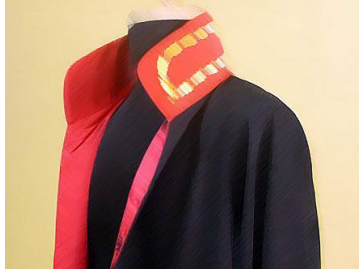
Resim 1.1: Hâkim

Adli ve idari yargı olmak üzere iki ana kola ayrılan hâkimlik mesleği, adli yargı bakımından sadece Hukuk Fakültesi mezunları arasından ihtiyaca göre açılan sınavlarla seçilirler. İdari yargı hâkimleri ise başta hukuk fakültesi olmak üzere siyasi bilgiler, iktisadi ve idari bilimler fakültesi mezunları arasından sınavla seçilmektedir. Yüksek mahkemeler olan Yargıtay, Danıştay ve Anayasa Mahkemesinin hâkim üyeleri ise Cumhurbaşkanı tarafından seçilerek atanmaktadır.