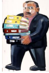
Resim 1.3: Mübaşir

Duruşmalara tarafların çağırılması, duruşma salonuna alınması ve duruşmanın disiplinini sağlamak için hâkim tarafından verilen görevleri yerine getirmekle görevli olan memurlardır.