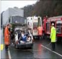
Resim2.2: Kaza riski

Gerek günlük yaşamda, gerekse sigortacılık terminolojisinde, “riziko” terimi, farklı anlamları ifade etmek için kullanılmaktadır.