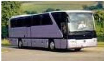
Resim 1. 7: Yeşil kart sigortası

Motorlu aracın yurt dışında (poliçe üzerinde yazılı ülkelerde) işletilmesi sırasında üçüncü şahısların ölümüne veya yaralanmasına veya maddi zarara sebebiyet vermiş olmasından dolayı, bulunduğu ülkenin Trafik Sigorta Kanuna göre işletene düşen maddi sorumluluğu, zorunlu sigorta limitlerine kadar temin eder.