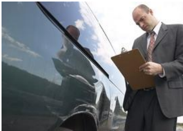
Resim 1. 1: Kaza sigortası müşterisi

Çalışanların ve meslek eğitimi görenlerin kazançları ne kadar olursa olsun yasa gereğince kaza sigortası vardır. Genelde, bunun dışında işyerine grup halinde gidip gelenler, bu nedenle yolda normal güzergâhtan ayrılmaları gerekse bile sigortalıdırlar. Kaza sigortalarını uygulamada; motorlu araç sigortaları (Oto kaza), Oto dışı kaza sigortaları ve ferdi kaza sigortaları olmak üzere üç kısımda inceliyoruz.