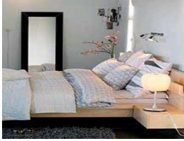
Resim 1.9: Ev eşyası

Sigortalı yerde bulunan sigorta konusu kıymetlerin hırsızlık veya hırsızlığa teşebbüs neticesinde meydana gelen zararlarını poliçede yazılı limitlere kadar temin eder.