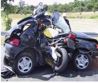
Resim 1.2: Kaza sonucu

Kaza terimi, kişilerin kendi iradesi dışında, ani ve harici bir nedenin etkisiyle meydana gelen, önceden tasarlanmamış bir olayı ifade eder.