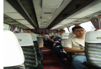
Resim 1.16: Koltuk ferdi kaza

Şehirlerarası ya da uluslar arası yolcu taşıyan ve poliçede kayıtlı olan otobüste bulunan yolcuları, sürücülerini ve yardımcıları, mola ve duraklamalar dahil yolculuğun bitimine kadar meydana gelebilecek her tür kazaya karşı güvence altına alır.