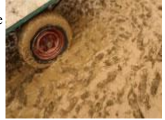
Resim 1. 4: Sel baskını