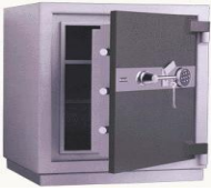
Resim 1.10: Kasa

Kasada bulunan para, kıymetli evrak, dövizin her türlü hırsızlığını ve ayrıca hırsızlar tarafından hırsızlık ve hırsızlığa teşebbüs esnasında sigortalı kasa muhteviyatına veya kasaya yapılacak ziyan ve hasarları temin eder.