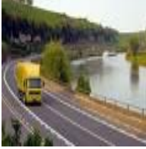
Resim 1.6: Trafik

“Zorunlu mali sorumluluk sigortası” olarak kabul edilen bu sigorta türünde, hasar nedeniyle sigortalının servetindeki azalmayı karşılamaktan çok, sosyal amaçlar göz önünde tutulmaktadır. Motorlu taşıt araçlarındaki hızlı gelişme ile birlikte trafik kazaları, ölüm ve yaralanmalar giderek artmakta, bunların kanun yolu ile korunması bir zorunluluk olmaktadır. Karayolları Trafik Kanunu’na göre Türkiye’de trafiğe kayıtlı olan her aracın bir “zorunlu mali sorumluluk sigortası” olması gerekmektedir. Bundan dolayı bu sigortaya “trafik sigortası” da denmektedir.