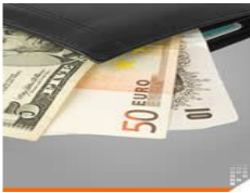
Resim 1. 11: Para

Taşıyan para ve kıymetlerin; üçüncü kişiler tarafından silahla tehdit veya tecavüz veya zor kullanmak suretiyle meydana gelecek gasp, hırsızlık, herhangi bir araç ve nakli esnasında aracın kazaya uğraması veya yanması neticesinde ziya ve hırsızlıklar ve nakil esnasında zorunlu sebepler neticesinde meydana gelecek kayıpları temin eder.