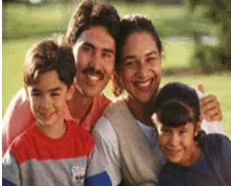
Resim1.15: Ferdi kaza sigortası

Bu sigorta türünde amaç, bir kaza sonucu ortaya çıkan ölüm ve yaralanma hallerinde sigortalı ya da yakınlarına tazminat sağlamaktır. Niteliği gereği, daha çok hayat sigortalarına yakın bir sigorta çeşididir. Sigorta poliçesi, ölüm ya da bir uzvun kaybı veya sürekli işgörememezlik (daimi maluliyet) hallerinde belirli bir toplu meblağı, geçici iş görememezlik halinde ise belirli bir süre (104 hafta gibi) haftalık ya da aylık bir tutarı tazminat olarak öder.