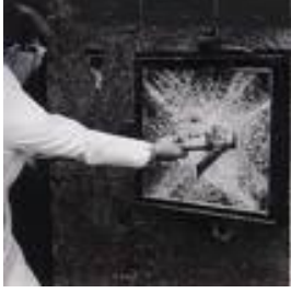
Resim 1.14: Cam kırılması

Cam kırılma sigortası, ticari firmaların, kurumların ve şahısların evlerinin, ticarethanelerinin ve yazıhanelerinin pencere, vitrin, kapı, masa camları ile aynalarının ve ışıklı-ışıksız reklam levhalarının kırılması sonucu meydana gelecek hasarları güvence altına alır. Bir diğer deyişle, vitrin, cam kapı tabela, ışıklı levha, pencere gibi eşyaların kırılması suretiyle meydana gelecek hasarları güvence altına alır. Bütün cam çeşitleri sigorta güvencesi altına alınabilir.