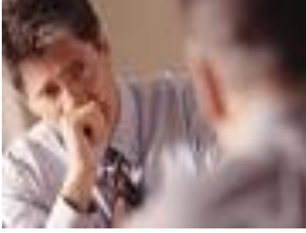
Resim 1.3: Kasko müşterisi

Karayollarında kullanılabilen motorlu, motorsuz taşıtların gerek hareket, gerek durma halinde iken sigortalının veya aracı kullananın iradesi dışında araca ani ve dış etkiler neticesinde sabit ve hareketli bir cismin çarpması veya aracın böyle bir cisme çarpması, devrilmesi, düşmesi gibi kazalar ile; aracın yanması, aracın çalınması veya çalınmaya teşebbüsü neticesinde uğrayacağı maddi zararı temin eder.