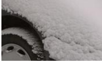
Resim 1.5: Donma olayı