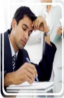
Resim 2.1: Risk

Aracınızla giderken, yolda yürürken, otobüsten inerken, evinizde temizlik yaparken ya da bir merdivende, asansörde, hiç beklemediğiniz birçok yerde talihsiz bir kaza gelip sizi bulabilir.