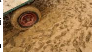
Resim 1.3: Sel Baskını