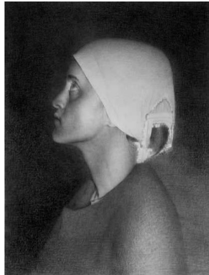
Resim 14: Eserin sanat eseri sayılabilmesi için estetik ve özgün olması gerekir

Bu tür eserlerde korunan eserin tek olan aslıdır.