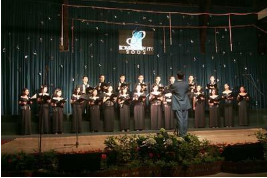
Resim 2.2: Bir müzik eserinin CD'ye kayıt edilmesi

Basın Kuruluşlarının Özel Çabayla Elde Ettikleri Ürünlerin korunması “Komşu Haklar” kapsamında ele alınmaktadır.