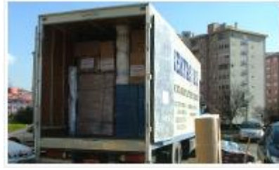
Resim 2.8: Eşyaların nakliye aracına yerleşmiş hâli