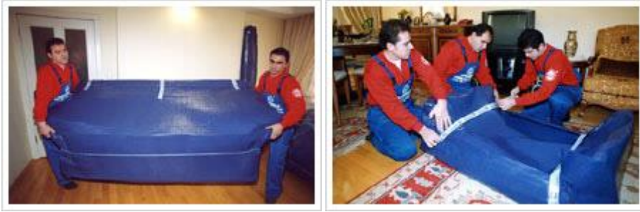
Resim 2.2: Evden eve taşımacılık

Bu yöntem ile taşınıldığında yeni ev, taşınma şirketi yetkililerince çok kısa sürede ihtiyacı karşılayacak hâle getirilir.