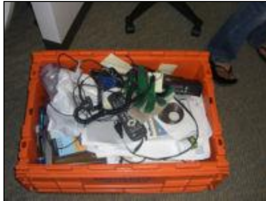
Resim 1.11: Küçük eşyaların bir arada kolilenmesi

Hırdavat kolisi, herkesin ulaşabileceği şekilde ortada bırakılabilir. Böylelikle herkes yardım edebilir. Küçük detaylarla işler kolaylaştırılabilir.