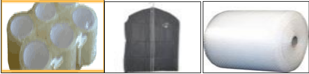
Resim 1.6: Koli bantları, elbise koruyucu askıları, streç