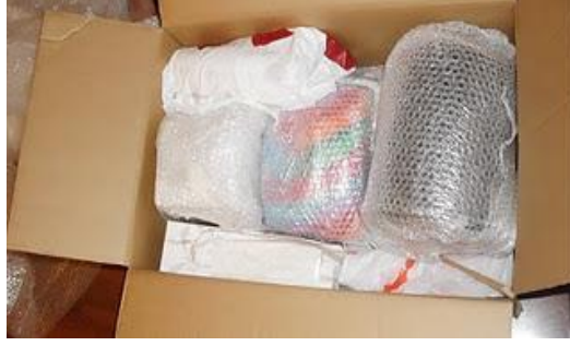
Resim 1.1: Eşyaların toplanması ve paketlenmesi