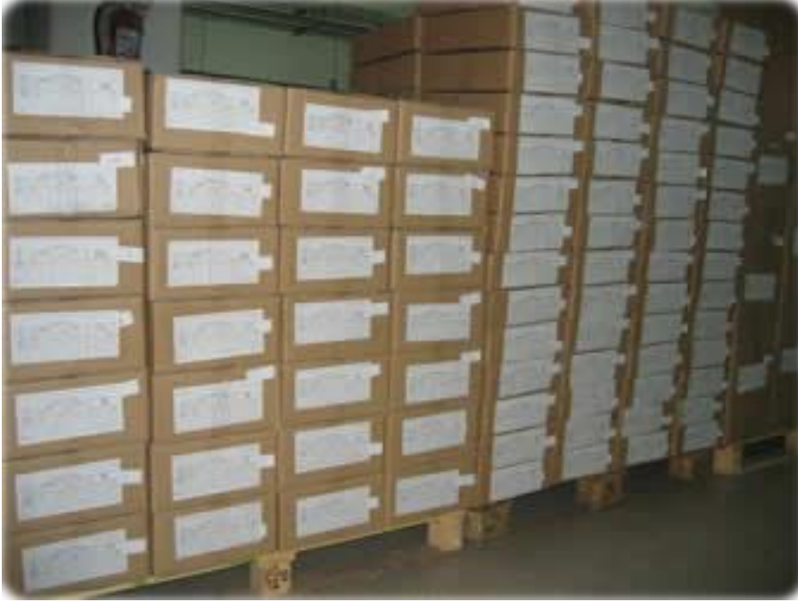
Resim 1.8: Etiketlenmiş koliler

Eşyaları kolilerken pek çok malzeme kullanılmaktadır. Koli, koli bandı, lastikler, vakumlu torbalar, battaniyeler, alet çantası vb.