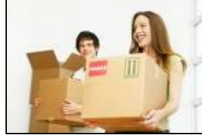
Resim 2.5: Eşyaları taşıma

Taşınma işlemi kişisel olarak yapılacaksa öncelikle uygun bir araç kiralamak gerekir. Kiralanan araç eşyaların tamamını bir seferde götürecektense kadar büyük değilse birkaç sefer yapması gerekebilir bu da zaman ve enerji kaybına neden olur.