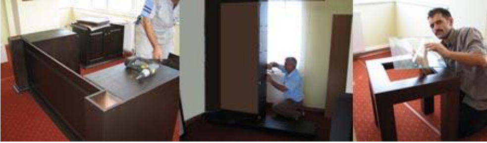
Resim 2.14: Eşyaların montajı