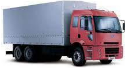
Resim 2.13: Kapalı nakliye aracı