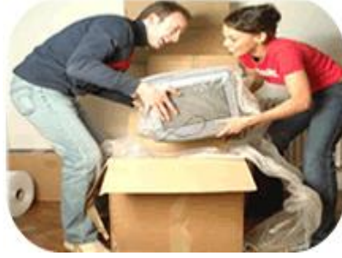
Resim 2.3: Aile bireyleri tarafından eşyaların toplanması