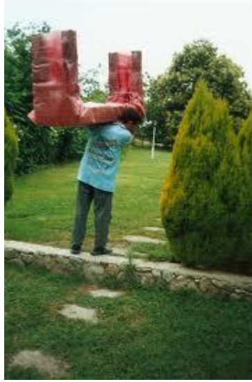
Resim 2.6: Eşyaların araca taşınması

Düzenleme taşınan kişinin tercihlerine göre yapılacağı için sorumluluk da kişiye aittir. Bazı paketler taşınan kişiler tarafından yapılırsa da ağır eşyaların paketlenmesi ve taşınması mutlaka uzman kişilere bırakılmalıdır.