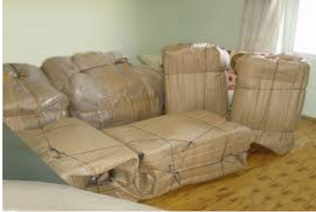
Resim 1.3: Eşyaların paketlenmesi

Kitapların toplanması, taşınması ağırdır. Değerli eşyalar ise hassas paketleme gerektirir. Bazı mobilyaların da sökülmesi gerekebilir bu farklılıklar dikkate alınarak paketleme ve kolileme işlemleri yürütülmelidir.