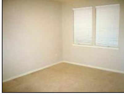
Resim 2.12: Taşınma sonrası son kontrol