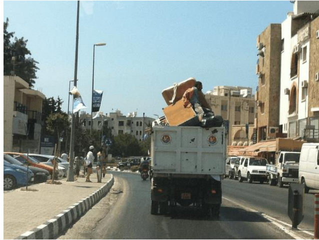
Resim 2.4: Ulaşım aracı kiralanarak ev taşıma

Bunun dışında kolileme ve araca taşıma taşıyacak kişi ve kişiler tarafından yapılırken ulaşım aracı kiralanarak da taşınma yöntemi seçilebilir.