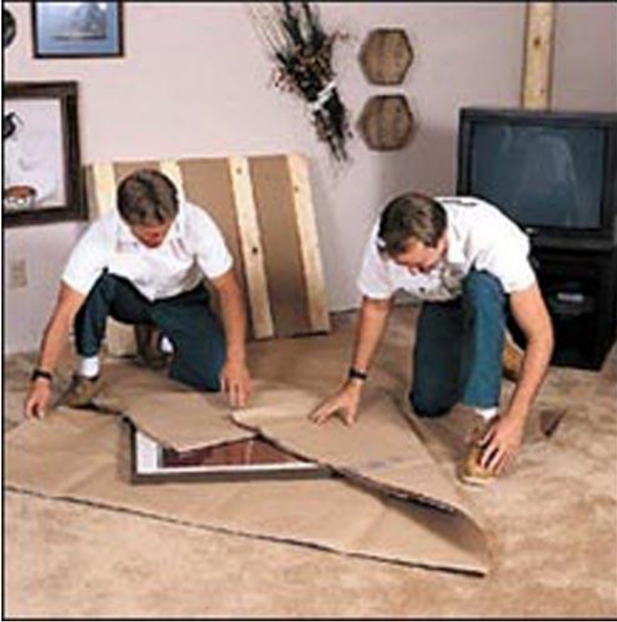
Resim 1.2: Eşyaların toplanması ve sarılarak paketlenmesi

Taşınma her ne sebeple olursa olsun sıkıntılı bir durum oluşturabilir. Sorunsuz bir taşınma için taşınma öncesi eşyaların uygun şartlarda planlı bir şekilde paketlenerek kolilere yerleştirilmesi gerekir.