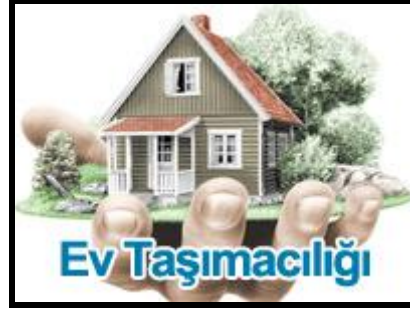
Resim 2.1: Ev taşımaları

Arkadaş tavsiyesi, yakın tarihte taşınan kimselerden alınan tavsiyelerle de şirketlere ulaşılabilir. Ayrıca İnternet, faks gibi yöntemlerle de nakliye şirketlerine ulaşmak çok tercih edilen ve kolay bir yoldur.