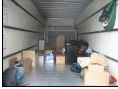
Resim 2.7: Eşyaların araca yerleştirilmesi