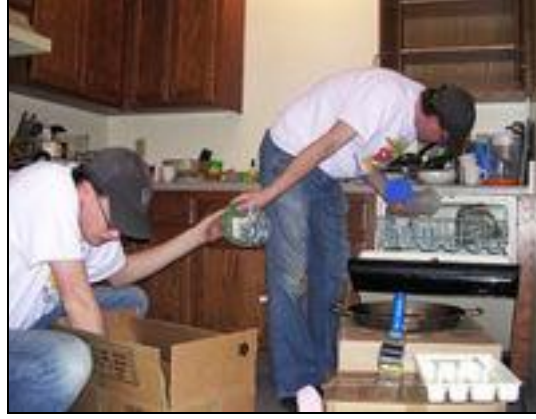
Resim 2.11: Mutfak eşyalarının yerleştirilmesi