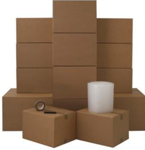
Resim 1.9: Nakliye kolilerinden örnekler

Etiketleme işleri bitince koliler sıraya dizilmeli, odanın bir köşesine üst üste konularak taşınma gününe kadar muhafaza edilmelidir.