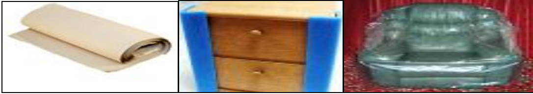
Resim 1.7: Eşya sarma kâğıtları, oluklu koruyucu köpükler ve strecin uygulanışı