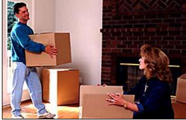
Resim 1.10: Aile bireylerinin iş paylaşımı

Çocuklar arasında iş paylaşımı yaparak taşıyabileceklerinden daha fazlası verilmemelidir. Yaşları uygunsa kendi odalarında bulunan oyuncak, kitap, aksesuar gibi eşyaları toplayabilirler. Gerekirse yardım da edilerek üzerlerine içinde bulunan eşyalar not edilebilir. Yaşları daha küçük olanlara boş koliler taşıtılabilir.