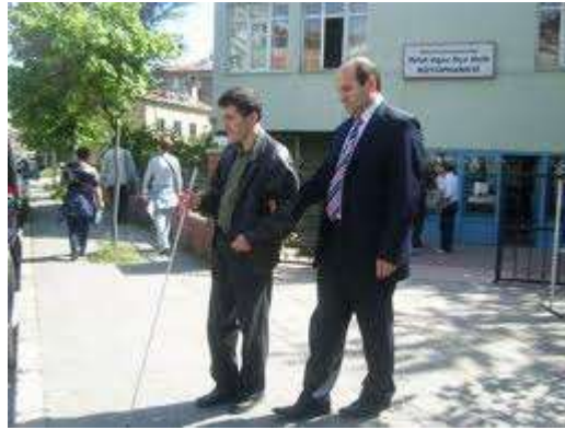
Resim 2.2: Görme engelli

Görme engelinin yasal tanımı görmenin veya körlüğün ölçümüne bağlıdır. Tek veya iki gözünde tam veya kısmi görme kaybı veya bozukluğu olanların yanı sıra, görme kaybıyla birlikte göz protezi kullananlar, renk körlüğü, gece körlüğü olanlar da bu grupta değerlendirilir.