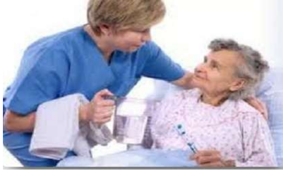
Resim 1.1: Engelli bakımı

Bakımevleri ve huzurevlerinin yaygınlaşması, evde bakıma ihtiyaç duyan engelli nüfusun artması “Bakım elemanı” mesleğine ihtiyaç olduğunu ortaya koymaktadır. Yaşlı, engelli ve engelli bakımında bu alanla ilgili bakım elemanının olması ve uygulanan teknik ve yöntemlerin doğru bir şekilde kullanılması için eğitilmiş elemanlara ihtiyaç vardır.