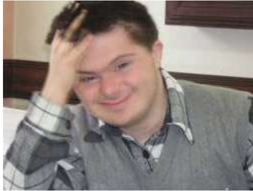
Resim 2.3: Otizm

Otizm, beyin ve sinir sisteminin farklı yapısından ya da işleyişinden kaynaklanan ve 3 yaş öncesi çocuklarda ortaya çıkan nöro-biyolojik bir bozukluktur. Tamamında olmasa da otizmlili bireylerde sözel olan ve sözel olmayan iletişim ve sosyal ilişki güçlüğü gibi gelişimsel sorunlar görülebilir.