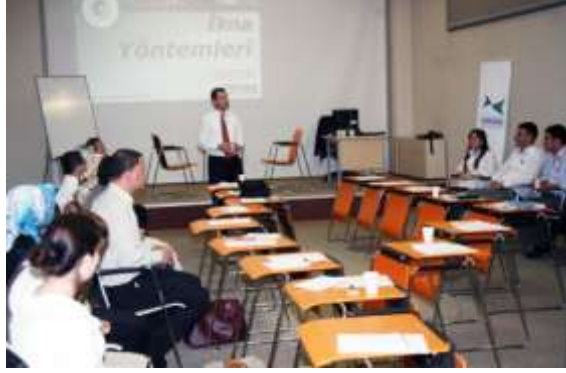
Resim 1.3: Sözlü iletişim

İsteyerek, farkında olarak yaptığımız konuşmalara “niyet edilmiş dil davranışı” adı verilir. Konuşurken dilimizin sürçmesi ise niyet edilmemiş dil davranışlarına bir örnektir. Bazı kelimelerin üzerine basa basa konuşmalarımız ya da karşımızdakini korkutmak için bağırmanın, niyet edilmiş dil ötesi davranışlarıdır. Konuşurken farkında olmadan ses tonumuz açılıp yükseliyorsa ya da sesimiz titriyorsa, bu durumda niyet edilmiş dil ötesi davranışlar söz konusudur.