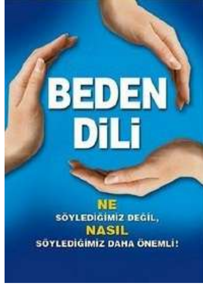
Resim 1.5: Sözsüz iletişim

Kimi zaman insanların duygularını anlamak zordur. Ne hissettiklerini çoğunlukla söylemek istemezler, duygularını kendileri de pek bilmezler. Bu kişilerin ne hissettiklerini öğrenemeyeceğimize göre yüz ifadelerine, beden diline bakarak o anda nasıl bir duygu içinde olduklarını anlamaya çalışırız. Bedensel dilini anlayabilmek için bu belirtilere duyarlı olmak gerekir.