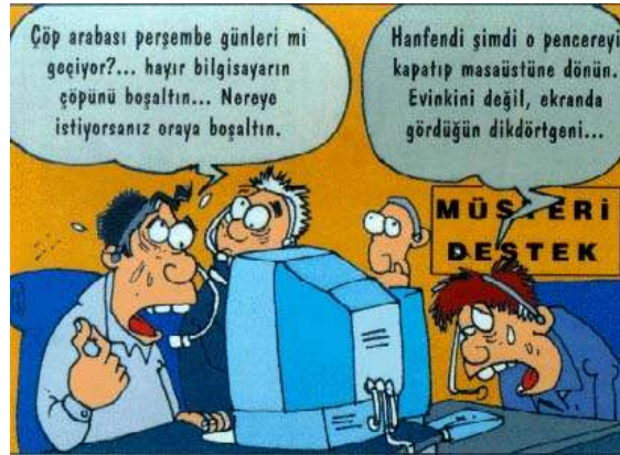
Resim 1.4: Yazılı iletişim

Yazılı iletişim ekonomik gerekçelerle ortaya çıkmış ve bazı toplum, kültürel ilişki ve kurumlar üzerinde etkili olmuştur. Buna karşılık kurumlar da yazının evrim ve yayılma süreçlerinin yönünü ve hızını belirlemiştir.