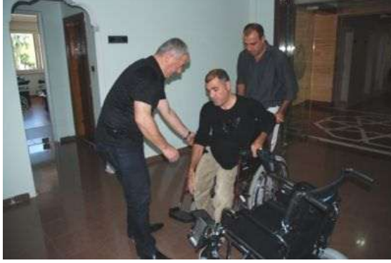
Resim 2.4: Tekerlekli sandalyeye baęlı engelli

Doęuřtan veya sonradan oluřan sebeplerle bireyin zellikle alt eklemlerini kullanamamasıdır. Tekerli sandalye kullananlar farklı zr derecelerine ve kabiliyetlere sahiptir.