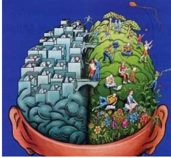
Resim 1.2: İletişimin özellikleri

İletişim kalıpları, kişilerin anlaşması başka bir deđişle mesajın etkili olması için gereklidir. İletişim kalıbı iyi düzenlenirse işaretler kısaltmalar anlamlı hâle gelir, mesajın etkisi artar.