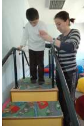
Resim 2.6: Serebral palsili çocuk