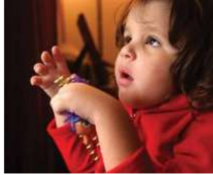
Resim 2.8: Otizm

Genellikle, otistik birinde bu davranışların hepsi görülmez. Otizmi olan bireylerin zekâ seviyeleri de farklılık gösterir. Ciddi öğrenme güçlüğü olanların yanında, öğrenme güçlüğü çekmeyen hatta üstün zekâyâ sahip olanlar vardır. Bu kişilerin çoğuna yaşam boyu destek gerekir. Özel eğitimle var olan kapasiteleri açığa çıkartılarak bağımsız yaşam becerisi kazanmaları sağlanır.