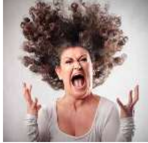
Resim 2.8: Turet Sendromu

Turet sendromlu bireylerin istem dışı tikleri vardır. Bu bireylerin istemsiz olarak küfürlü konuştıkları görülür. Turet sendromu hem kişinin kendisi hem de yakın çevresindekiler için katlanılması güç durumlara sebebiyet verir. Bu bireyler, çevredekilerin anlayışına ihtiyaç duyar.