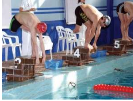
Resim 2.1: Engelli aktiviteleri

Dünya Sağlık Örgütü'nün bu tanımı engelli kişilerin “kısıtlılığı” ve “normal” olmama durumunu vurgulamaktadır. Medikal modelin temelinde yatan “kısıtlılık” ve bireysel patoloji görüşünün temelinde bu tanımın önemli etkileri olmuştur.