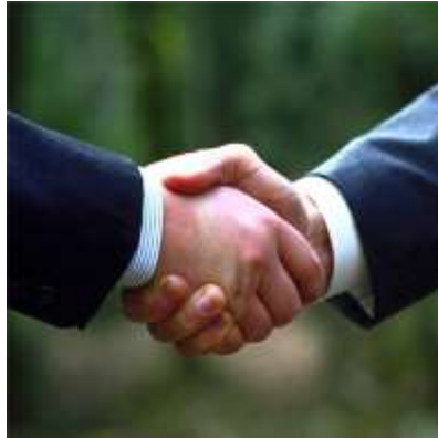
Resim 1.1: İletişim

Yeme-içme ne kadar önemli ise iletişim de o kadar önemlidir. İletişim insan ilişkilerinin her türünü içine alır. Bu bakımdan insanlar birbirleriyle iyi bir iletişim kurabildiği ölçüde gelişir, güçlenir ve başarılı olur. Bunu başaramayanlar yalnız başlarına kalır. Sıkıntıları çoğalır, hayatla ilgili problemlerinde zorlanmaya başlar.