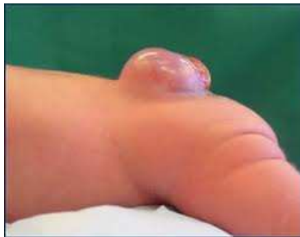
Resim 2.5: Spina bifida

Doğuştan gelen ve sık görülen hastalıklardan biridir. Spina bifida, ana rahminde bebeğin omurgası gelişirken bir ya da daha fazla omur kemiği ve omuriliğin bir kısmının iyi gelişmemesi sonucunda, görülür. Bu durumlarda omurilik ve sinir sisteminde değişik derecelerde hasar oluşur. Bacaklara, idrar kesesine ve kalın bağırsaklara giden sinirlerin çalışmaması nedeni ile yaşam boyu sürececek kısmi bir felç görülür.