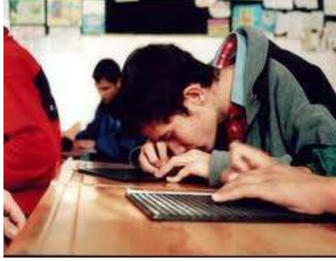
Resim 2.3: Görme engelliler