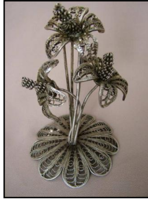
Resim 3.2: Telkârigümüş çiçek

Sigara dumanı gümüşlerin düşmanıdır, sigara içilen ortamda gümüş bulundurulmamalıdır. Kısa sürede oksitlenmemesi için günlük tozu kuru bezle alınmalıdır, ıslak bez değdirilmemelidir. Temizleyiciler ile de temizlenmesi çok zor olan ürünlere oksitlenmemesi için sprey vernik sıkılır(örnek telkâri çiçek).