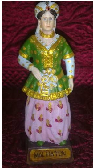
Resim 1.1:Porselen bebek

Taş ürünlerin bakımları zor değildir. Kullanılan taşın özelliğine bağlı olarak temizliği ve bakımı farklılıklar gösterebilir.