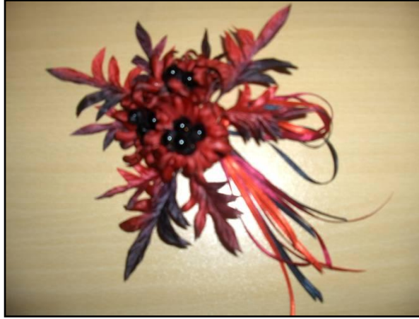
Resim 6.1:Fantezi çiçek

Fantezi çiçekler daha narin kumaşlardan yapılmaları sebebiyle ve yapımında aksesuar (tül, boncuk vb.) saklama koşullarına daha dikkat edilmesi gerekmektedir. Korunması ve saklanması sırasında renklerde solma olmaması için güneşli ortamlardan uzak tutulmalıdır.