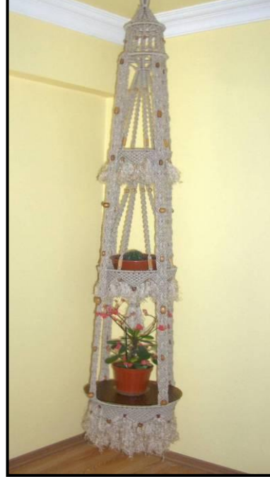
Resim 4.5:Makrome sarkaç