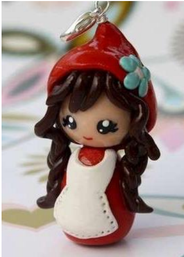
Resim 7.3:Hamur kız bebek