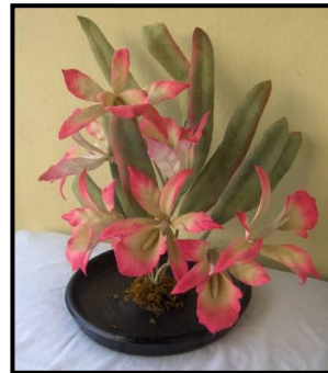
Resim 6.8:Çuval çiçek