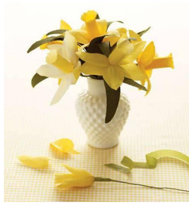
Resim 6.10:Kâğıt çiçek

Kâğıt çiçekler de kumaş çiçekler gibi kesinlikle yıkanmayacağı için korumaya özen gösterilmelidir. Tozları, saç kurutma makinesi ile püskürtülebilir. Taç ve yeşil yapraklar tutkal ile sertleştirilmiş ise tozları kuru bez ile silinebilir. Uzun tüylü yumuşak fırçalarla da tozu alınabilir. Vitrin içinde bulundurulması önerilir. Üzerine jelatin poşet geçirilip baskılanmayacak bir yerde saklanmalıdır.