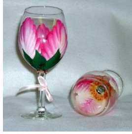
Resim 1.3: Cam kadeh

Cam ürünlerin temizliği üzerindeki süslemenin yapısına bağlı olarak değişmektedir. Genellikle temizlik elde yapılmalıdır. Cam ürünlerin kırılma ihtimali çok yüksek olduğundan mümkün olduğunca iyi koruma bir gerekmektedir.