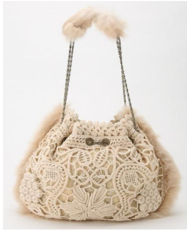
Resim4.1:Tığ örgü çanta

Tığ örgü ürünler genellikle güneş almayan bir ortamda saklanır. Ara sıra temizlenip havalandırılır ve daha uzun süre zarar görmemesi sağlanır.