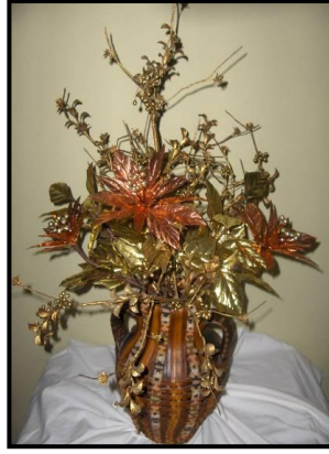
Resim 6.7: Metal çiçek

Metal çiçeklerin tozlarısaç kurutma makinesi ile püskürtülebilir. Hassas tüy fırçalar kullanılabilir. Metal yapraklar kolaylıkla bağlama veya yapıştırma yerlerinden kırılıp döküleceğinden tozu alınırken çok dikkat edilmelidir. Oksitleneceği için su değdirilmemelidir. Vitrin içinde bulundurulması önerilir. Saklanırken üzerine geniş jelatin poşet geçirilip baskılanmayacak bir yerde saklanmalıdır.