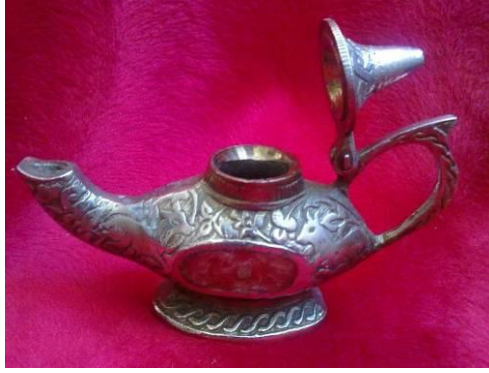
Resim 3.1:Gümüş lamba