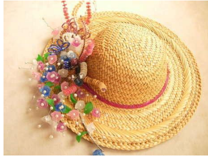
Resim 4.7:Hasır örgü sepet