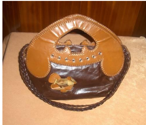
Resim 5.1: Deri Çanta

Deri ürünler koku yapacağı için yıkanarak temizlenmesi çok tercih edilen bir yöntem değildir. Islak temizlik deforme olmasına sebep olmaktadır. Nemli bir bez yardımı ile silinmesi tercih edilir. Çok kuru veya nemli ortamlarda saklanmamalıdır.