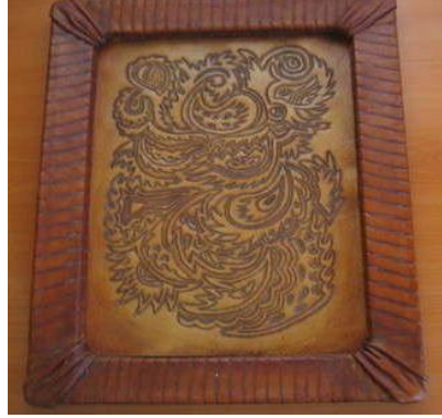
Resim 5.2:Resim çerçevesi