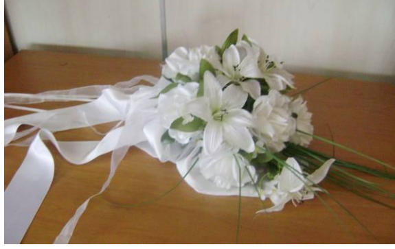
Resim 6.2:El buketi

Fantezi çiçeklerin temizliđi mümkün olmadığından çok dikkatli kullanılmalıdır. Kullandıktan hemen sonra baskılanmaması için kutu içine pamuklar arasına özenle yerleştirilerek saklanmalıdır.