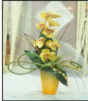
Resim 6.6: Dekoratif Çiçek