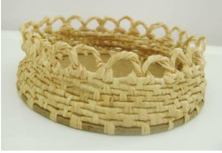
Resim 4.6:Hasır örgü şapka

Bitkisel örücülükte genellikle sap ve dallar kullanılarak ürün oluşturulur.Kullanılan malzemeye bağlı olarak farklı temizleme teknikleri kullanılır. Bazı malzemeler yıkanabilmekte bazıları ise ıslanması halinde deforme olmaktadır.Fazla güneşte bırakılmamalıdır. Saklanırken ezilme ihtimaline karşı önlem alınmalıdır.