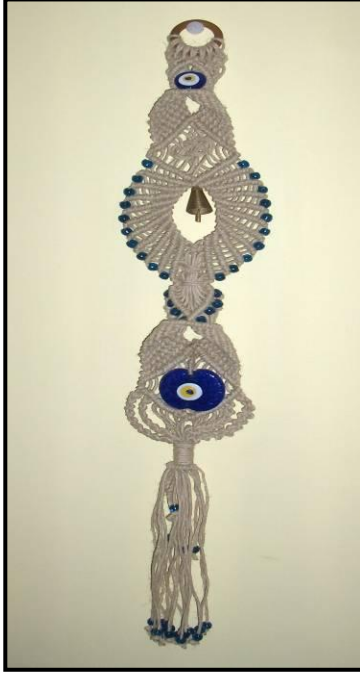
Resim 4.4:Makrome nazarlık

Makrome ürünlerde yapımında kullanılan malzemeye göre bakım ve korunma gerçekleştirilir. Makrome ipi kullanılırsa yıkanarak temizlenmesi sağlanır. Jüt kullanılmış ise silinerek temizlenmesi gerçekleştirilir. Güneş almayan bir ortamda zarar görmeyecek kutu veya poşetlerde saklanabilir.