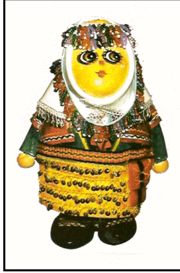
Resim 7.2:Taş bebek

Taş bebekler, çok hafif nemli bezle silinebilir. Temizliği zor olduğundan açıkta bulundurulmamalı, vitrin veya fanus içinde sergilenmelidir. Saklanacağı zaman (baş ve ayak taşları kopmaması için) pamuk ya da yumuşak kumaşlar arasında karton kutular içinde saklanmalıdır.