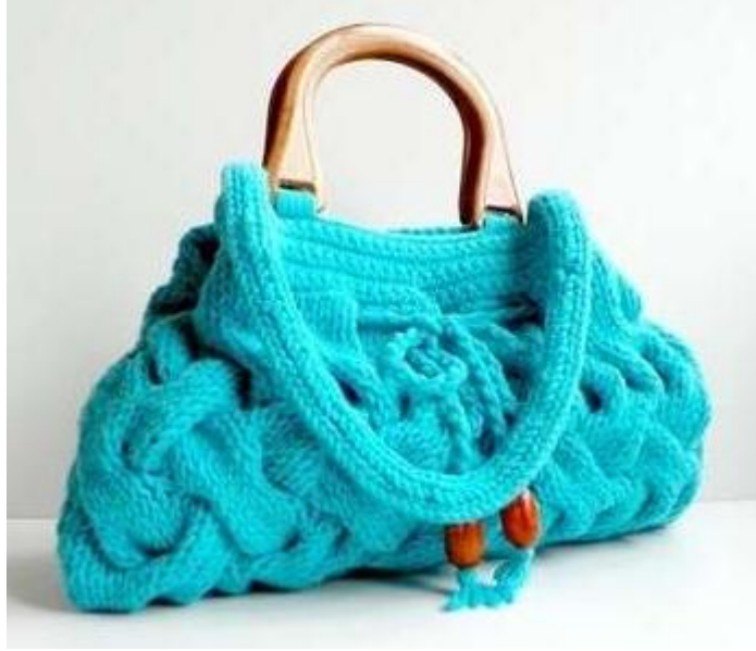
Resim 4.3:Şiş örgü çanta