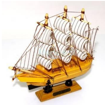
Resim 2.2: Ağaç oyma gemi