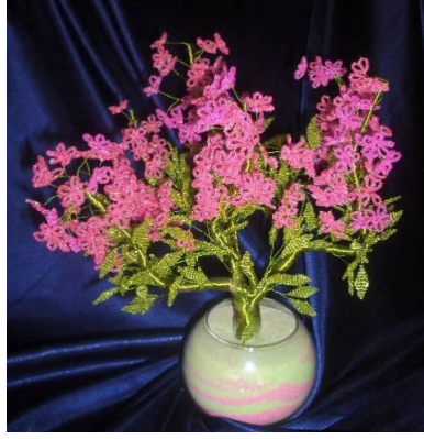
Resim 6.9:Boncuk çiçek

Çuval çiçekler de kesinlikle yıkanmayacağı için korumaya özen gösterilmelidir. Tozları, saç kurutma makinesi ile püskürtülebilir. Yeşil yapraklar tutkal ile sertleştirilmiş ise tozları kuru bez ile silinebilir. Vitrin içinde bulundurulması önerilir. Üzerine jelatin poşet geçirilip baskılanmayacak bir yerde saklanmalıdır.