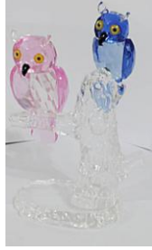
Resim 1.4: Cam biblo