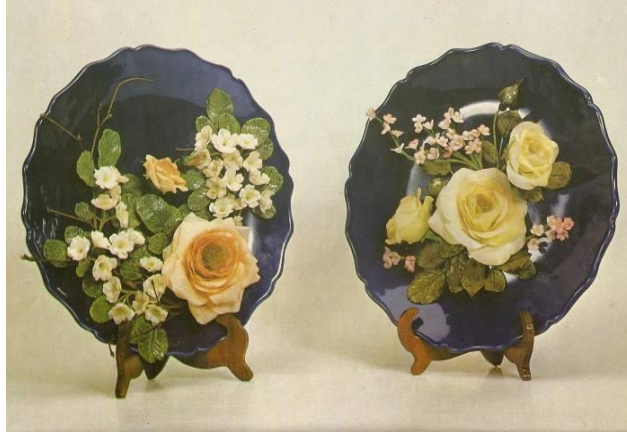
Resim 6.3:Dekoratif tabak

Tutkallı hamur çiçekler, saç kurutma makinesi ile tozları üflenmeli, daha sonra yumuşak bir fırça ile fırçalanmalıdır. Boyası ve verniđi bozulacağından su değdirilmemelidir. Ancak kaynayan su buharına tutulup şekil verildiğinde eski parlaklığına kavuşur.