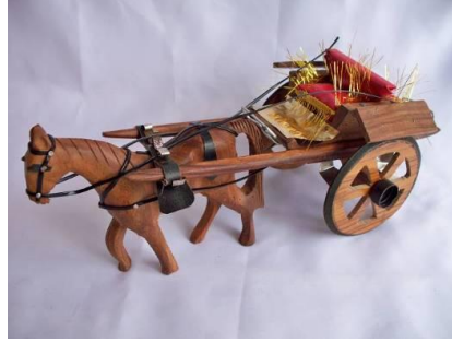
Resim 2.1:Ağaç at arabası