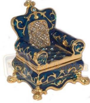
Resim 1.2:Taş koltuk