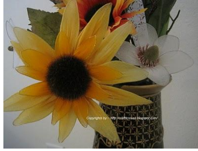
Resim 6.5: Çorap çiçek

Çorap çiçekler kolasız olduklarından çabuk kirlenir. Eğer boyası ve tohumları bozulmayacak cinsten ise ılık sabunlu su içinde sallanarak yıkanabilir. Yıpratmadan ve tel şekillerini bozmadan yıkamaya özen gösterilmeli, teller çabuk paslanacağı için saç kurutma makinesi ile hemen kurutulmalı, kuruduktan sonra şekilleri düzeltilmelidir.