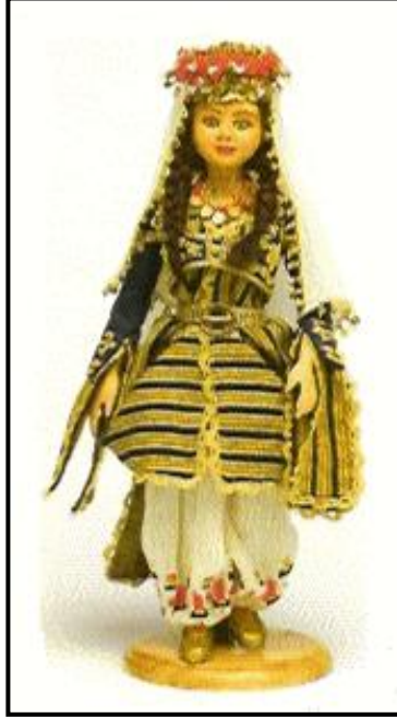
Resim 7.5:Kitre bebek

Kitre bebeklerin kıyafetleri özenle çıkarılıp ılık su ve sabunla elde, çok dikkatli bir şekilde yıpratmadan yıkanabilir. Bebeğin el ve yüzü kuru, yumuşak bir bezle silinmelidir. Temizliği zor olan bu bebeklerin korunmasına çok özen gösterilmelidir. Cam fanus, camekân veya vitrin içinde bulundurulmalıdır.