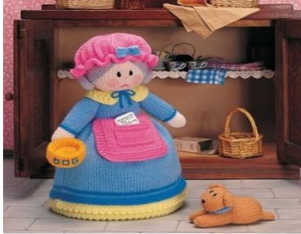
Resim 7.1:Bez bebek

Dolgu dikme ve örgü bebekler, makinede 30 derecede yıkanabilir.Genellikle oyuncak oldukları için özel bir bakım ve koruma gerektirmez.