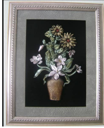
Resim 6.4: Dekoratif pano