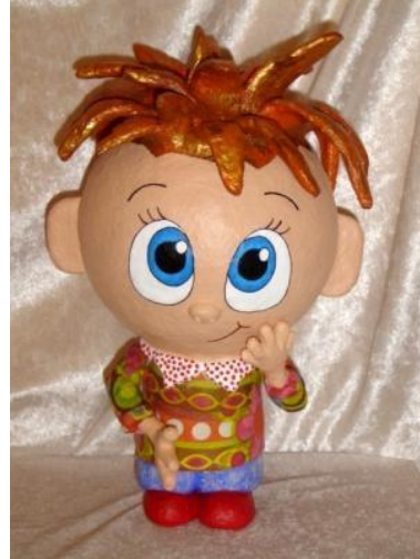
Resim 7.4:Hamur bebek

Hamur bebek ürünler üzerinde kullanılan boyanın cinsine göre nemli ya da kuru bezle silinebilir. Su bazlı boya kullanılmışsa nem boyayı bozacağından kuru bezle silinmelidir. Hamur bebekler çabuk kırılabileceğinden düşürülmemelidir.