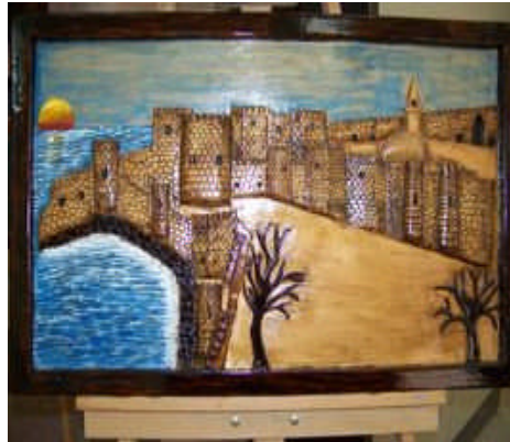
Resim 2.5: Ceza infaz kurumunda yapılan resim tablosu

21.2.2000 tarihli "Millî Eğitim Bakanlığı ile Adalet Bakanlığı İş Birliğinde Ceza İnfaz Kurumları ve Tutukevlerindeki Hükümlü ve Tutuklulara Yönelik Çeşitli Eğitim Faaliyetlerinin Düzenlenmesine Dair İşbirliği Protokolü'nün 5. maddesi uyarınca ceza infaz kurumlarının kadrolu öğretmenlerinin gerek kendilerini geliştirebilmeleri, gerekse eğitim hizmetlerinin kalitesinin artırılabilmesi için ilköğretim müfettişleri tarafından periyodik olarak teftiş ve denetimleri yapılacak, ihtiyaç hâlinde çeşitli kurs ve seminerlere alınmaları sağlanacaktır. Kurumun en üst amirleri, öğretmenlerin, her yıl en geç eylül ayının birinci haftası sonuna kadar, denetimlerinin yapılması konusunda il millî eğitim müdürlüklerine başvuracak, ayrıca Millî Eğitim Bakanlığı il müdürlüklerince il veya ilçelerde açılacak kurs ve seminerlere katılmaları için girişimde bulunulacaktır (Genelge 46).