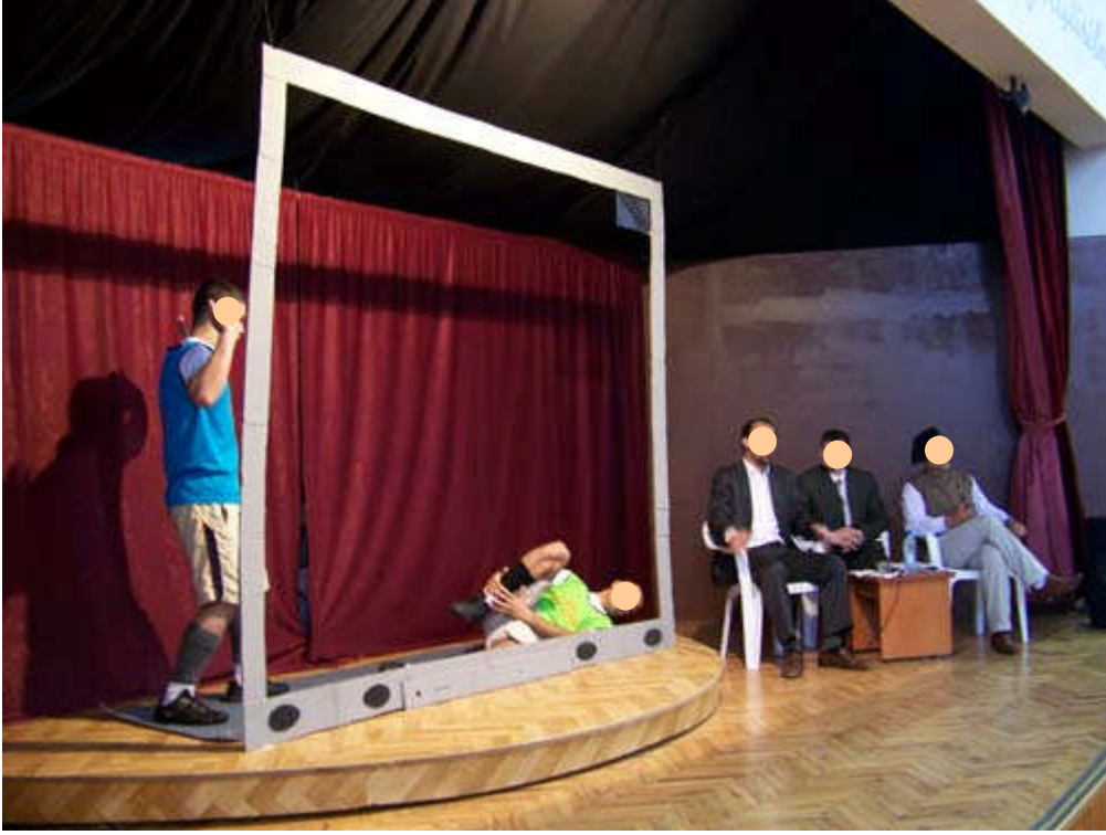
Resim 2.2: Ceza infaz kurumunda tiyatro sahnesinden bir görüntü