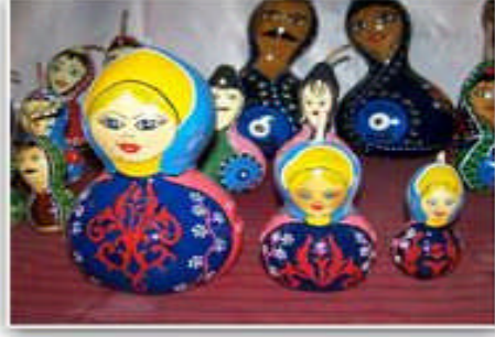
Resim 2.4: Ceza infaz kurumunda üretilen ağaç oyma bebekler