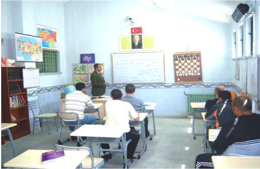
Resim 1.2: Çocuk ve gençlik kapalı ceza infaz kurumundan sınıfta ders gören mahkum ve tutuklular