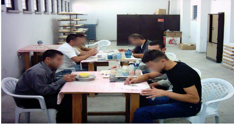
Resim 2.1: Ceza infaz kurumu meslek atölyesi