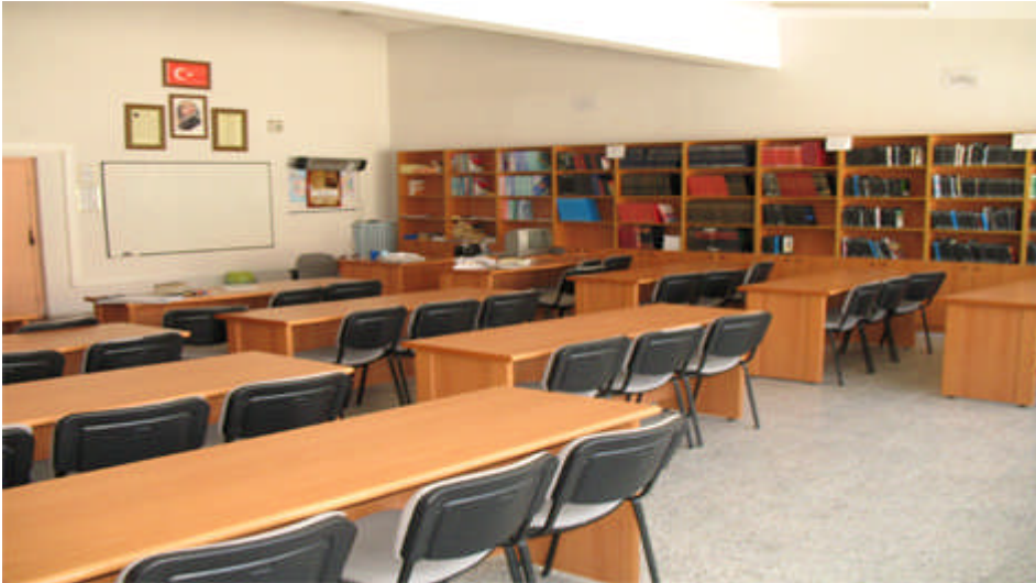
Resim 1.1: Çocuk ve gençlik kapalı ceza infaz kurumu kütüphanesinden bir görüntü

Eğitim, insan kişiliğinin tam gelişmesi ve insan haklarıyla temel özgürlüklere saygının güçlendirilmesi amacıyla yönelik olmalıdır. Herkes eğitim almak, toplumun kültürel hayatına serbestçe katılmak, güzel sanatları tatmak, bilimsel alandaki ilerleyişi ve onun yararlarını paylaşmak hakkına sahiptir.