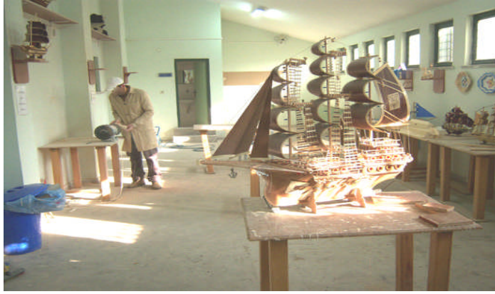
Resim 2.6: Ceza infaz kurumu atölyeden bir görüntü