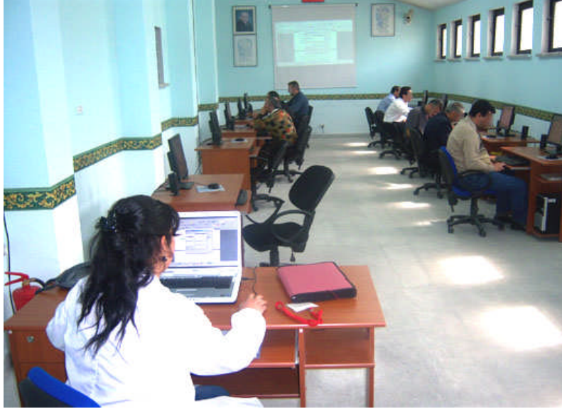
Resim 1.2: Ceza infaz kurumu bilgisayar kursu

Eğitim ve öğretim servisi ile psiko-sosyal yardım servisi personelinin kurumda bulunan elektronik ortamdan yararlanması sağlanarak ilgili mevzuat ve bu Genelge uyarınca yapmış oldukları çalışmalar ile düzenlemiş oldukları çizelgeler, elektronik ortamda saklanır. Eğitim ve öğretim servisi ile psiko-sosyal yardım servisinde internet bağlantısı olan en az bir bilgisayar olması gerekir.