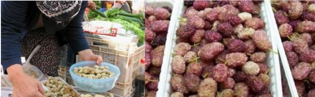
Fotoğraf 3.3: Dut meyvesinin pazarda sunumu

Yıkanmamış meyveler kapalı bir kaptaki buzdolabında birkaç gün saklanabilmektedir. Dutlar (raf ömürleri kısa olduğundan), pazar için çekici bir meyve olmadığı için genellikle yöresel olarak tüketilmektedir. Bazı bölgelerde toplanan karadutlar taze suyu sıkılarak satılır. Ama daha çok diğer dut türlerinde olduğu üzere pekmez, şurup, reçel ve marmelat gibi işlenmiş ürünlere dönüştürülerek kullanılır. Bunun haricinde ticari koşullarda 0°C'nin altında şoklama tesislerinde dondurularak dondurma, reçel, meyve suyu, meyveli yoğurt işleyen firmalara satılır.