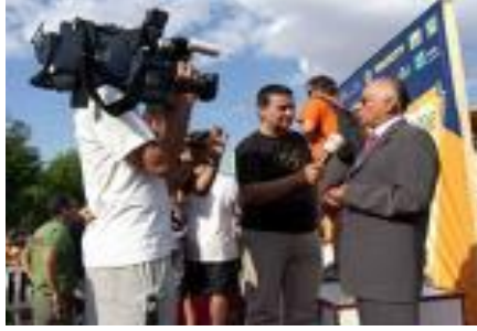
Resim 1.2: Televizyon haber görüntüsü

Kanun Türkiye’de ilk defa özel radyo ve televizyonların yayınlarını düzenleyen hükümler getirmiştir. Aynı zamanda bu Kanun, özel radyo ve televizyonlara hukukî bir nitelik kazandırmıştır. Kanunun getirdiği düzenlemeye göre; kamu ve tüm özel radyo ve televizyon kuruluşlarına kanal ve frekans bandı tahsis etmek, yayın izni ile lisans vermek ve bu tahsis ve izni iptal etmek yetkisi, Radyo ve Televizyon Üst Kuruluna (RTÜK) aittir.