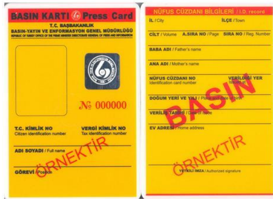
Resim 2.1: Sarı Basın Kartı örneği

Basın kartları, Basın Yayın Enformasyon Genel Müdürlüğü tarafından yerli ve yabancı basın yayın kuruluşlarında çalışan kişiler ile devletin enformasyon hizmetlerini yerine getiren kişilere, haber alış verişini kolaylaştırmak için bazı imkânlardan faydalanmaları amacıyla verilir.