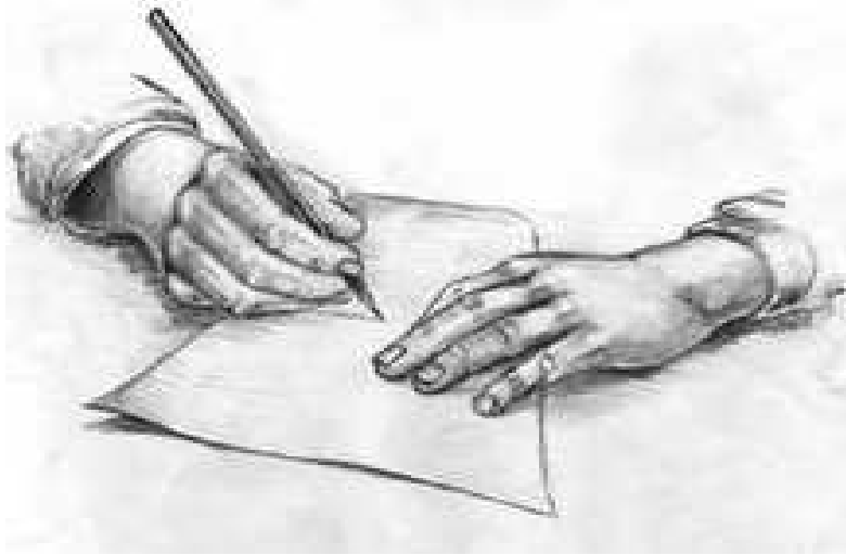
Resim 7: Dilekçe Hakkını tasvir eden karakalem çalışması

Ombudsman Meclis tarafından halkın şikâyetlerini dinleyip, çözümlere ulaştırmak üzere seçilmiş kimseye denilmektedir. Türkçe karşılığı olarak” kamu denetçisi, arabulucu, kamu hakemi”gibi tanımlar kullanılmaktadır. Ombudsman kamu hizmetlerinin yürütülüşündeki adaletsizlikler hakkında, konudan etkilenenlerden şikâyetleri almak, bu konularda araştırmalar yapmak ve sorunları çözmekle görevlendirilmiş, bağımsız bir kamu otoritesidir.