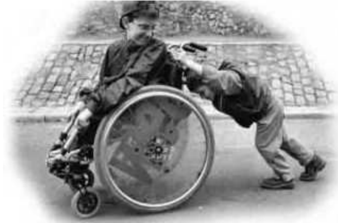
Resim 2: Yardımlaşma

Sosyal devletin ana öğelerinden biri millî geliri artırmak; bunun için yatırım yapmak, sosyal adalet kuralları içinde kalkınmayı sağlamaktır. Sosyal devletin ana öğelerinden diğeri millî gelirin adaletli dağılımını sağlamaktır. Sosyal devletin bir başka öğesi özgürlüklerin gerçekleşmesi için maddi imkân sağlamaktır. Bir diğerk sosyal devlet öğesi ise bireyleri sosyal güvenliğe kavuşturmaktır.