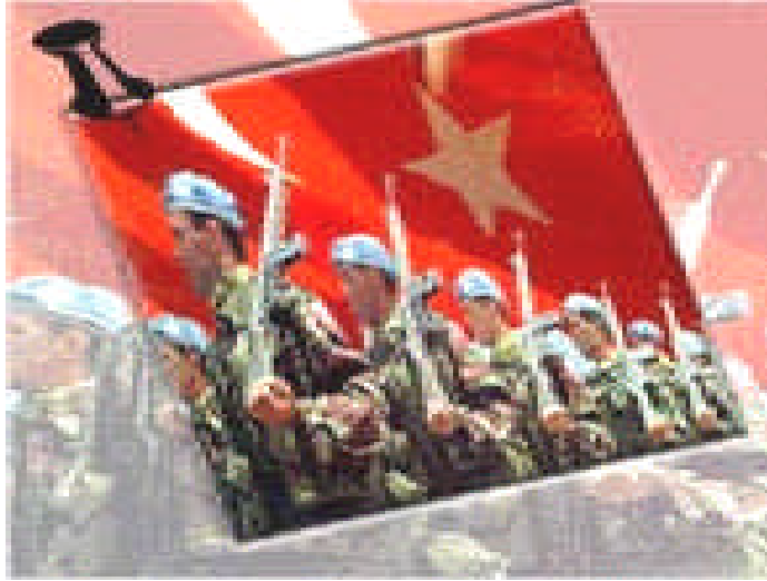
Resim 10: Türk Askeri

“Vatan hizmeti her Türk’ün hakkı ve ödevidir”(AY.Mad.72). Bu hizmet genel anlamda, Türklerin yüzyıllar boyunca en büyük fedakârlık ve bağlılıkla yerine getirmeyi bir vatan borcu olarak benimsediği askerlik hizmetidir. Yeni Anayasamızda askerlik hizmetine “vatan hizmeti” denilmiştir (AY. Mad. 72 ).