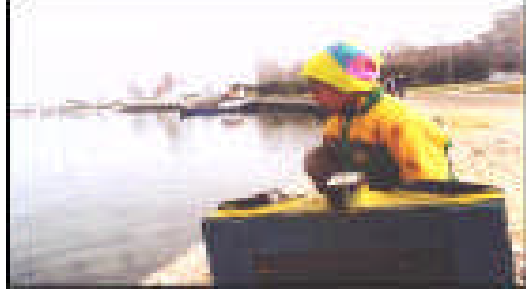
Resim 5:Sokak Çocukları