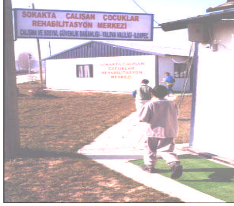
Resim 1: Devlet Tarafından Sokak çocuklarının Rehabilitasyonu İçin Açılan Merkezlerden bir görünüm

Sosyal devlet, fertlerin sosyal durumlarıyla ilgilenen, onlara asgari bir hayat düzeyi sağlamayı, sosyal adalet ve sosyal güvenliği gerçekleştirmeyi ödev sayan devlettir. Sosyal devlet, devletin, sosyal barışı ve sosyal adaleti sağlamak amacıyla sosyal ve ekonomik hayata aktif olarak müdahalesini gerekli gören bir anlayıştır. Sosyal devletin en belirgin özellikleri, kişiyi ekonomik hayatta yalnız bırakmaması, ekonomik hayata müdahale etmesi, herkes için insanlık onuruna yaraşır bir hayat seviyesi sağlamaya yönelik bir devlet biçimi olmasıdır. Sosyal devlet, sosyal adaleti gerçekleştirmek, bireyin ve toplumun refahını sağlamak ve sosyal güvenliği oluşturmak amaçlarını taşır.