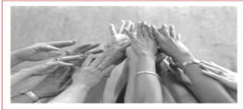
Resim 4: Yardım Bekleyen insanlar

Anayasamızda Kişinin Hakları bölümünde ele alınan koruyucu hakların (olumsuz statü hakları) neler olduğunu inceleyelim: