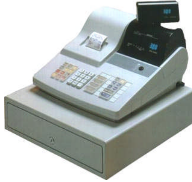
Resim 9: Yazarkasa

Vergi Ödevi: Vatandaşın vergi ödeyerek kamu giderlerinin karşılanmasına katılmasıdır. Vergi ödevi, temel vatandaşlık görevlerinden biri olarak Anayasamızda belirtilmiştir. “ Herkes, kamu giderlerini karşılamak üzere, mali gücüne göre, vergi ödemekle yükümlüdür” denilmektedir ( AY. Mad. 73 ).