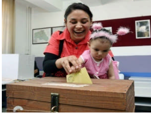
Resim 11: Oy Kullanma

Oy kullanma siyasal haklar içinde yer alan bir vatandaşlık hakkı ve ödevidir. Anayasamızın 67. maddesi “Vatandaşlar, kanunda gösterilen şartlara uygun olarak, seçme, seçilme ve bağımsız olarak veya bir siyasi parti içinde siyasi faaliyette bulunma ve halk oylamasına katılma hakkına sahiptir” diyerek oy kullanma hakkına işaret etmektedir.