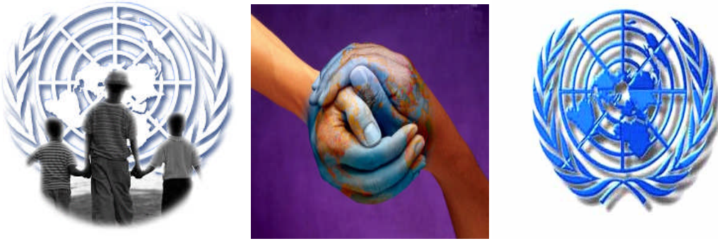
Resim 3: BM ve İnsan Haklarını temsil eden simgeler

Anayasamız, insanların insan olmaktan kaynaklanan temel hak ve hürriyetlerden faydalanacaklarını açıklamıştır. Anayasamızın 2. maddesinde Türkiye Cumhuriyeti “İnsan haklarına saygılı bir devlettir.” ifadesi yer almaktadır.