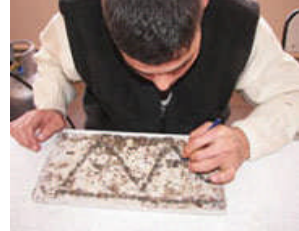
Gümüş işlemeciliği kursu