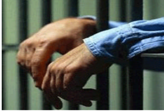
Resim 1.4: Hükümlü

Polis ve jandarma nezarethaneleri ülke genelinde polis ve jandarma merkezlerinde yer almaktadır. Nezarethaneler en az 7 metrekare genişliğinde, 2,5 metre yüksekliğinde ve duvarlar arası en az 2 metre mesafede olacak şekilde düzenlenir. Yakalama, Gözaltına Alma ve İfade Alma Yönetmeliği'ne göre, yeterli tabii ışık ve havalandırma, tuvalet ve lavabo ile hijyen ve uygun yatak koşulları sağlanmalıdır.