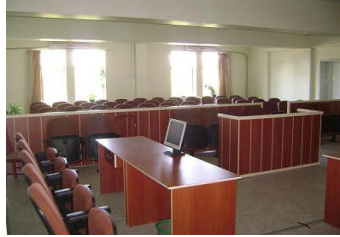
Resim 1.1: Klasik mahkeme salonu

Mahkeme kararıyla ilgili örnekler aşağıda sunulmuştur.