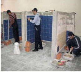
Çanakkale seramik kursu

Çocuk hükümlülerin çalıştırılması, yalnızca meslek eğitime yönelik olur. Öğretim kurumlarına veya örgün eğitime devam eden çocuk ile genç hükümlüler, öğretim yılı içinde atölye ve iş yerlerinde çalıştırılmaz.