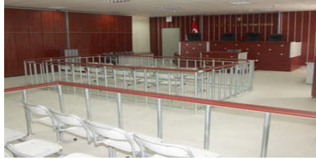
Resim 1.2: Mahkeme salonu