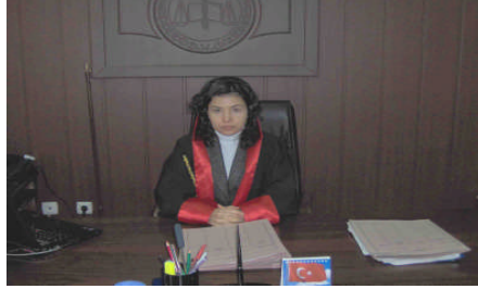
Resim 1.3: Cumhuriyet Savcısı