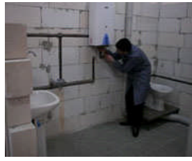
Doğal gaz kursu