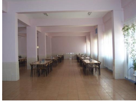
Resim 1.22: Yatılı özel eğitim yemekhanesi