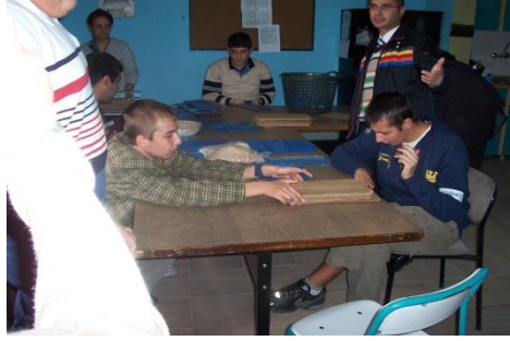
Resim 2.5: Zihinsel engelliler öğretmeni