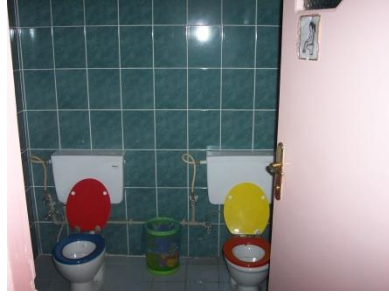
Resim 1.14: Özel eğitimde lavabolar ve tuvaletler