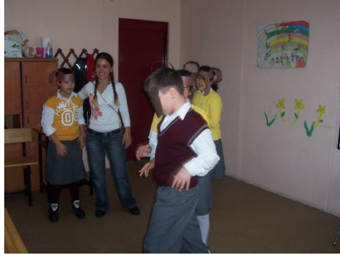
Resim 2.4: Özel eğitim öğretmeni