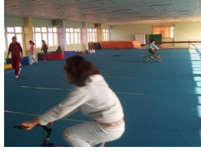
Resim 1. 17: Oyun salonunun bazı bölümleri