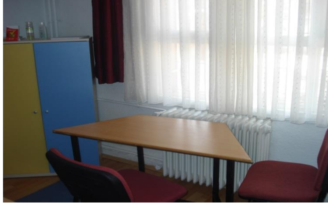
Resim1.16:Yalıtımı yapılmış, bireysel odası.