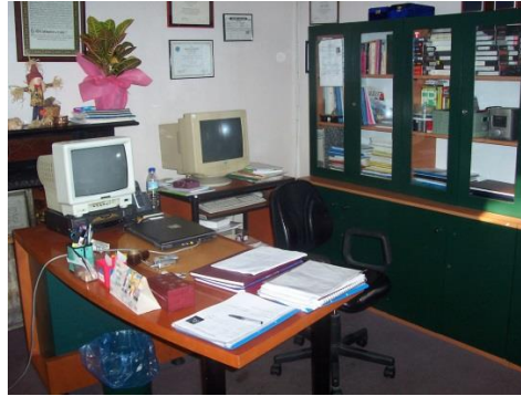
Resim 1.8: Büro donanımı