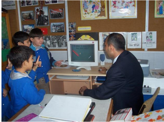
Resim 2.6: Sınıf öğretmeni