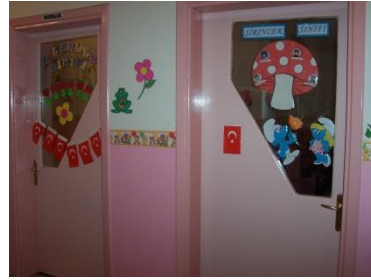
Resim 1.3: İç giriş

Müdür odası: Okul ve öğrencilerin kayıtlarının ve görüşmelerin yapıldığı yerdir. Gelen konukları karşılayacak şekilde olmalıdır. Binanın diğer bölümlerinin kontrolünü sağlayabilecek ve her bölüme kolay bağlantısı olan bir yerde olması gerekir. Girişe yakın yerde olmalıdır. Gerekirse velilerle burada görüşmeler yapılabilir.