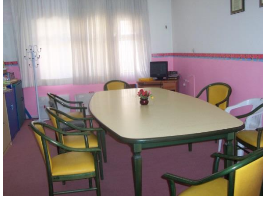
Resim 1.9: Personel odası