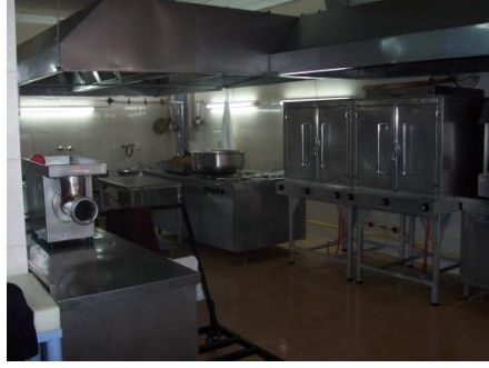
Resim 1.20: Yatılı özel eğitim mutfağı