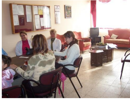
Resim 1.5: Personel odası

Personel odası: Okulda çalışanların eğitim dışında rahatça çalışma ve dinlenmelerini sağlayan ortamlar personel odalarıdır. Personel odaları gerekli durumlarda personel toplantılarının rahatça yapılabileceği genişlikte olmalıdır. Genişliği personel kapasitesini karşılayacak şekilde olmalıdır.