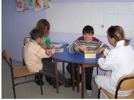
Resim 2.3: Çocuk gelişimi ve eğitmeni