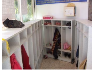
Resim 1.7: Giriş

Giriş: Okulun ilk alanı olması nedeniyle göze çarpıcı ilan ve duyuru panoları burada bulunur. Çocuklara ait etkinlik örnekleri de yer alır. Vestiyerler girişte bulunur ve depreme uygun olarak duvara monte edilir. Okulun büyüklüğüne göre danışma ve müracaat bölümü de buradadır. Okulun girişi aydınlık, ferah olmalıdır. Isıtma problemi olmamalıdır. Girişte ısı kaybını engellemek için önlem alınmalıdır.