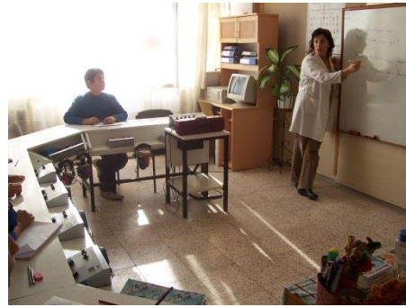
Resim 2.7: İşitme engelliler öğretmeni