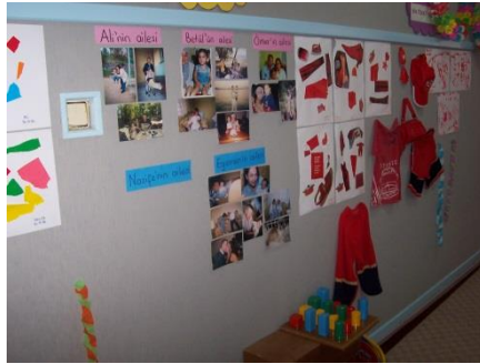
Resim 1.11: Grup eğitim odasından bazı bölümler