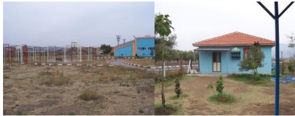
Resim 1.6: Bahçeden bazı bölümler

Otistik çocuklara eğitim verilen yerlerde suyla terapi için bahçede mutlaka çeşme bulundurulmalıdır. Özel eğitimde bahçe, binanın iki katı büyüklükte olmalıdır. Bahçe okulun çıkışına yakın yerde değil daha güvenli bir yerde olmalıdır. Bahçede çocukların okul dışına çıkmalarını önleyecek nitelikte koranaklar bulunmalıdır.