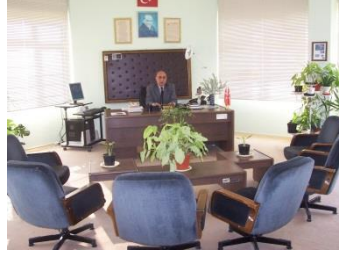
Resim 1.4: Müdür odası

Büro: Öğrencilerin dosyalarının, okula ait evrakların bulunduğu yerdir. Okulun memurlarının çalışma ortamıdır. Kayıt, kabul ve resmî işlemlerin yapıldığı, evrakların bulunduğu yerdir. Mali işler de burada yapılır. Büro, gelenlerle rahatça ilgilenmeye olanak sağlayacak büyüklükte olmalıdır. Yatılı özel eğitim kurumlarında büroda ambar memurları, muhasebeci gibi diğer elemanlar da çalışır.