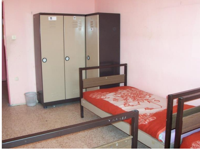
Resim 1.23: Yatılı özel eğitim kurumu yatakhanesi