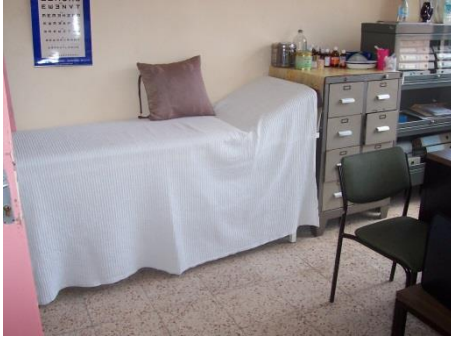
Resim 1.24: Revir

Rahatsızlanan çocuklar için hazırlanan revirde sedye, ilk yardım malzemeleri bulunur. Revir kayıt odasında sedye, kayıt evrakları, ilaç dolabı, evrak dolabı, masa, sandalye bulunur. Revirde rahatsızlanan çocuklar gözlem odasında gözetim altında tutulur. Isınma, aydınlatma, havalandırması düzgün olmalıdır.