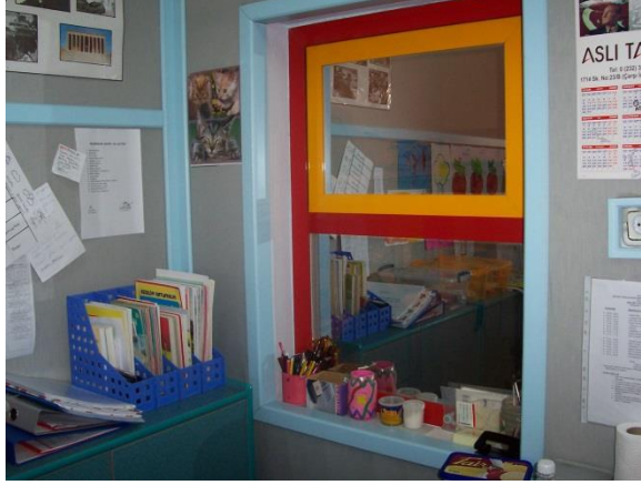
Resim 1.12: Gözlem odasının dışarıdan görünümü