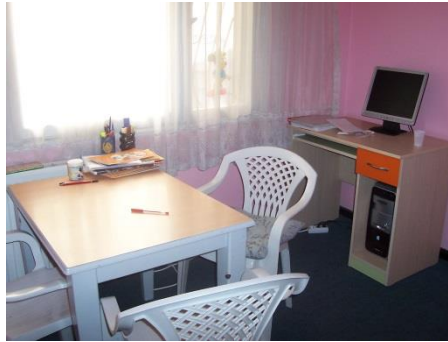
Resim 1.13: Bireysel eğitim odası