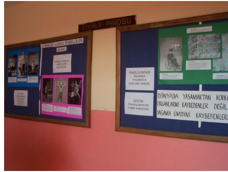
Resim 1.10: Bekleme odası ve duvar panoları