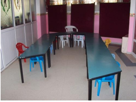
Resim 1.21: Tam gün özel eğitim yemekhanesi