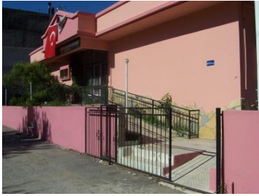
Resim 1.2: Dış giriş

Grup oyun odası doğrudan iç girişe açık olmalıdır. Binanın girişinde vestiyerlerin konup velilerin giriş ve çıkışlarını rahatça yapabilecekleri genişlikte olmalıdır. Bu giriş, sınıflara açılacak bir şekilde olmalıdır.