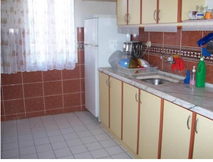
Resim 1.19: Tam gün özel eğitim mutfağı

Mutfakta aşçı, aşçı yardımcısı ve servis görevlileri çalışır. Menüler besin değerleri hesaplanıp eşit miktarlarda dağıtım yapılarak servis edilir.