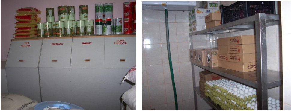
Resim 1.18: Yiyecek deposu ve soğuk hava deposu

Menüye uygun olarak her gün yiyecek çıkışı yapılır. Mutfak ve yemekhanede bunların dışında yiyecekler için buzdolabı, derin dondurucu da bulunur.