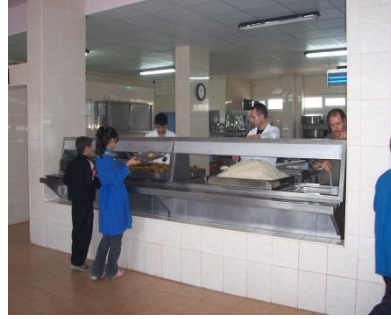
Resim 2.1: Aşçılar