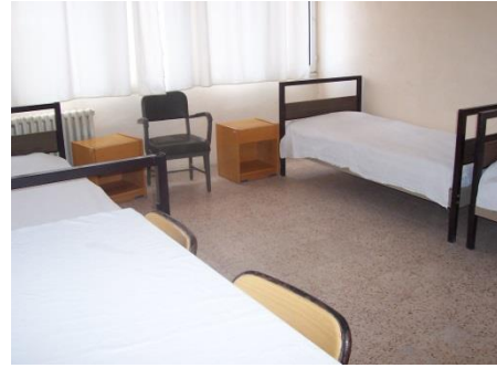
Resim 1.25: Gözlem odası