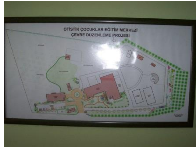
Resim 1.1: Özel eğitim kurumu mimari planı

Özel eğitim kurumları binasının plan ve projelerinin çiziminde, yapımında engellinin ve eğitimlerinin özellikleri göz önünde bulundurularak düzenlenmelidir. Engellinin serbestçe hareket edebileceği ve bağımsız yaşayabileceği olanaklar sunmalıdır.