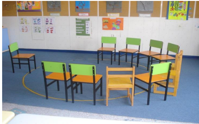
Resim1.15: Duvar ve zemin yalıtımı yapılmış, yarım daire oturma düzeni

Camlar çift cam olmalıdır. Kapı gıcırıtmasını engellemek için sürekli kapıda yağlama gibi düzenlemeler yapılmalıdır. Doğal aydınlatmanın yanında elektrikle aydınlatmalarda yukarıdan veya duvardan olmalıdır. Elektrik prizleri kapalı olmalıdır Bunun yanı sıra öğrencinin dinleme ve konuşma becerisinin geliştirmede çok etkili olan, öğrencinin dikkatini dağıtmayacak, birebir ders yapılabilecek bir ortamın sağlanması ve bu ortamın da yalıtımının yapılmış olması gerekir.