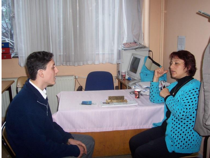
Resim 2.8: Rehber öğretmen

Görme engellilere hizmet verilen rehabilitasyon eğitim merkezlerinde rehber öğretmeni yerine sınıf öğretmeni de çalışabilir.