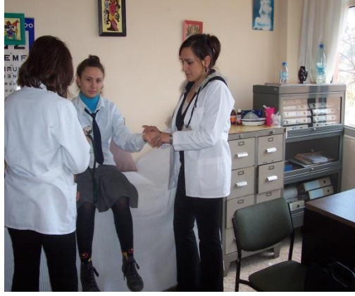
Resim 2.2: Hemşire