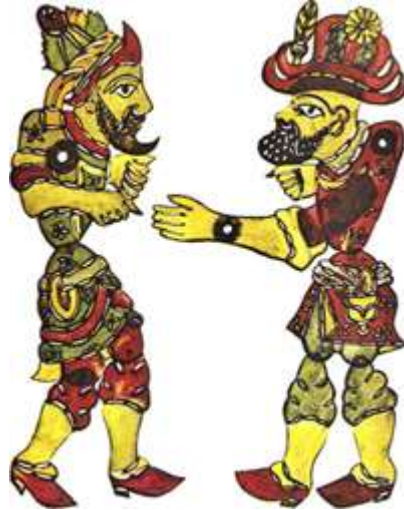
Resim 1.13. Türkiye'de gölge oyunu Hacivat ve Karagöz ile başlar

Gölge oyununun Karagöz adıyla anılması 17. yüzyılda olmuştur. “ Karagöz oyunu “ adına ilk kez Evliya Çelebi'nin Seyahatname' sinde rastlanmaktadır. Bu yüzyılda İstanbul'u ziyaret eden Batılı seyyahların anılarında, şehirde oynatılan Karagöz oyunundan bahsedilmektedir.