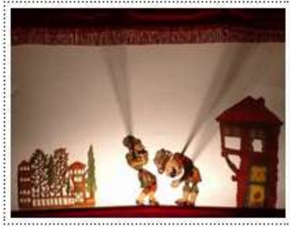
Resim 1.12. Hacivat karagöz gölge oyunundan bir sahne

Gölge oyununun Türkiye'ye 16. yüzyılda Mısır'dan geldiği görüşü, bilimsel bir görüş olarak öne çıkmaktadır. Metin And'ın araştırmaları sonucu ortaya koyduğu tespitlerden de anlaşılacağı üzere Mısır gölge oyunu ile Karagöz arasındaki benzerlik çok açıktır. Karagöz ve Hacivat tasvirleri, göstermelikler ve kimi oyunların içerik bakımından birbirine benziyor olması da bu görüşü kuvvetlendirmektedir.