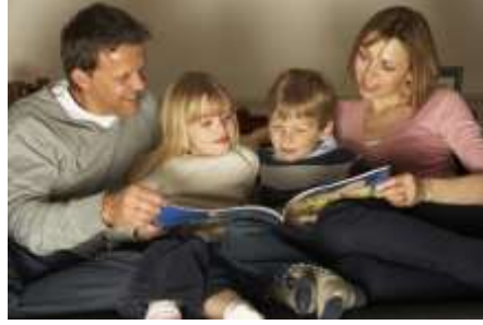
Resim 1.2. Kitap okuma alışkanlığının kazanılmasında aile çocuklara destek olmalıdır.