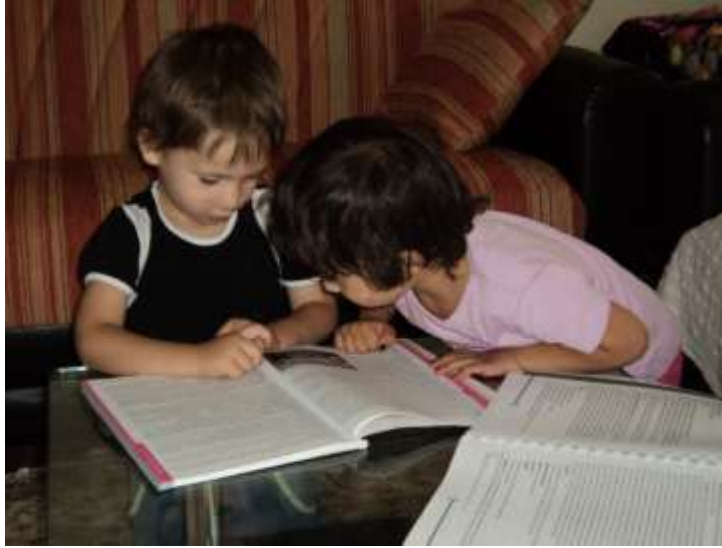
Resim: 1.1. Erken dönemde uygun yapıtlar çocuğu mutlaka olumlu yönde etkileyecektir.

Erken dönemde uygun yapıtlar, çocukları mutlaka olumlu yönde etkileyecektir. Okul öncesi dönemde kitapla ilgili deneyimler, çocukların daha sonraki yıllarda okumayı öğrenmeye karşı duygu ve tutumlarını oluşturmada ilk adımlardır. Bu nedenle okul öncesi dönemin ve resimli kitapların önemi dikkatlerden kaçmamalıdır.