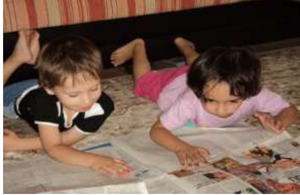
Resim 1.11. Çocuklar gazetenin resimlerine bakarak gazete okunduğu duygusunu yaşarlar.