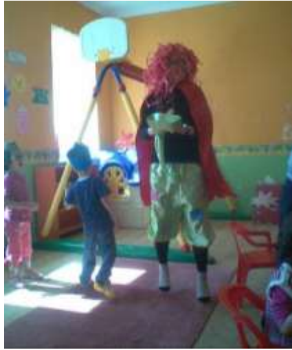
Resim 1.10. piyeste rol alan öğrencilerle birlikte prova yapılır.