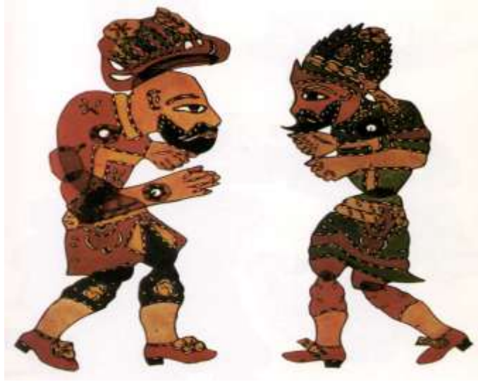
Resim 1.14. Karagöz ve Hacivat Oyunu

Karagöz ve Hacivat'ın “ Kütahya Çeşmesi “ oyunundan bir bölüm.