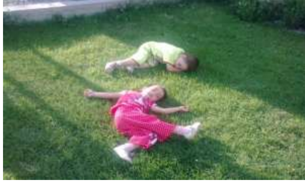
Resim 1.8. Okuma Parçası Örnekleri

Bir varmış bir yokmuş. Bir çocuk varmış, adı çocukmuş. Bu çocuk geceyi hiç sevmezmiş. Çünkü gece olunca annesi ona “ haydi bakalım uyku saati geldi. “ dermiş ama çocuk uyumak istemezmiş “Uyumak hiç güzel değil.“ dermiş annesine. “ Ben uyumayacağım! “