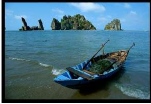
Resim 1.5. Masal Örnekleri

Fakat içinde ne balık vardı, ne bir canavar ne de dehřetli bir řey.