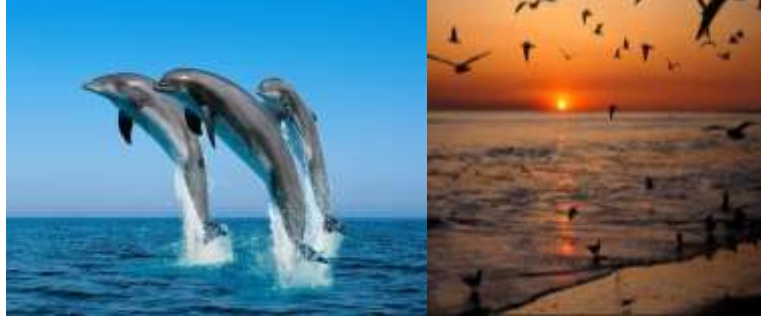
Resim 1.7. Masal Örnekleri

Genç balıkçı her akşam denize açılıp denizkızını çağırıyor, kız da sudan çıkıp ona şarkı söylüyordu. Etrafında yunuslar yüziyor, başının üstünde yabani martılar dönüyordu.