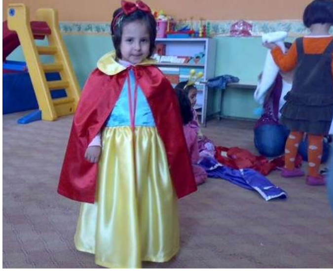
Resim 1.9. Okul öncesi eğitim kurumlarında haftanın anlam ve önemini yansıtan çocuk piyes ve tiyatroları düzenlenebilir.