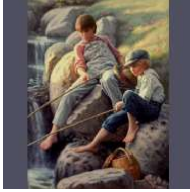
Resim 1.3. Masal Örnekleri

Rüzgâr karadan estiği vakitler çoğunlukla bir şey yakalayamazdı. Yakalarsa da yakaladığı şey çok az olurdu.