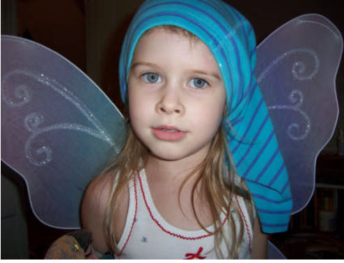
Resim 1.8: Kelebek kostümü

Güncel kostümler animasyonda canlandırılacak karakterin özelliğine göre hazırlanır. Çocuklara anlatılacak konuya göre bu kostümlerin özellikleri belirlenir. Bu kostümleri hazırlamak için bazen eldeki mevcut giysilerin aksesuarlar ile desteklenmesi yeterli olabilir. Doktor, hemşire, pilot, asker, polis kostümleri, kelebek, ağaç ve çiçek kostümleri veya cansız nesnelerin kostümlerini bu kategoriye alabiliriz.