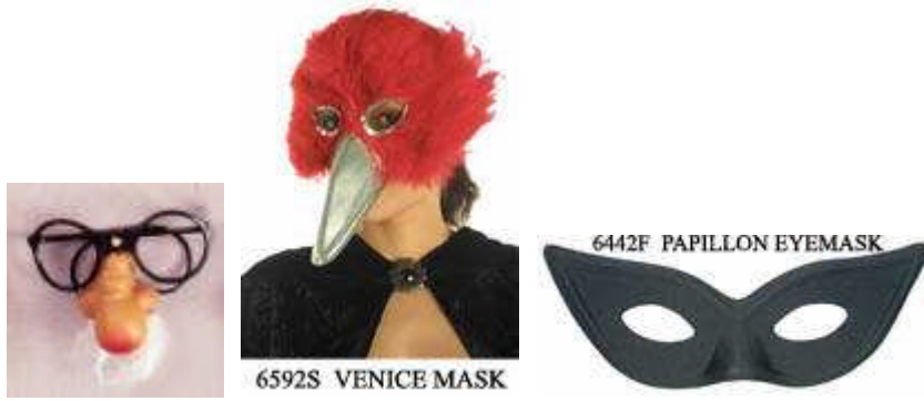
Resim 3.6: Burun ve gözlük Resim 3.7: Maske Resim 3.8: Göz Maskesi aksesuarı

Kostüme uygun aksesuarlar kostümün özelliğine göre farklılık gösterir. Bazen bir gözlük, peruk bazen de farklı özellikteki başlıklar kostümün tamamlayıcısı olabilir. Eldivenler, takılar, maskeler, kemerler, papyon ve kravatlar da kostümü tamamlayan aksesuarlardandır.