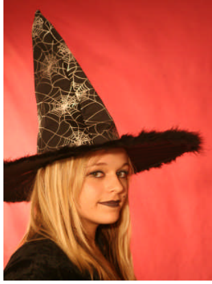
Resim 4.7: İllüzyon sadece göz yanılmalarına dayanan bir oyun türüdür

İllüzyon, göz yanılmalarına dayanan bir gösteri türüdür. İllüzyon, uzun eğitim süreci içinde öğrenilebilen bir sahne oyunudur. İllüzyonist, bu oyunları icra eden kişidir. Sihirbazlık eğitimi, sahne bilgisi, illüzyon repertuarı bilgisi, değişik mekan teknikleri, oyun uygulama teknikleri, beden kullanımı ve beden dili, seyirci psikolojisi, ışık bilgisi, makyaj bilgisi, kostüm bilgisi, araç yapımı bilgisi, sihirbazlık tarihi bilgisi gibi pek çok konuyu kapsar.