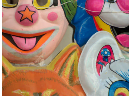
Resim 4.1: Çocuklara yönelik animasyonlarda canlı renkler içeren maskeler kullanılmalıdır

Animasyon etkinliklerinde kullanılacak kostüm, kukla, başlık ve maskelerde korkutucu figürler kullanılmamalı, çocukların hoşlanacağı sevimli ve ilgi çekici özellikleri içeren figürler tercih edilmelidir.