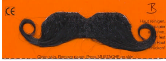
Resim 3.13: Bıyık