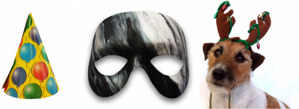
Resim 3.9: Yeni yıl şapkası

Okul öncesi eğitim kurumlarında birçok çalışmada başlık ve şapkalar kullanılabilir. Çocuklar bu aksesuarları drama çalışmalarında, oyun ve müzik etkinliklerinde de kullanabilirler. Aksesuar olarak kullanılacak malzemenin sağlık açısından bir sakıncasının olmaması ve işlevsel olması önemlidir. Kumaşlar, deri parçaları, ipler, tüyler ve pek çok artık malzeme aksesuar hazırlamada kullanılabilen materyallerdendir.