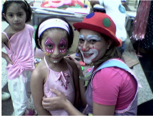
Resim 1.4: Palyaço kostümü