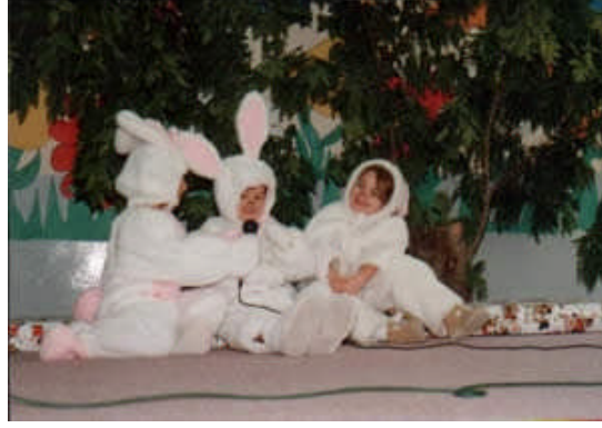
Resim 2.1: Canlandırılacak karakterin özelliklerine uygun kostümün belirlenmelidir

Etkinlikte hangi kostümün kullanılacağı belirlendikten sonra modelin çizimi konusunda stilistlerden, kalıplanması konusunda modelistlerden ve dikimi konusunda terzilerden yardım alınabilir. Ancak hazırlanan kostümün aslına uygunluğu da önemli bir durumdur. Bu tespit aşamasında görsel kaynaklardan ve fotoğraflardan yararlanılmalıdır.