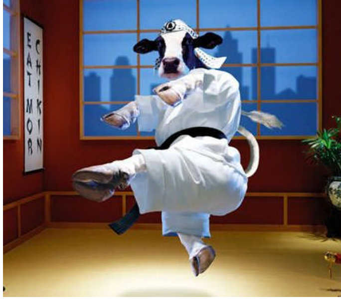
Resim 3.14: İnek kostümü