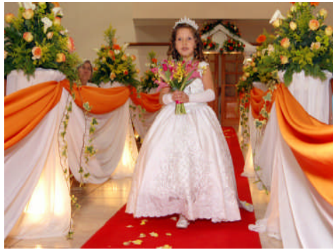
Resim 3.5: Prenses kostümü

Animasyonlarda kullanılmak üzere satın alınan, dikilen veya diktirilen kostümler sadece kostüm olarak elde edilmiş olur. Elde edilen kostüm canlandıracağı karaktere uygun olarak süslenmesi gereklidir. Hazırlanmış kostümlere uygun aksesuarlar seçilerek kostüm amacına uygun hale dönüştürülebilir.