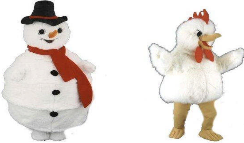
Resim 2.3: Kostüm amaca uygun seçilmeli ve hazırlanmalıdır