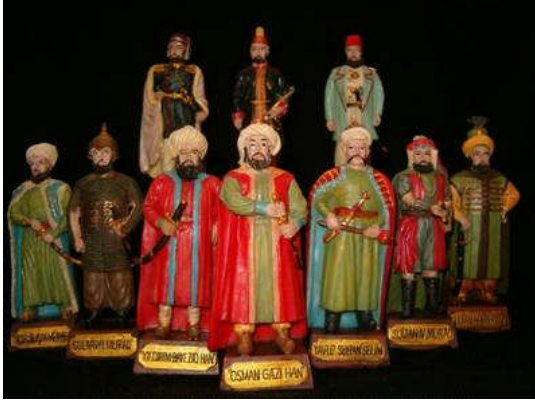
Resim 1.13: Osmanlı Padişahları