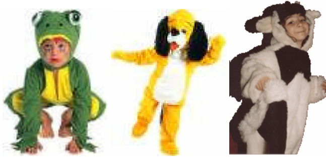
Resim 3.2: Kurbağa kostümü Resim 3.3: Köpek kostümü Resim 3.4: Ayı çocuk kostümü

Animasyonlarda canlandırılacak olan karakterler çok özel ve tarihi karakterler değil ise hazır kostüm bulmak mümkündür. Canlandırılacak olan karakterler, meslekler ise bununla ilgili kostümleri edinmek ya da oluşturmak daha kolaydır. Bazen küçük bir aksesuar ile de kostüm amacına uygun bir hale dönüştürülebilir. Özellik gerektiren karakterlerin kıyafetleri için ise uzman kişilerden yardım alınabilir. Tiyatro kostüm arşivleri de bilgi alma konusunda yararlanılabilecek yerlerdendir.