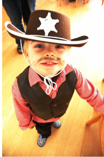
Resim 22: Etkinlikte hangi kostümün kullanılacağı önceden belirlenmelidir

Etkinlikte hangi kostümün kullanılacağı belirlendikten sonra modelin çizimi konusunda stilistlerden, kalıplanması konusunda modelistlerden ve dikimi konusunda terzilerden yardım alınabilir. Ancak hazırlanan kostümün aslına uygunluğu da önemli bir durumdur. Bu tespit aşamasında görsel kaynaklardan ve fotoğraflardan yararlanılmalıdır.