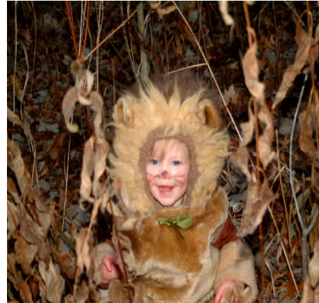
Resim 1.11: Aslan çocuk kostümü