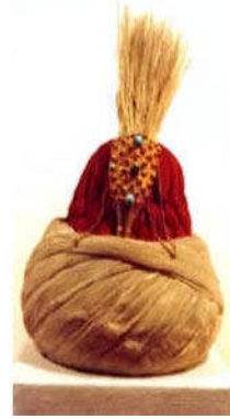
Resim 114: Padişah tacı