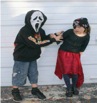
Resim 1.10: Hayalet ve korsan kız kostümü

Güncel kostümlerin hazırlanmasında çocukların katılımları da sağlanabilir. Çocukların hazırladıkları kostümleri daha sonra sergileyecekleri etkinlikte giymeleri onları daha çok motive edecektir. Ayrıca çocukların bu hazırlıklarda yer alması onların yaratıcılıklarını ve hayal güçlerini de olumlu yönde etkileyecektir.