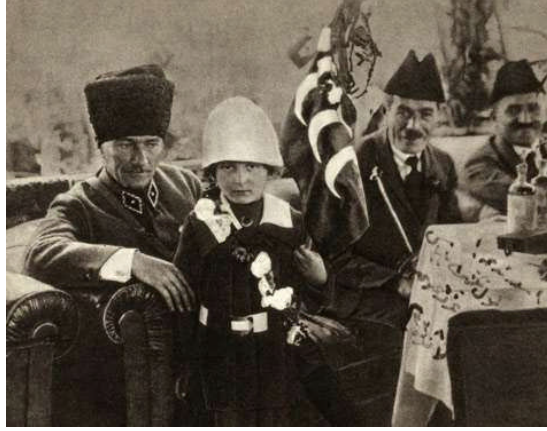
Resim 1.12: Atatürk'ün askeri üniforması

Tarihte önemli işler yapmış olan komutan, devlet adamı, kralların kostümleri yaşadıkları dönemlerde giymiş oldukları giysilerdir. Bu giysilerden bazıları giysiyi giyen kişiler ile özdeşleşmiştir. Örneğin Atatürk'ün askeri giysileri, Osmanlı padişahlarının giysileri, Sezar'ın altın yapraklar ile süslü tacı ve elbisesi, Napolyon'un şapkası gibi.