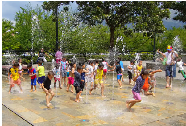
Resim 4.9: Animasyonların çocukları ruhsal olarak tatmin edici ve eğlendirici olması gerekir

Animasyonlar ister çocuklar tarafından hazırlansın, isterse çocuk seyirci olarak katılsın, bu etkinliklerin çocukları ruhsal olarak tatmin edici ve eğlendirici olması gerekir. Animasyon etkinlikleri, çocuğu zorlayacak veya ruhsal anlamda zarar verecek nitelikte olmamalıdır.