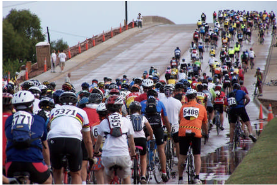
Resim 4.5: Yarışmalar çocuklar için teşvik edici ve özendirici olmalıdır

Çocuklara düzenlenen yarışmalarda amaç, onlara olumlu davranış ve bilgi kazandırmak olmalıdır. Bazı çocuklar pasifize edilip bazıları ön plana çıkarılmamalıdır. Yarışmalar çocuklar için teşvik edici ve özendirici olmalıdır. Yarışma sonunda kazanan yarışmacılar mutlaka ödüllendirilmelidir ancak ödüller yarışmanın niteliği doğrultusunda olmalı amacını aşmamalıdır.