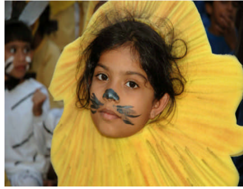
Resim 1.9: Çiçek kostümü

Güncel kostümlerin hazırlanmasında çocukların katılımları da sağlanabilir. Çocukların hazırladıkları kostümleri daha sonra sergileyecekleri etkinlikte giymeleri onları daha çok motive edecektir. Ayrıca çocukların bu hazırlıklarda yer alması onların yaratıcılıklarını ve hayal güçlerini de olumlu yönde etkileyecektir.