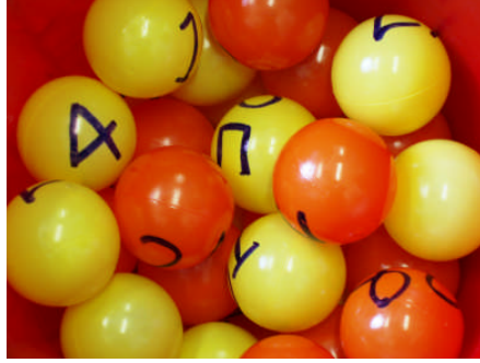
Resim 4.4: Çekilişlerin amacı bazen eğlence bazen de yardımlaşmadır