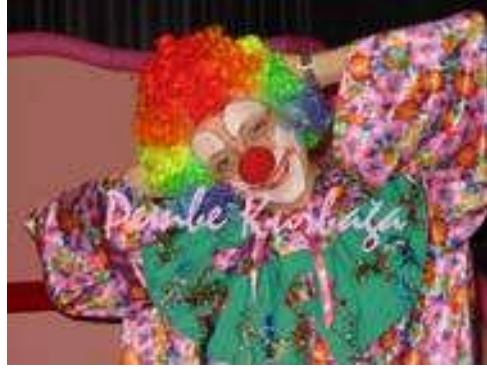
Resim 1.3: Palyaço kostümü