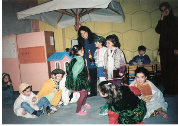
Resim 4.6: Her oyunun kendine özgü kuralları vardır

Oyun; çocuğun tüm gelişim alanlarına yardımcı olan, toplum kurallarına saygılı olmayı öğreten, aynı zamanda hoş vakit geçiren bir eğitim sürecidir. Oyunu amacı çocuğu fiziksel, sosyal, psiko-motor, zihinsel, dil, duygusal gelişimini sağlayarak onları yaratıcı, araştırmacı, kendileri ve çevreleriyle barışık birer birey olarak topluma kazandırmaktır.