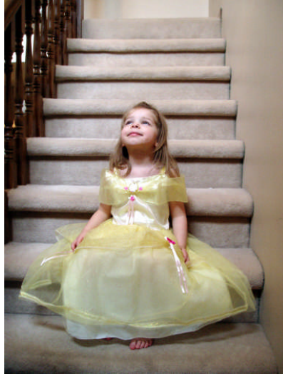
Resim 1.1: Kostümsüz animasyon sadece anlatım ile sınırlı kalır

Çocuklar kostümler ile farklı yaşamları, ülkeleri ve gelenekleri öğrenirler. Meslekleri tanırlar. Çocukların sosyalleşmesinde ve problemlere çözüm yolu geliştirmelerinde de kostümler oldukça yararlıdır. Okul öncesi eğitim kurumlarında çocuklara uygun kostüm ve aksesuarların bulundurulması da son derece önemlidir. Bu nedenle kostüm ve aksesuarlara uygun bir dolabın ya da köşenin hazırlanması gereklidir. Sadece animatörlerin değil, okul öncesi alanında çalışan eğitimcilerin ve çocuklarında pek çok etkinlikte kullanacakları kostümler hazırlanabilir.