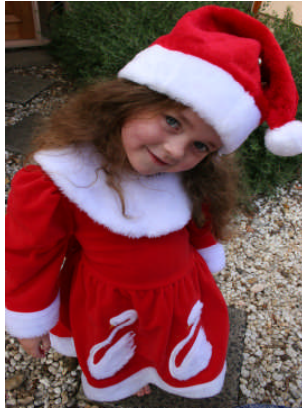
Resim 3.1: Yeni yıl kostümü

Kostüm ve aksesuarları hazırlamada kullanabileceğimiz pek çok malzeme vardır. Bu malzemeler; renkli ve canlı kumaşlar ( kadife ve polar), doğadan temin edilebilecek malzemeler ( ağaç dalları, yapraklar, ), karton ve kâğıtlar olabilir. Kostüm ve aksesuarların hazırlanması aşamasında çocuklardan da yardım alabileceğimiz noktalar olabilir ancak uzmanlık gerektiren konularda uzman kişilerden yardım almalıyız. Örneğin çizim ve dikim konularında stilistlerden ve terzilerden yardım almalıyız.