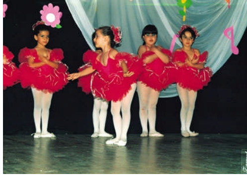
Resim 4.3: Danslı müzik etkinlikleri özel organizasyonların önemli ve ilgi çeken etkinliklerindedir

Danslı müzik etkinlikleri özel organizasyonların önemli ve ilgi çeken etkinliklerindedir. Uygulamaların canlı müzik eşliğinde gerçekleştirilmesi etkinliğin ilgi çekiciliğini daha da artırır. Dans konusunda eğitilmiş, yeterli ve çocuk psikolojisinden anlayan kişilerin çocukları bu konuda yetiştirmesi daha uygundur. Çocuklar bu çalışmalar esnasında hem keyif alabilmeli hem de sorumluluk duyguları geliştirilmelidir.