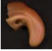
Resim 3.12: Burun