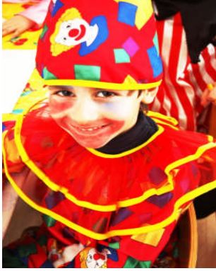
Resim 1.2: Palyaço kostümü

Palyaço kostümleri, animasyon gösterilerinde kullanılan ve çocukların çok ilgisini çeken kostümlerdir. Bu kostümler genelde abartılı olarak hazırlanır. Renk ve desenleri abartılı seçilerek makyajı değişik nitelikte yapılır. Çocuk için eğlenceli ve komik nitelikte olmalıdır. Küçük yaş grubu çocukların bazen korkup çekindiği palyaço kostümleri, ileri yaşlarda partilerde ve eğlencelerde en çok görmek istedikleri kostüm türü haline dönüşür. Bu kostümlerin çocuklara sevdirmesinde animatörlerin etkisi de yadsınmaz.