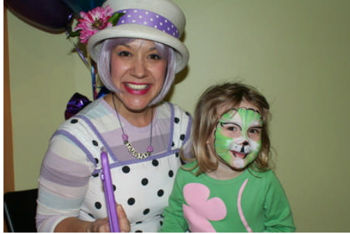
Resim 2.4: Yapılacak makyaj kostümün özelliklerine uygun olmalıdır

Kostümelerde kullanılan aksesuarlar nasıl kostümün ayrılmaz bir parçası ise makyaj da kostümün tamamlayan ve yardımcı bir öğesidir. Yapılacak makyajın kostümün özelliklerine uygun olması önemlidir. Örneğin bir palyaço kostümüne uygun palyaço makyajı yapılmalıdır. Makyajın renk seçiminin de kostümün özelliklerine uygun olması gerekir.