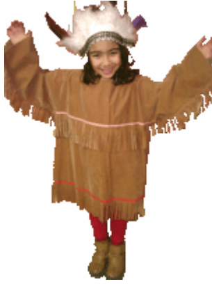
Resim 1.5: Kızılderili kostümü

Her ülkenin kendi kültürel özelliğine uygun olarak kullandığı giysileri vardır. Bu kostümlerin pek çoğu günümüzde kullanılıyor olmasa da ülkelerin ve toplumların simgesi olduğu için o ülkenin tanıtımında önemli bir ayrıntı olmasından dolayı animasyon gösterilerinde kullanılır.