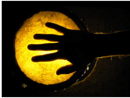
Resim 4.8: İllüzyon oyunları seyircinin oldukça ilgisini çeken bir animasyon türüdür

İllüzyon gösterileri oldukça geniş kapsamlı bir animasyondur. Bu gösteriler genellikle büyük salonlarda, sirklerde, panayırda, fuarlarda ve eğlence yerlerinde yapılır. İllüzyon oyunları seyircinin oldukça ilgisini çeken bir animasyon türüdür. Bu gösteriler seyirci için her an sürprizlerle doludur. Seyircinin ilgi ve dikkatini uzun süre en üst düzeyde tutar.