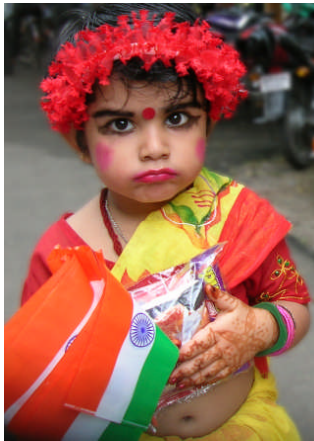
Resim 1.7: Hintli çocuk kostümü

Kızıl derili kostümleri, Eskimo kostümleri, Japon kostümleri, Arap kostümleri, Hintli kostümleri farklı nitelikleri olan kostümlerdendir. Kostümler çocuklara o ülkenin niteliklerini anlatmada da oldukça etkindir. Örneğin kızıl derililer, görünüşleri, yaşam tarzları, çadırları, giysileri, araç gereç ve takıları, müzikleri ile çocukların ilgisini çeken bir toplumdur.