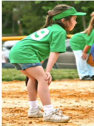
Resim 4.2: Pek çok spor türü de aynı zamanda animasyon gösterisidir

Spor, insanın beden ve ruhsal yapısının koordineli bir şekilde eğitilmesidir. Sporu hem yapanlar hem de izleyenler bu gelişime eğitime katılırlar. Pek çok spor türü de aynı zamanda animasyon gösterisidir. Basketbol maçlarının devre aralarında pon pon kızların müzik eşliğinde dans gösterisi sunması bir animasyon örneğidir.