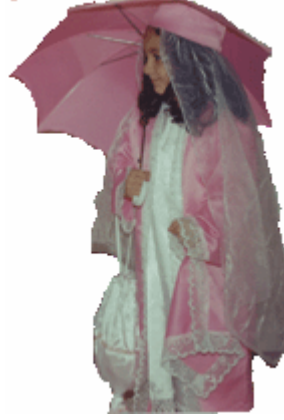
Resim 1.6: Katibim oyunu kostümü

Kızıl derili kostümleri, Eskimo kostümleri, Japon kostümleri, Arap kostümleri, Hintli kostümleri farklı nitelikleri olan kostümlerdendir. Kostümler çocuklara o ülkenin niteliklerini anlatmada da oldukça etkindir. Örneğin kızıl derililer, görünüşleri, yaşam tarzları, çadırları, giysileri, araç gereç ve takıları, müzikleri ile çocukların ilgisini çeken bir toplumdur.