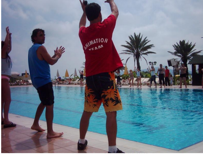
Resim 1.1: Havuz başı aktiviteleri

Gün içinde havuz başında veya havuz içinde yapılan her türlü aktivite için kullanılan bir alandır. Su topu yarışmaları, su balesi, su jimnastiği çalışmaları, stretching (sabah sporu), su basketbolu vb. birçok aktivite için havuz çalışma alanı olarak kullanılır.