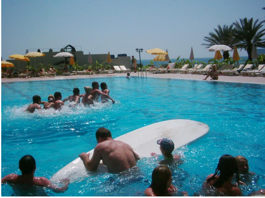
Resim 1.2: Havuz yarışmaları