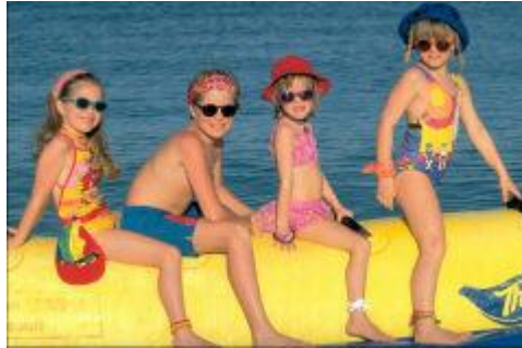
Resim 1.3: BananaResim

Eğlence hizmetleri alanında en çok kullanılan çalışma alanlarından biridir. Uygulanacak aktivite çeşitliliği, tesisin sahip olduğu sahil bandının genişliğine ve yapısına bağlıdır. Artık klasikleşmiş ‘Beach Volley (plaj voleybolu)’in yanı sıra; sörf, jet ski, banana vb. gibi aktiviteler de uygulanmaktadır.