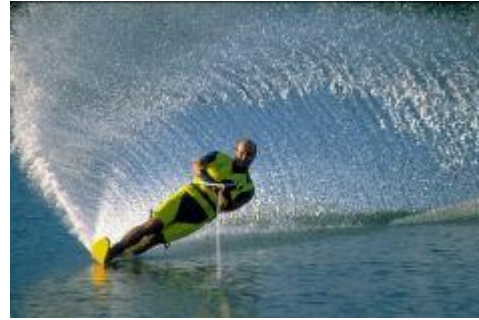
Resim 1.6: Sörf