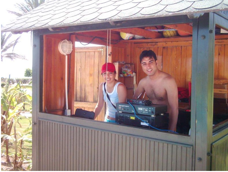
Resim 1.12: Havuz başı ses kabini