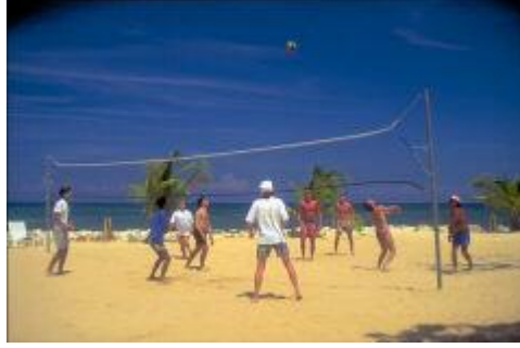
1.4: Plaj voleybolu