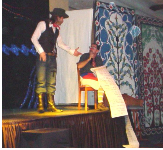
Resim 2.4: Kovboy

Kaza ve yaralanma gibi riskler sadece katılımcılar ya da konuklar için değil, aynı zamanda animatörlerin de karşılaşılabileceği risklerdir. Örneğin bir dans gösterisi sırasında kaygan bir zeminde dansçının ayağının kayması, çeşitli yaralanma ya da kırıklara neden olabilir. Böyle bir durum hem konukların ve gösterinin olumsuz etkilenmesine hem de aynı gösterinin belki de dansçı iyileşene kadar gerçekleştirilememesine neden olur. Her ikisinin sonucunda da ortaya konuk memnuniyetsizliği ve iş kaybı çıkar. Buna engel olmak için çalışma alanının sürekli kontrol edilmesi, gerektiğinde risk olabilecek durumların gösteri ya da aktivite sırasında bile ortadan kaldırılması gerekecektir.