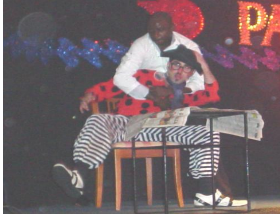
Resim 2.5: Sihirli doktor gösterisi

Kaza ve yaralanma gibi riskler sadece katılımcılar ya da konuklar için değil, aynı zamanda animatörlerin de karşılaşılabileceği risklerdir. Örneğin bir dans gösterisi sırasında kaygan bir zeminde dansçının ayağının kayması, çeşitli yaralanma ya da kırıklara neden olabilir. Böyle bir durum hem konukların ve gösterinin olumsuz etkilenmesine hem de aynı gösterinin belki de dansçı iyileşene kadar gerçekleştirilememesine neden olur. Her ikisinin sonucunda da ortaya konuk memnuniyetsizliği ve iş kaybı çıkar. Buna engel olmak için çalışma alanının sürekli kontrol edilmesi, gerektiğinde risk olabilecek durumların gösteri ya da aktivite sırasında bile ortadan kaldırılması gerekecektir.