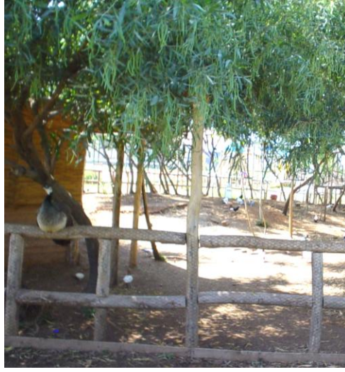
Resim 1.9: Minyatür hayvanat bahçesi

Eğlence hizmetlerinin her aşamasında, konukların yaratıcılık ve beklentileri, aktivitelerin belirlenmesinde ve uygulanmasında önemli bir yer teşkil etmektedir. Örneğin, standart dart oyununda dart oklarının farklı bir şekilde atılması yaratıcılığın kullanılarak değişikliğe ve bu değişikliğin de beraberinde daha eğlenceli bir hâl almasına neden olacaktır.