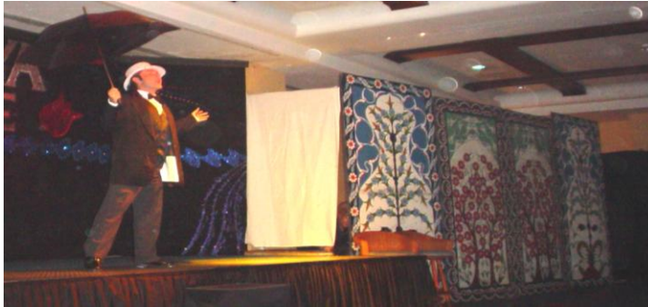
Resim 2.3: Dans gösterisi

Ayrıca bazı aktiviteler yapıldığında katılımcılarda belirgin sağlık problemlerinin ortaya çıkmasına neden oluyorsa bu konuda da konuklar önceden uyarılmalıdır. Örneğin bir kalp ya da tansiyon rahatsızlığı olan katılımcılar için riskli olabilecek aktivite, spor, yarışma ya da oyunlarla ilgili olarak konuklar mutlaka bilgilendirilmeli ve bu konukların bu aktivitelere katılmamaları belirtilmelidir.