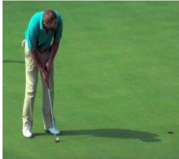
Resim 1.8: Golf

Golf gibi atıcılık ve binicilik de özel alanlar gerektirdiği için tesisin yeterli ve uygun arazi ihtiyacı ortaya çıkar.