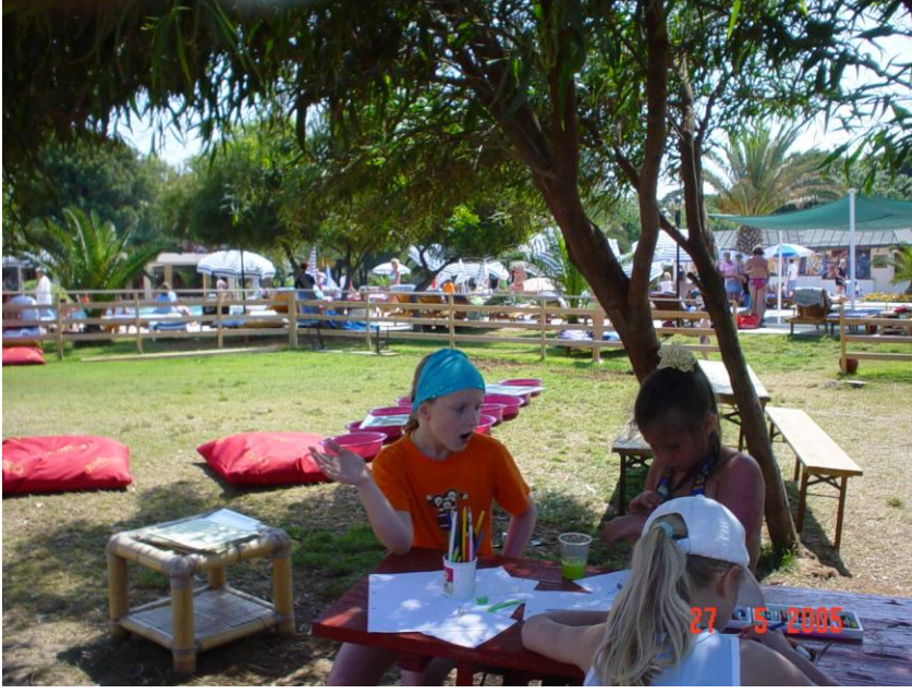
Resim 1.11: Çocuk kulübü aktivite alanı