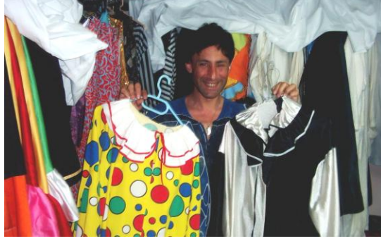
Resim 1.10: Sahne arkası

Havadar, temiz, sahneye içerdeki sesi iletmeyen, yeterli ışıklandırılmış kulisin, kostüm ve aksesuarların düzenli bir şekilde bulundurulacağı alanların bulunduğu sahne arkası ile gösteriler daha problemsiz ve aksamadan gerçekleşecektir. Bunun dışında düzeni sağlamak için oluşturulmuş “sahne arkası (back stage) kuralları” da sistemde kullanılmaktadır. Bu kurallar tam bir standart oluşturmamakla birlikte genellik arz etmektedir.