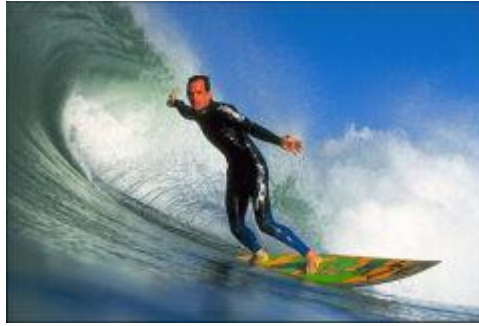
Resim 1.5: Sörf