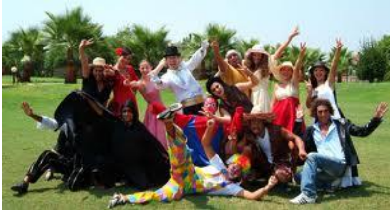
Resim 2.1: Animatörler

Özellikle gösterilerde sahne düzeni hazırlanırken dekor ve aksesuarların yerlerinin çok iyi düşünülmesi gerekir. Eğer dekor ve aksesuarların yerleştirme şekilleri sahnede hareket imkânını kısıtlıyorsa gösteri sırasında risk oluşturacaktır. Gösteri sırasında kullanılan bir malzeme rasgele sahneye atılıyor veya bir kumaş parçasının animatörün ayağına takılma riski ortaya çıkıyorsa mutlaka bunlarla ilgili çözümler üretilmeli ve gösterinin o evresi farklı bir şekilde düzenlenmelidir. Malzemenin risk oluşturmayan bir yere atılması, kumaşın aktivitenin özelliğini bozmayacak bir yere konulması ya da ölçülerinin değiştirilmesi vb. farklı tedbirlerin alınması ile mümkün olduğunca risk unsuru oluşturmayacak şekilde düzenlemelerin yapılması mümkündür.