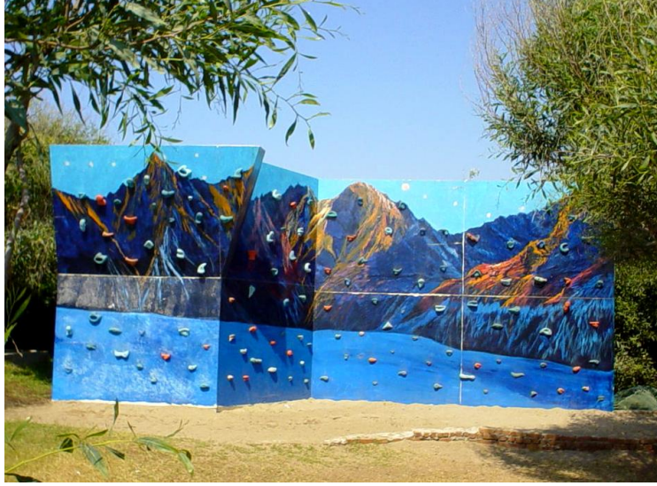
Resim 1.7: Tırmanma duvarı