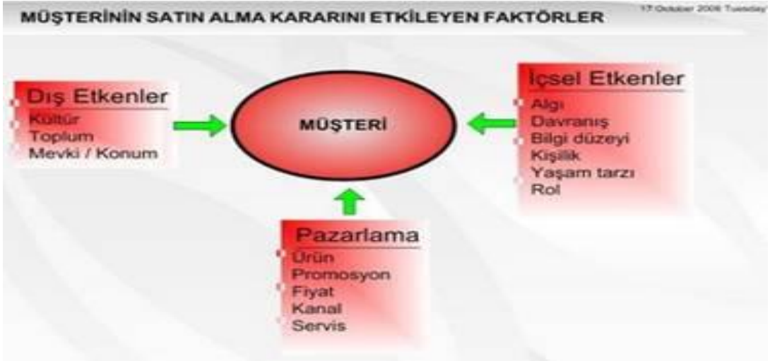
Şekil 1.1: Satın alma kararı etkileyen faktörler