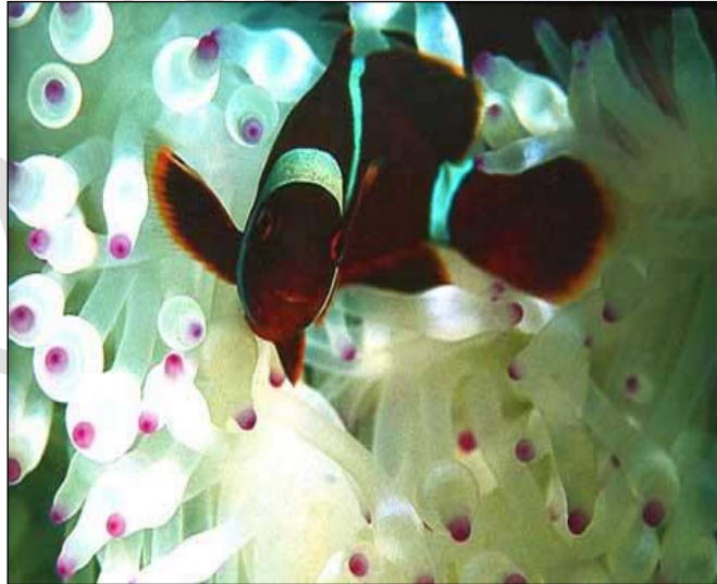
Fotoğraf 1.4: Su altı fotoğraf örnekleri